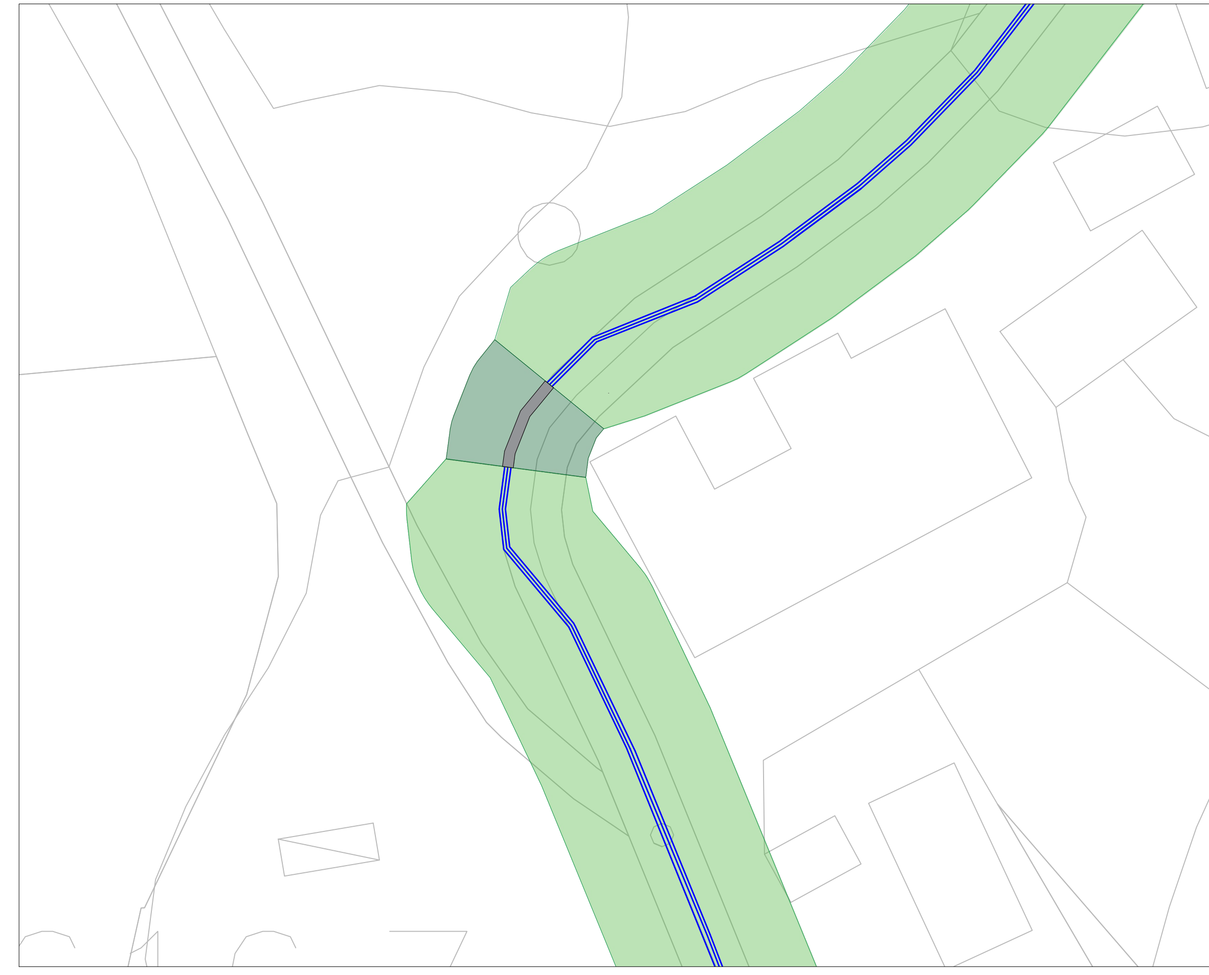
INQUADRAMENTO 3 Scala 1:250