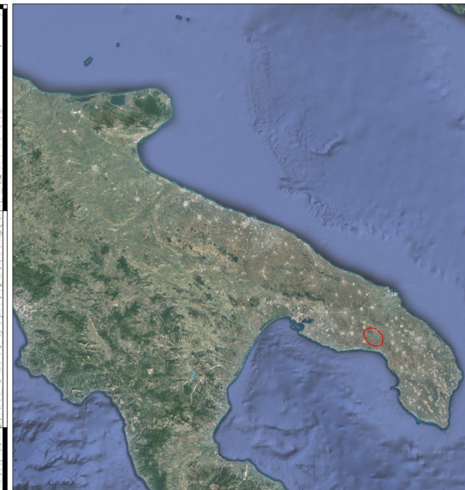
Rappresentazione in coordinate cartografiche Sistema di Riferimento UTM, Datum WGS84, Fuso 33N