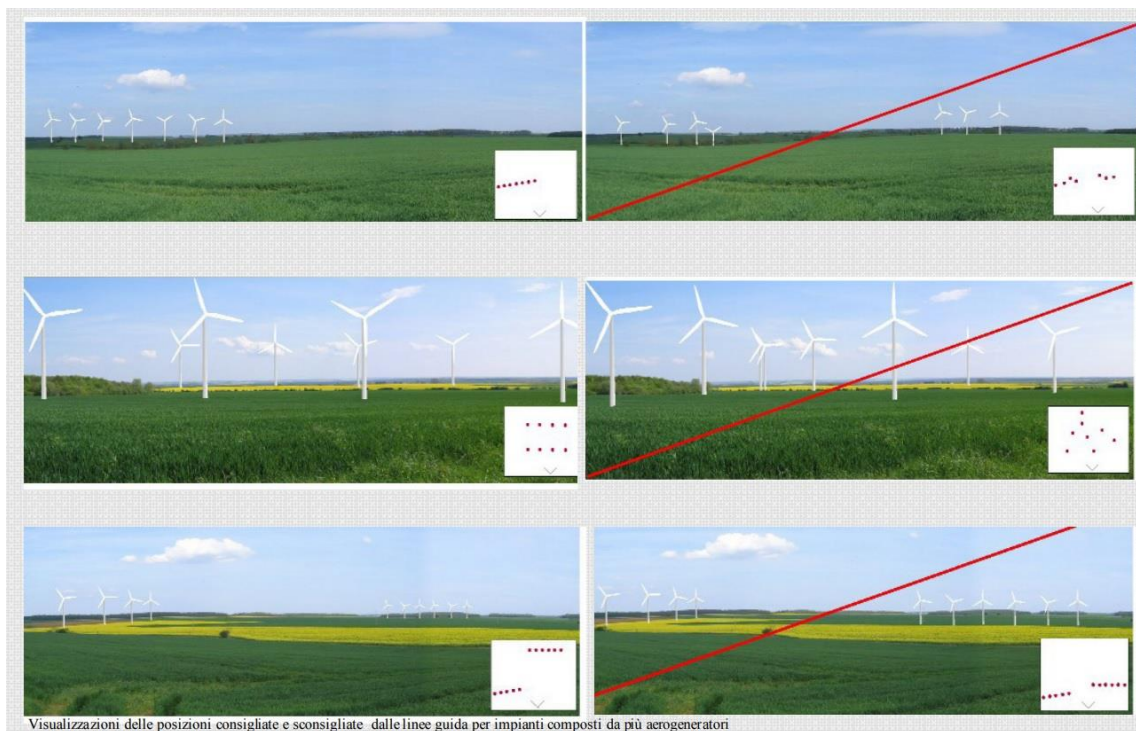
Visualizzazioni delle posizioni consigliate e sconsigliate dalle linee guida per impianti composti da più aerogeneratori

2. Come previsto dal D.M. 10 settembre 2010, nel progetto non vi è una “descrizione, rispetto ai punti di vista di cui alle lettere a) e b) (ricognizione dei centri abitati e dei beni culturali e paesaggistici riconosciuti come tali ai sensi del D.Lgs. n. 42/2004, distanti in linea d'aria non meno di 50 volte l'altezza massima del più vicino aerogeneratore - in questo progetto tale distanza equivale a 11.500 m., documentando fotograficamente l'interferenza con le nuove strutture), dell'interferenza visiva dell'impianto consistente in: