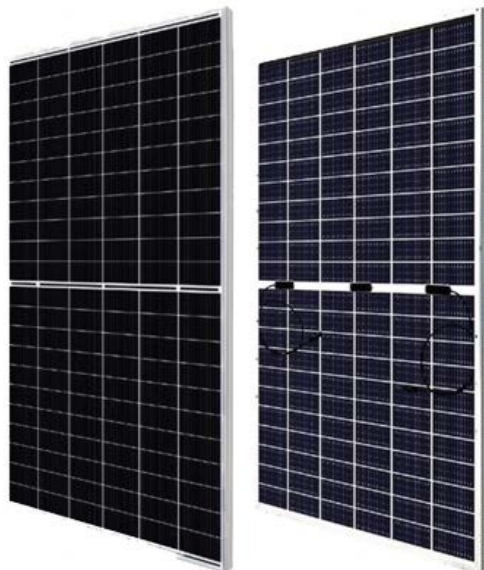
Fig. 1 Pannello Candian Solar