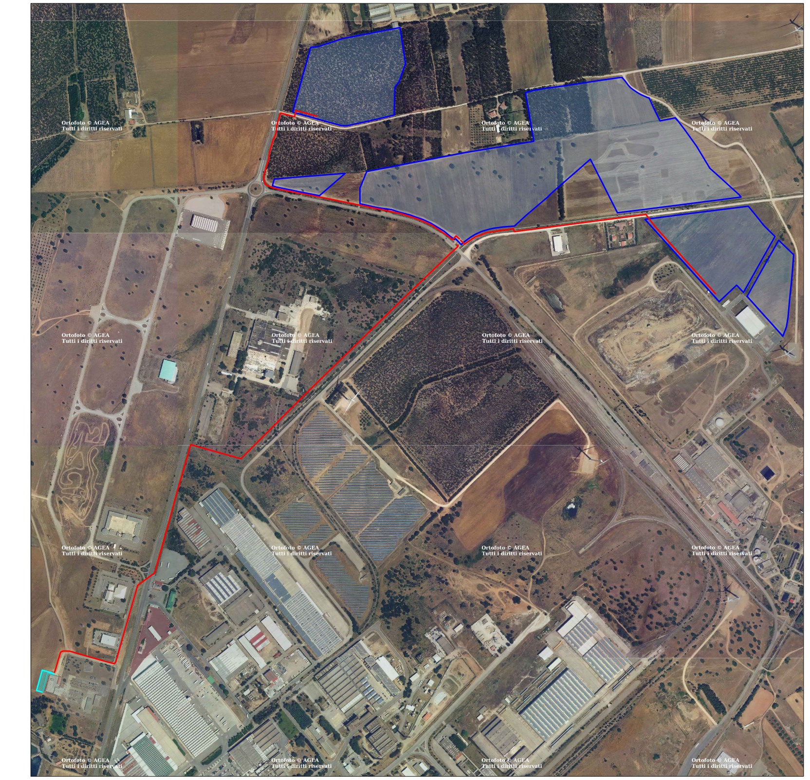
Stralcio P.U.C. Villacidro