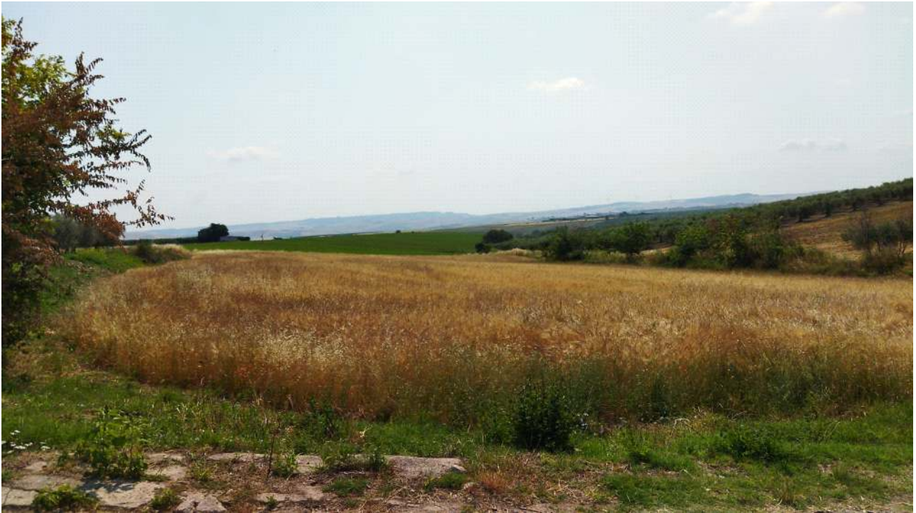
Figura 4 - Stato attuale del sito