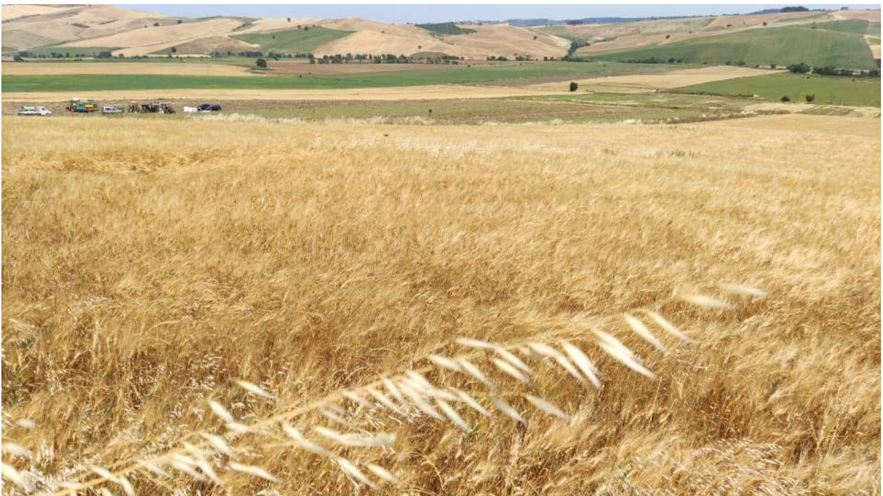
Figura 1 - Stato attuale del sito

Attualmente il sito d'installazione dell'impianto risulta essere non utilizzato e tenuto a verde. Esso, come si evince dalle immagini di seguito riportate, è libero o dedicato all'agricoltura