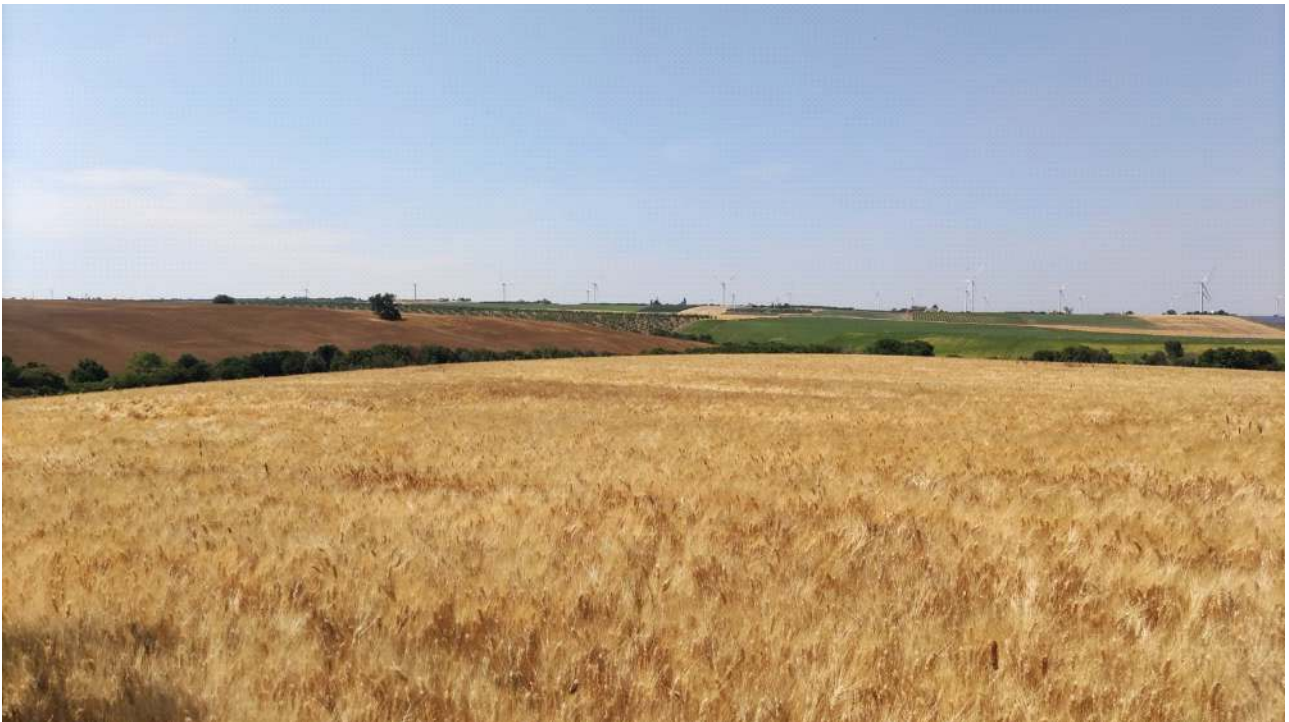
Figura 5 - Stato attuale del sito