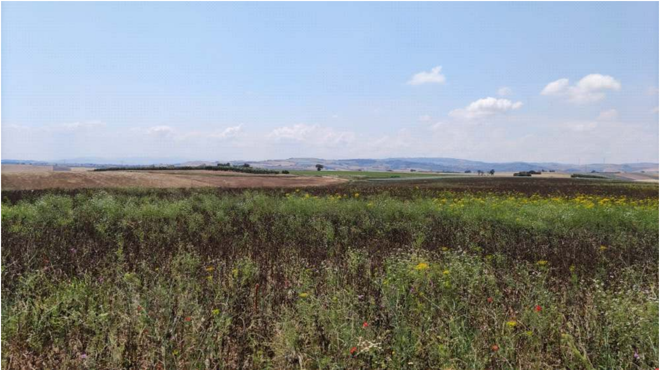
Figura 2 - Stato attuale del sito