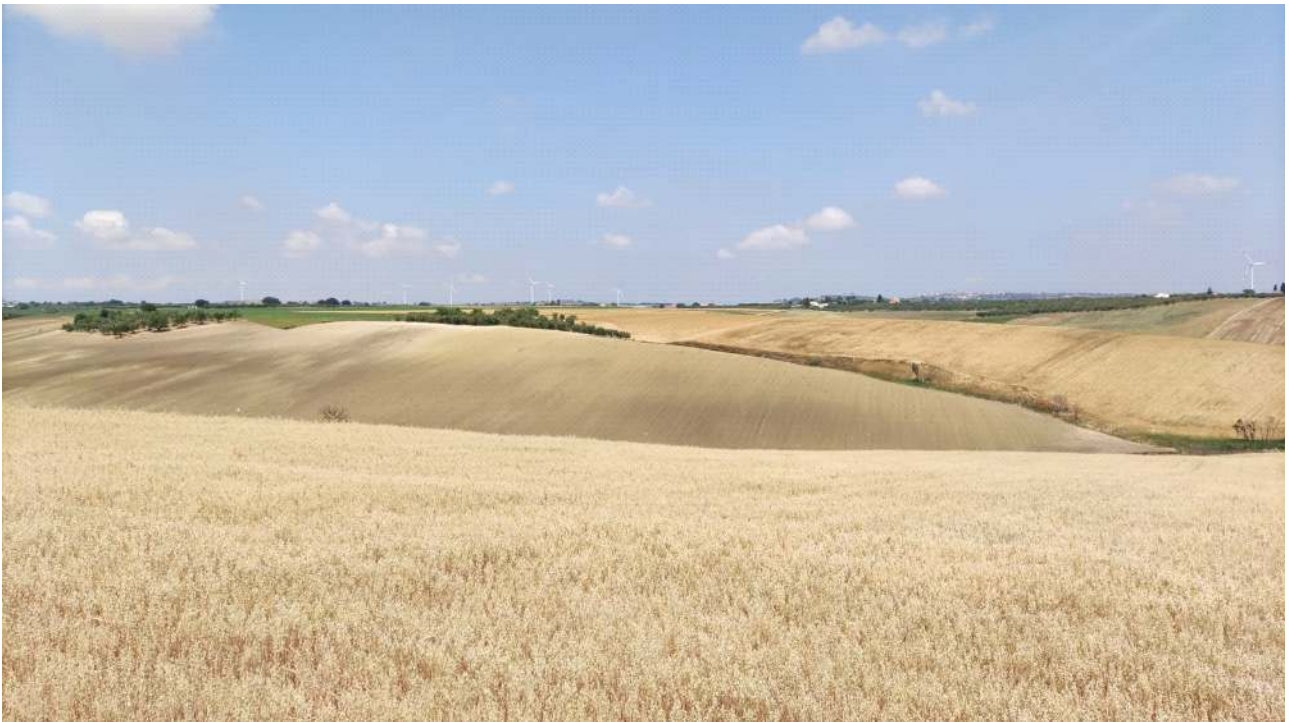
Figura 3 - Stato attuale del sito