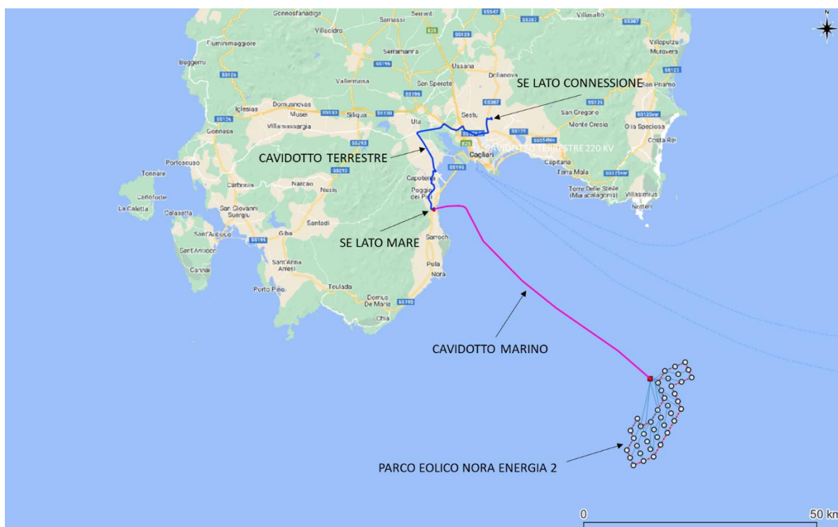
Figura 1.1: Inquadramento Generale del Progetto

La scelta di tale sito è stata effettuata tenendo conto della risorsa eolica potenzialmente disponibile, della distanza dalla costa, della profondità, della conformazione del fondale, dei possibili nodi di connessione alla Rete di Trasmissione Nazionale (RTN) gestita da Terna S.p.A. e, non da ultimo, minimizzando/evitando il più possibile le aree di potenziale maggior interferenza a livello ambientale. In questa zona il fondale ha una profondità che varia dai 170 m e 530 m circa.