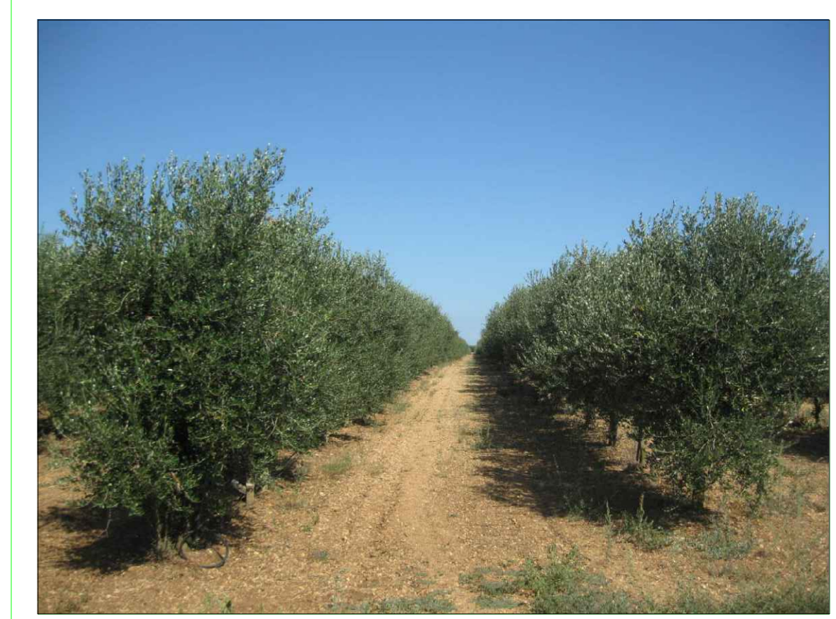
OLIVO - LECCINO