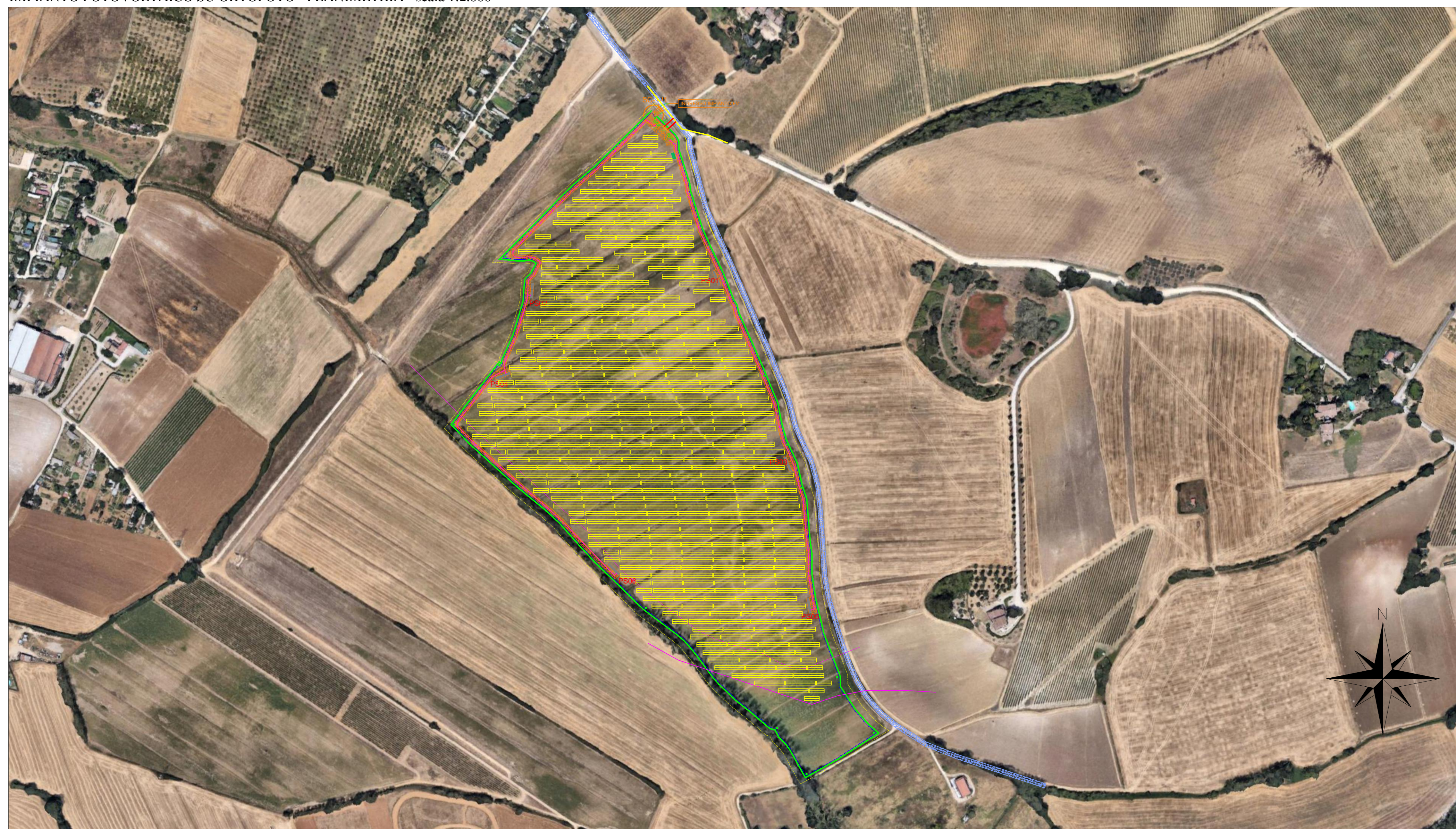
IMPIANTO FOTOVOLTAICO SU ORTOFOTO - PLANIMETRIA - scala 1:2.000