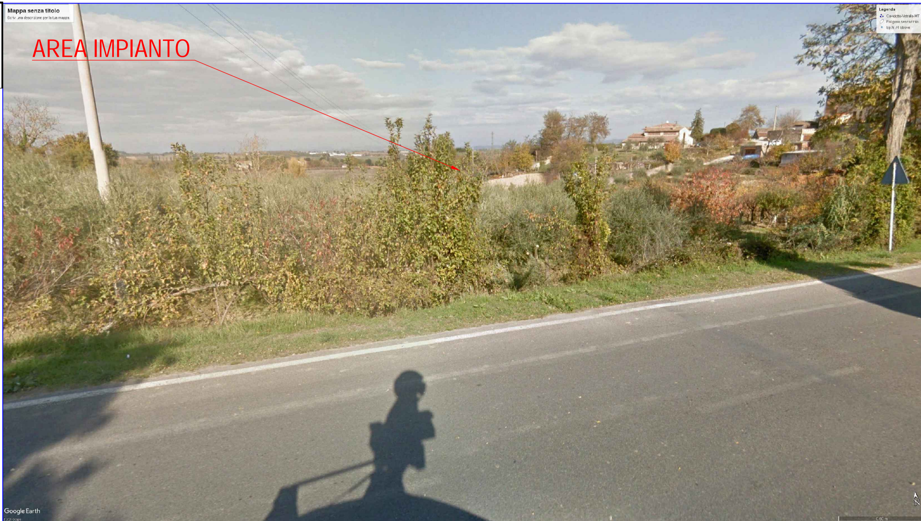
N.B. in Rosso sono evidenziate le aree visibili dal punto VP considerato. L'impianto Fotovoltaico non risulta visibile dal punto VP05