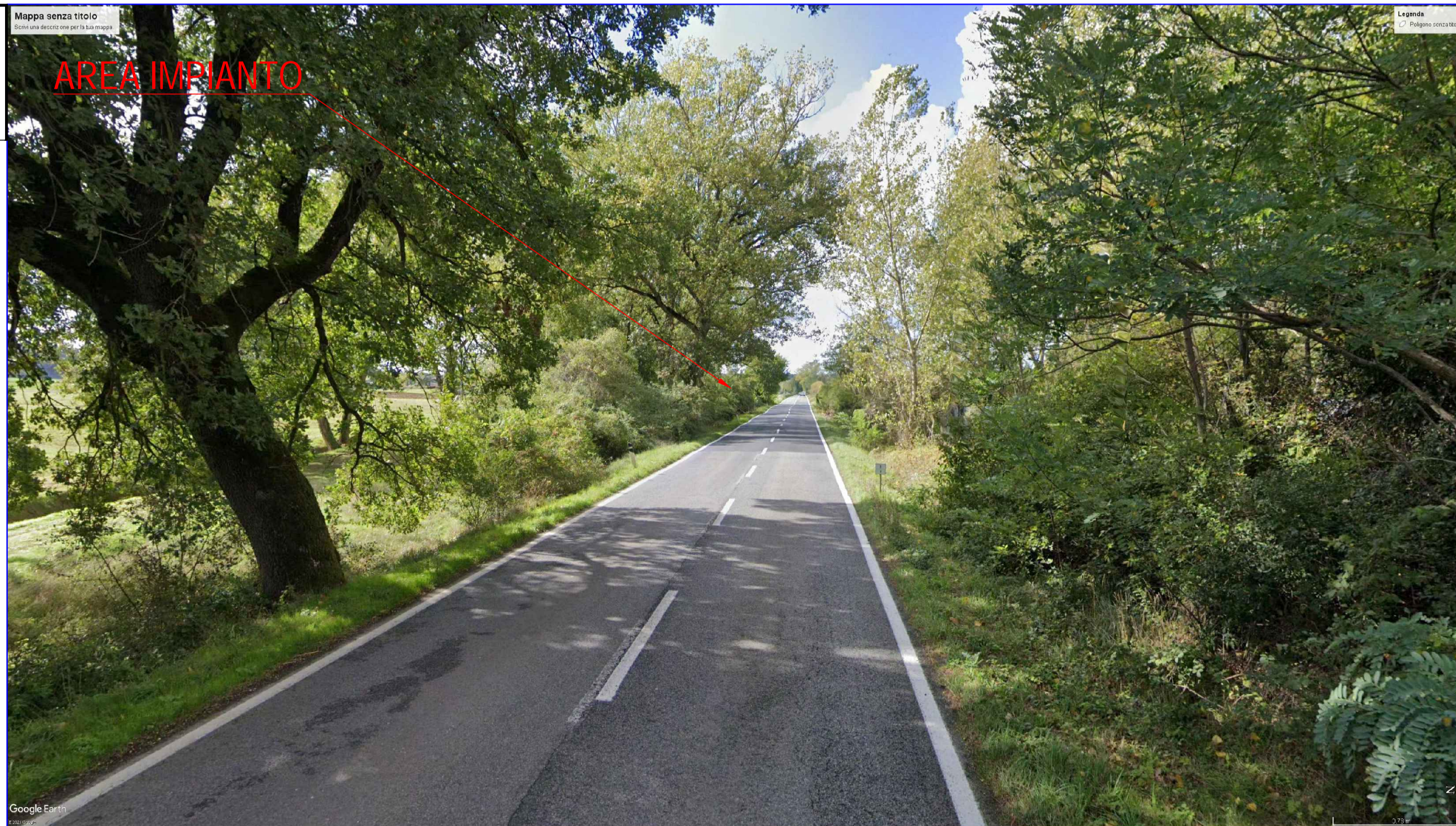
N.B. in Rosso sono evidenziate le aree visibili dal punto VP considerato. L'impianto Fotovoltaico non risulta visibile dal punto VP11