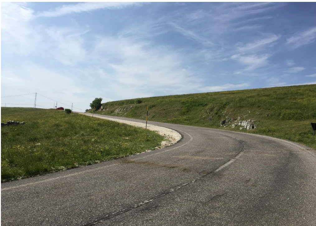
Foto 2: Strada Provinciale 6 – direzione Villaggio Malga San Giorgio