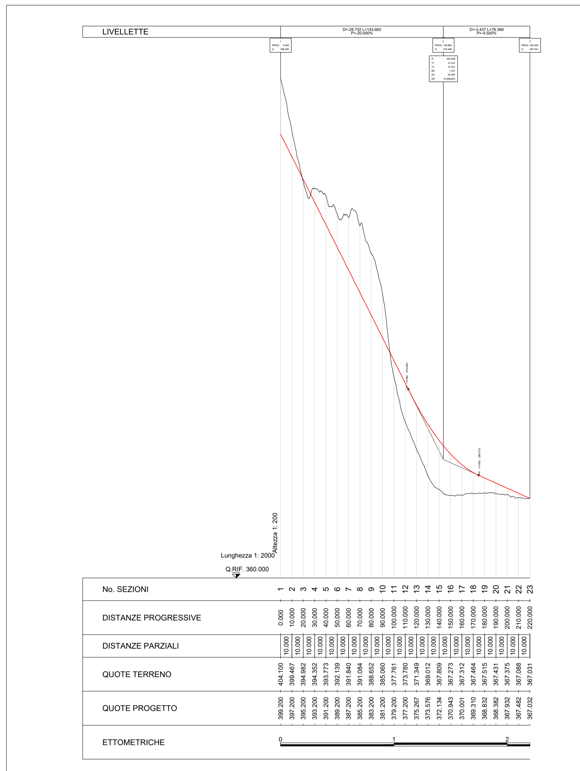
PROFILO DI PROGETTO NV02 SCALA 1:2000 / 1:200