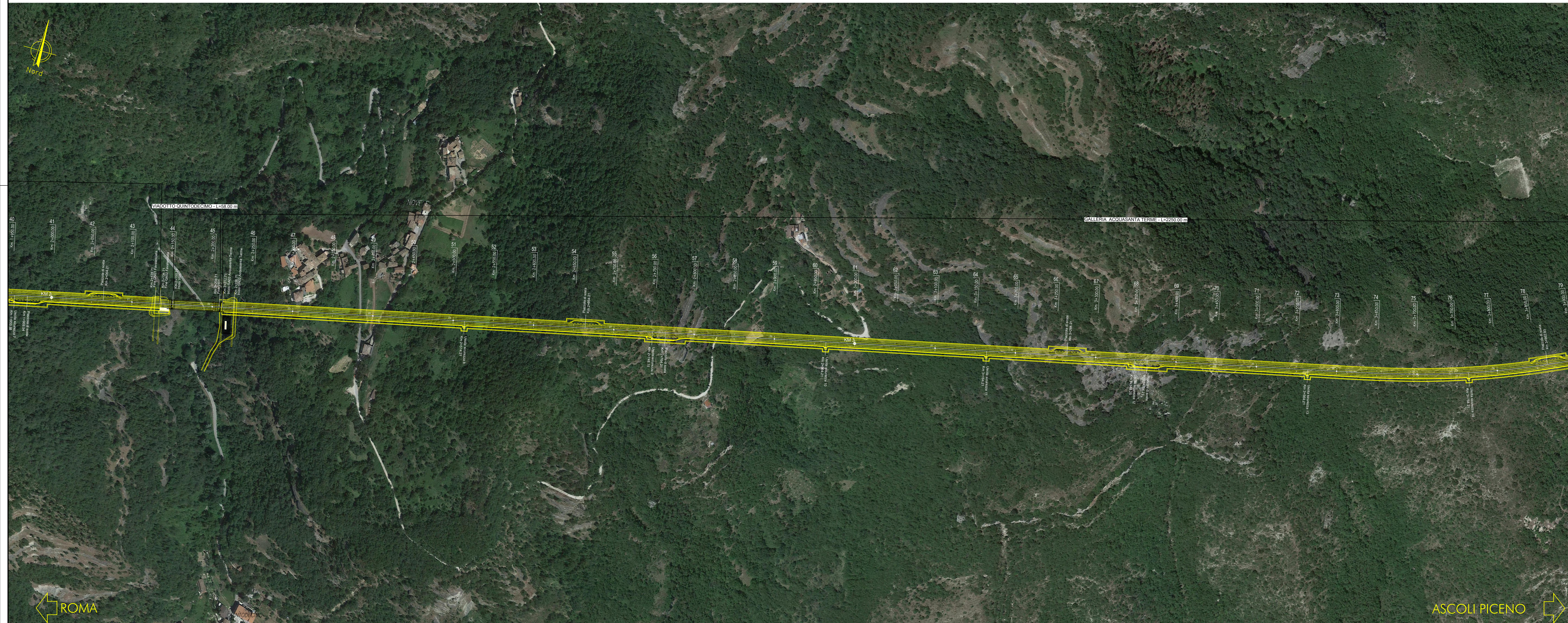
PLANIMETRIA SCALA 1:2000