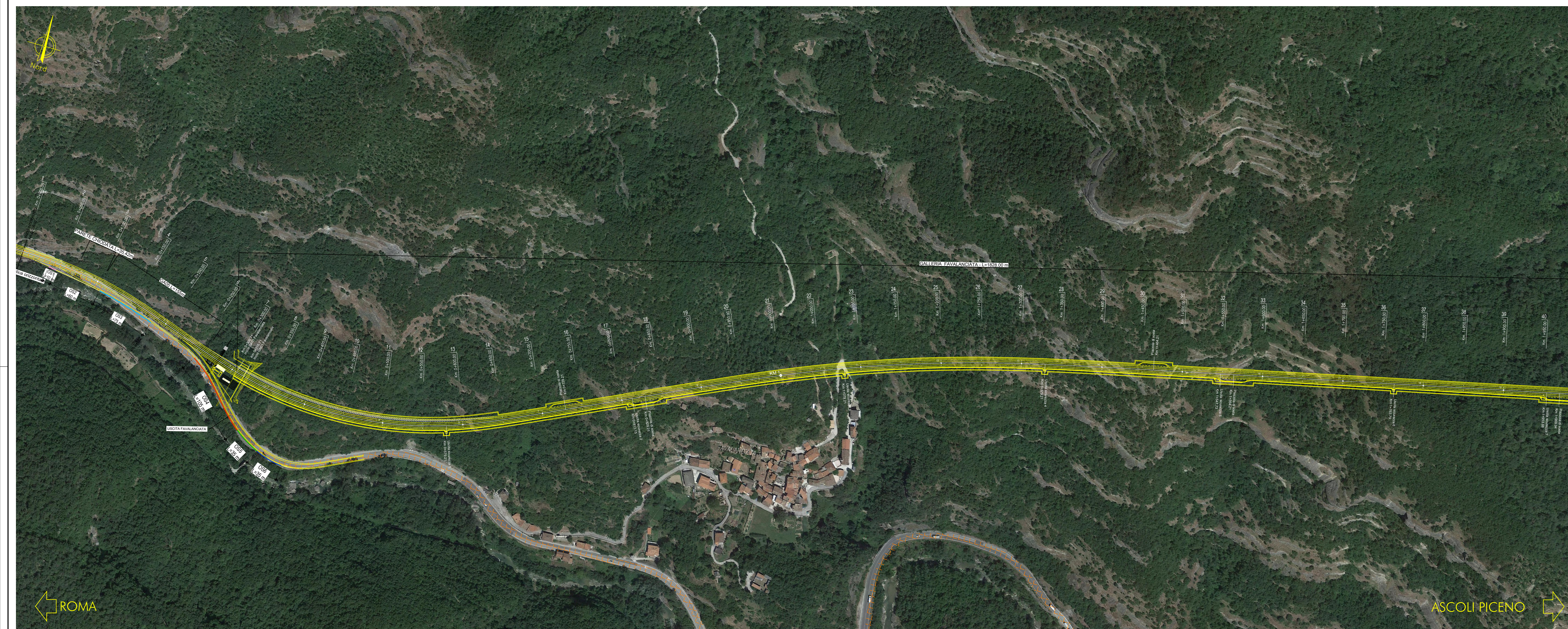
PLANIMETRIA SCALA 1:2000