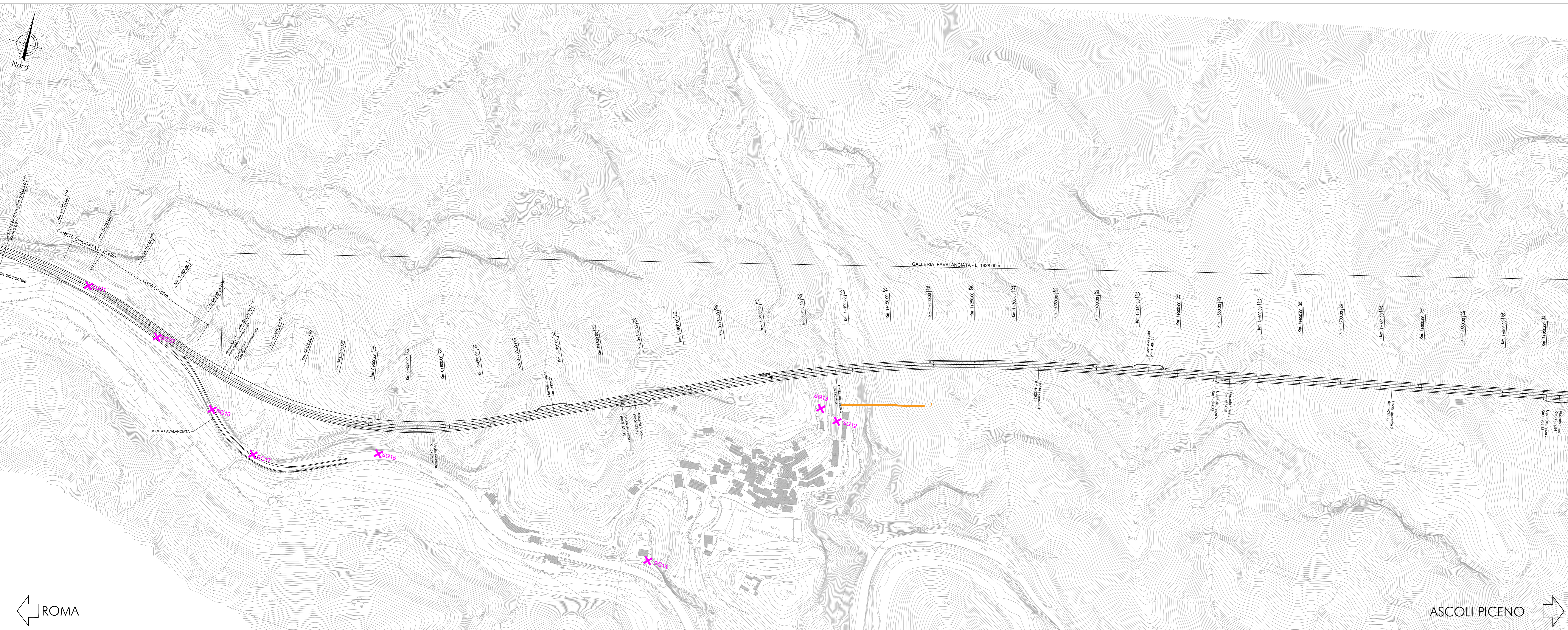
PLANIMETRIA SCALA 1:2000