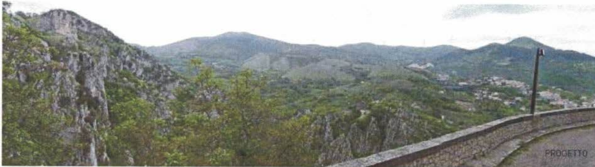
Vista verso l'area di impianto dalla strada che circonda a nord il centro storico di Muro Lucano, a circa 2,7 km dai distanza minima dagli aerogeneratori in progetto.