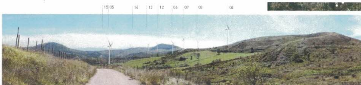
Vista dell'area di impianto, dal Toppo di Castelgrande e dall'Osservatorio Astronomico conduce a San Fele, a circa 850 m di distanza dagli aerogeneratori in progetto.