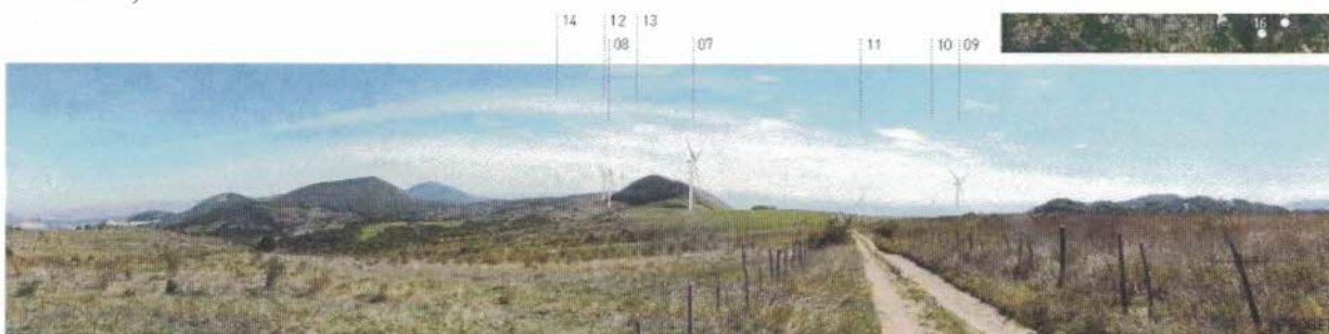
Dalla strada comunale "Pisterola" che dal Toppo di Castelgrande si dirige verso Muro Lucano, traguardando verso Costa del Gaudio, a circa 600 m dagli aerogeneratori in progetto.