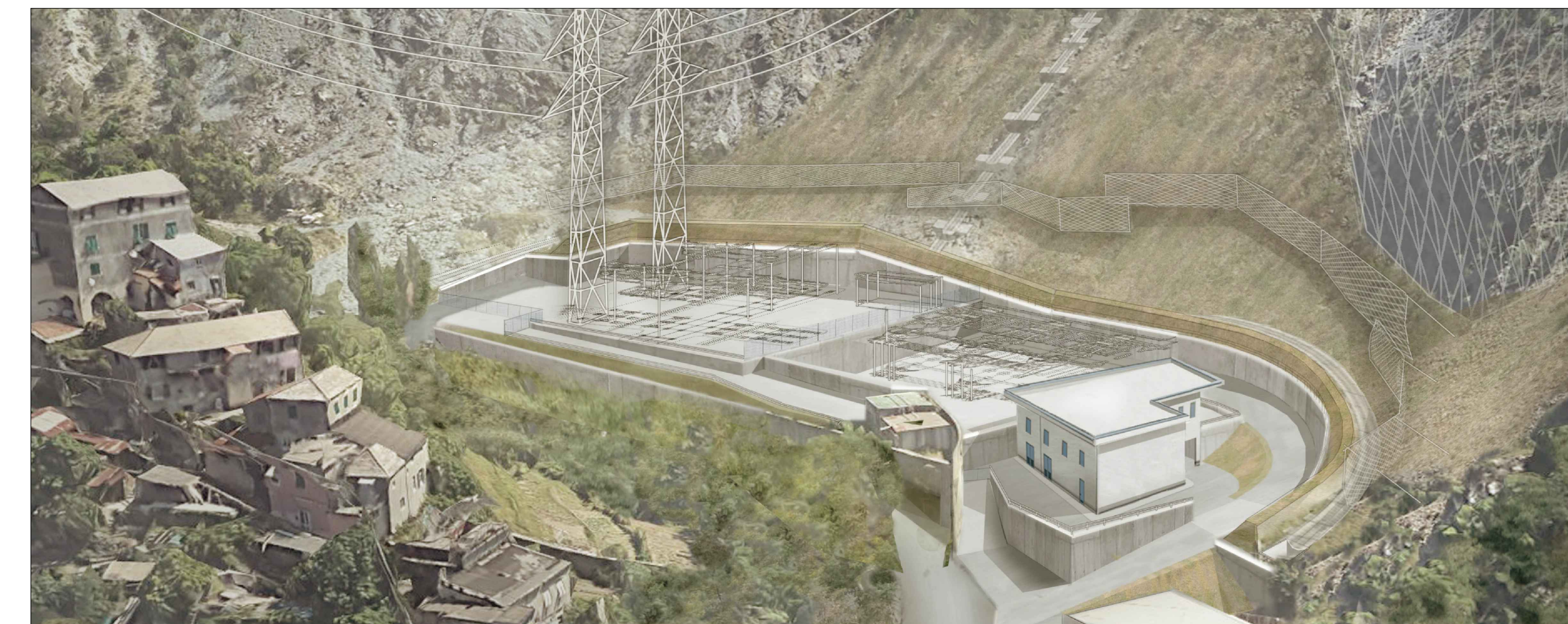
FOTOINSERIMENTO INTERVENTI DI MITIGAZIONE SU VISTA OVEST