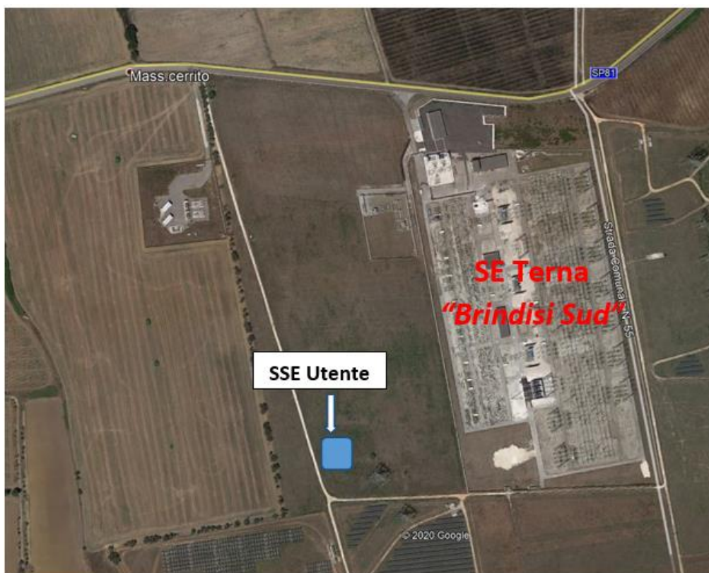
Inquadramento area ubicazione SSE Utente e SE Terna "Brindisi Sud"