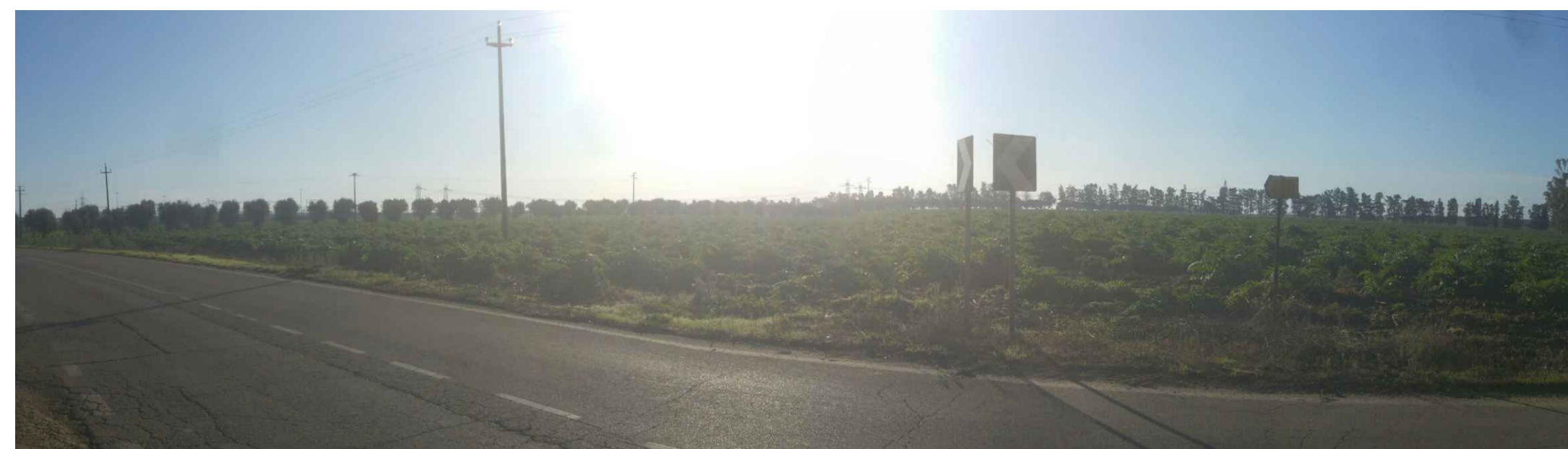
B - Stazione elettrica