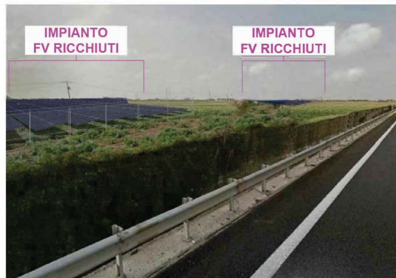
VISTA DA SS 613 Vista operam SENZA mascheramento ambientale