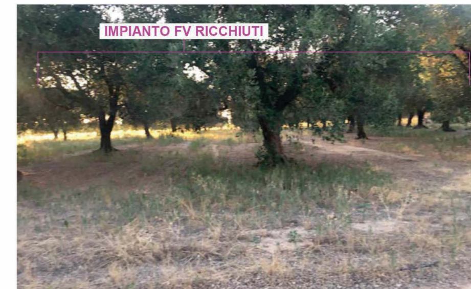
VISTA DA MASSERIA PIGNA Vista post operam VISIBILITA' NULLA