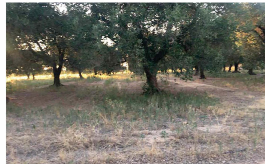
VISTA DA MASSERIA PIGNA Vista ante operam