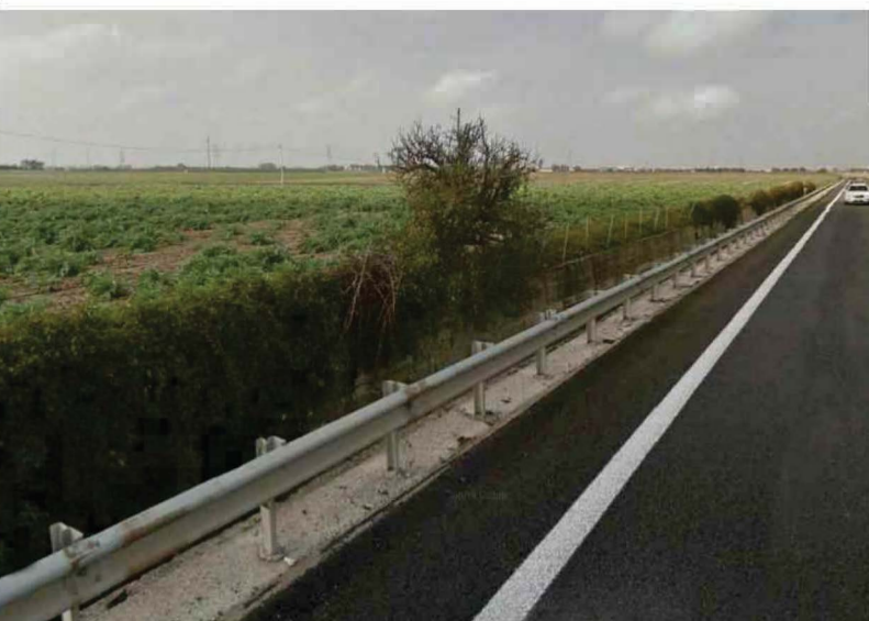
VISTA DA STRADA STATALE 613 Vista ante operam