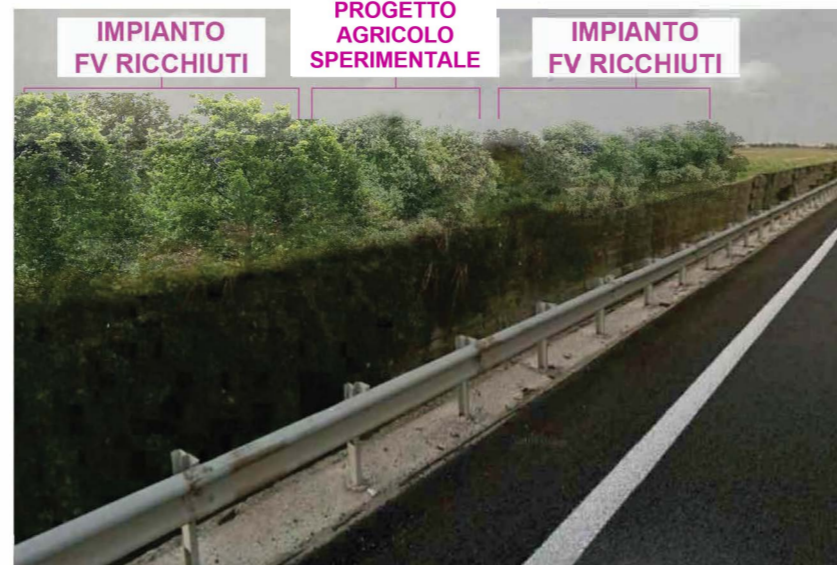
VISTA DA SS 613 Vista operam CON mascheramento ambientale