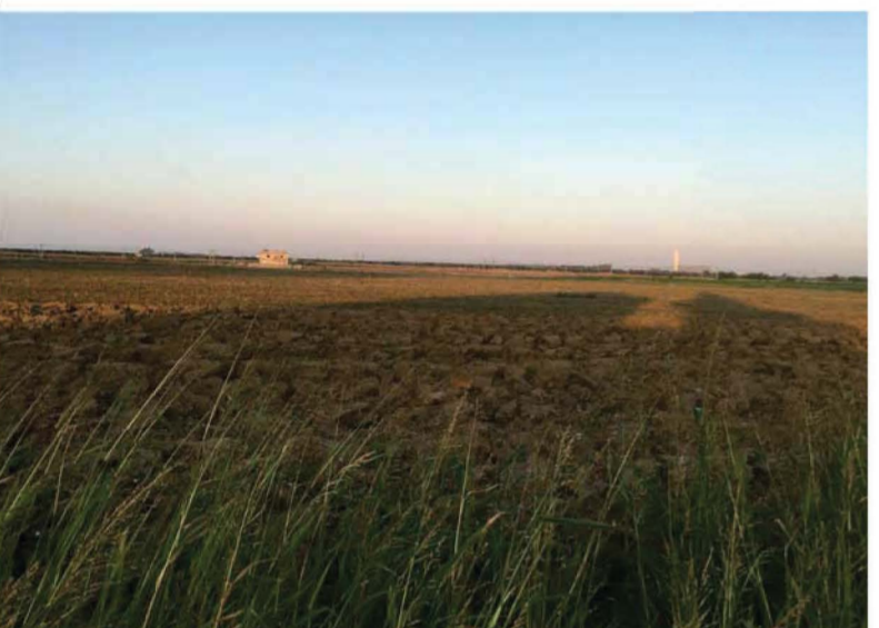
VISTA DA MASSERIA CHIODI Vista post operam SENZA mascheramento ambientale