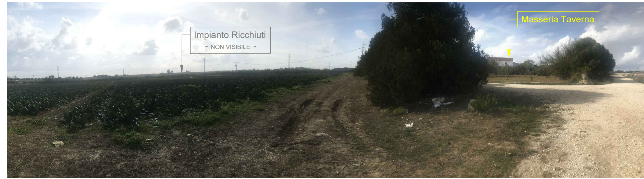
1 - Masseria Taverna - vicinanze Fiume Grande