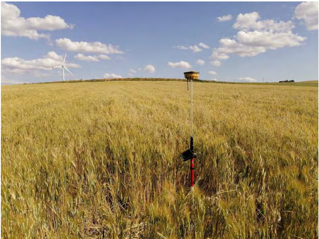
Figura 10: WTG10