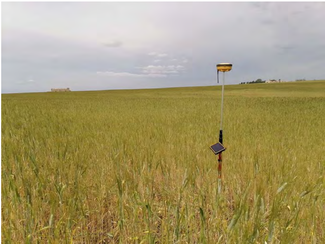
Figura 5: WTG5