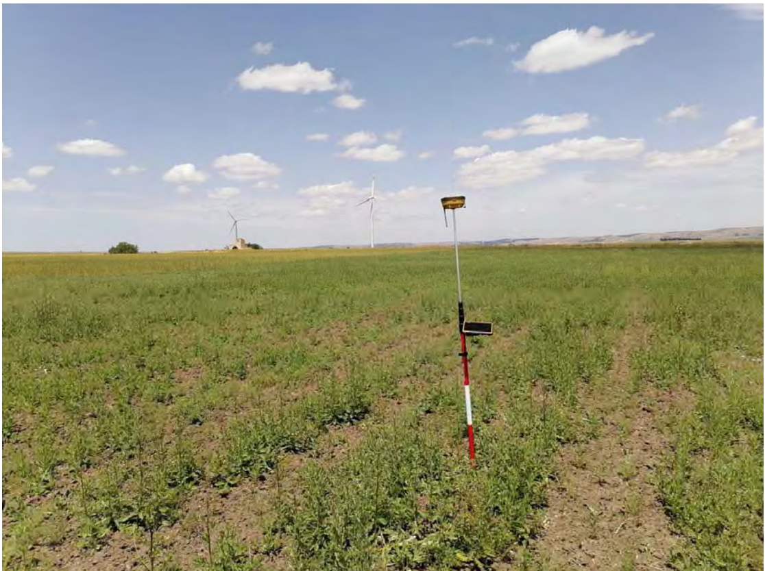
Figura 4: WTG4