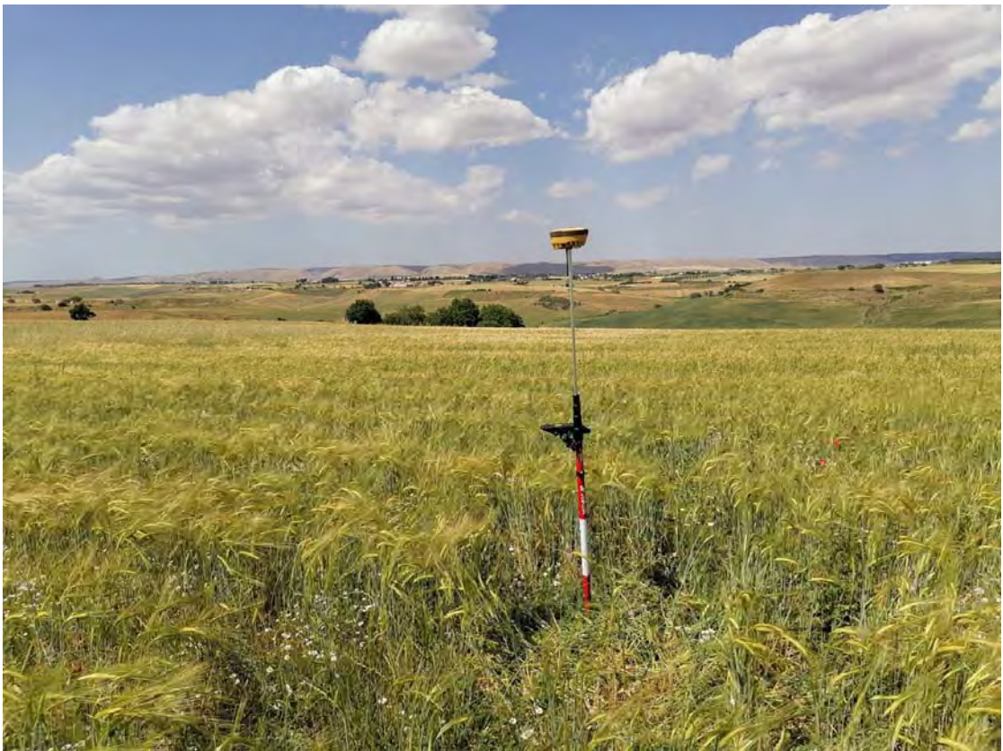
Figura 8: WTG8