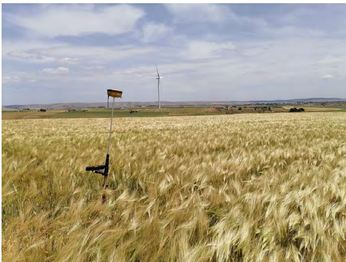
Figura 2: WTG2