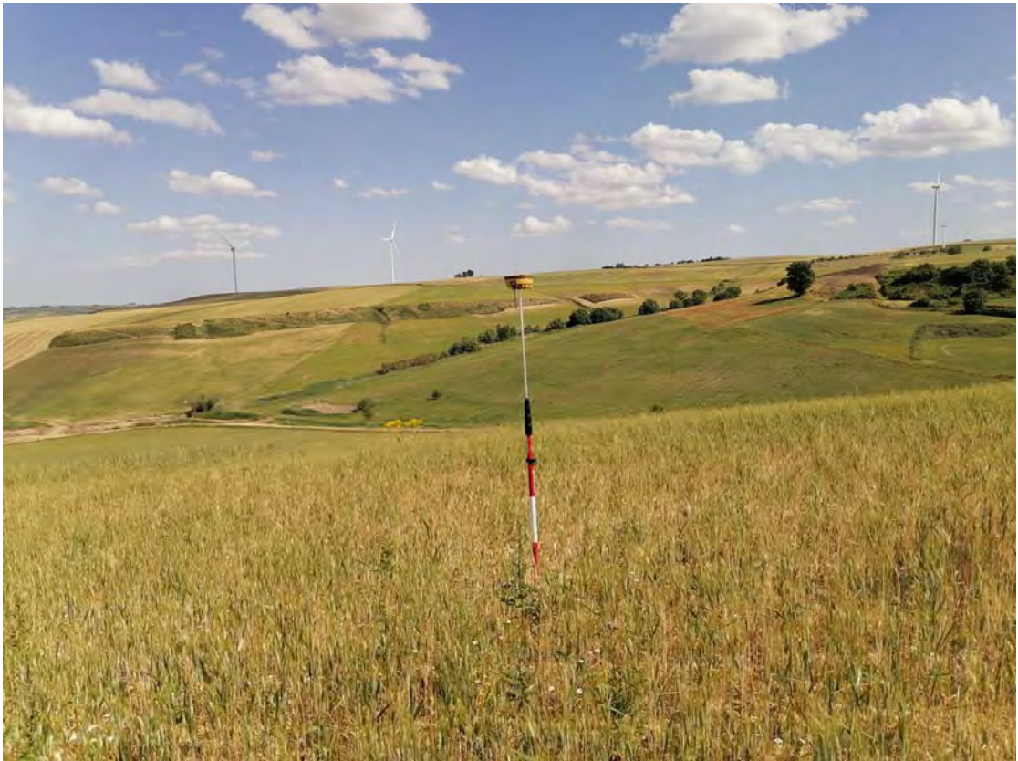
Figura 9: WTG9