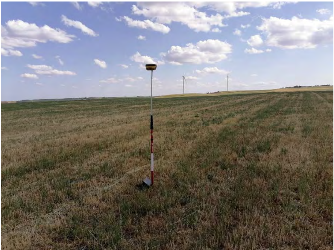
Figura 12: WTG12