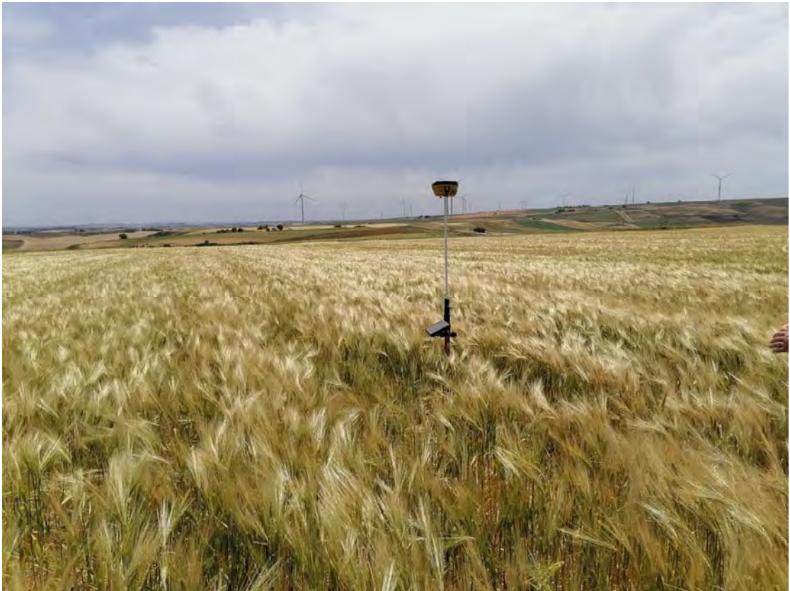
Figura 3: WTG3