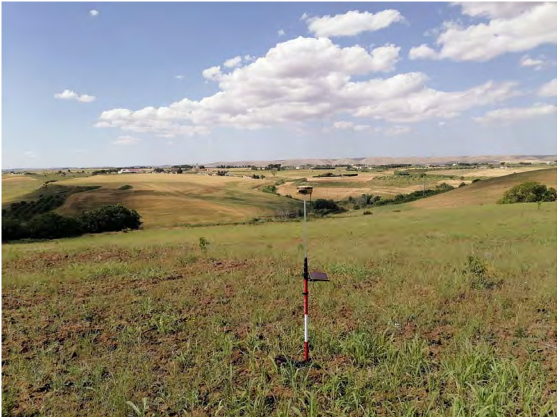
Figura 11: WTG11