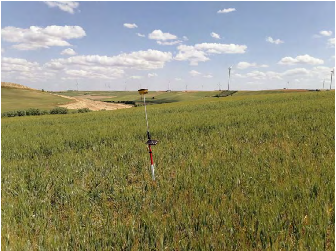
Figura 7: WTG7