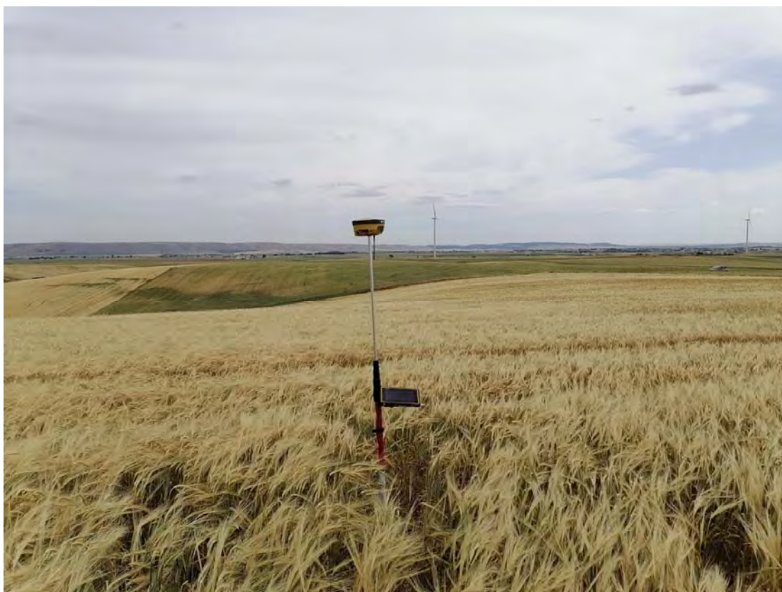
Figura 1: WTG1