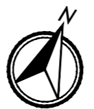
PIANTA (RIQUADRO 4/5) scala 1:100