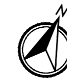
PIANTA (RIQUADRO 5/5) scala 1:100