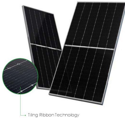
Tiling Ribbon Technology

IEC61215(2016), IEC61730(2016) ISO9001:2015: Quality Management System ISO14001:2015: Environment Management System ISO45001:2018 Occupational health and safety management systems Made in China/Malaysia/U.S./Vietnam