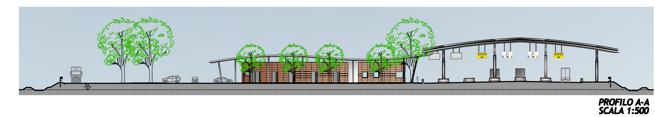
AUTOSTAZIONE DI CENTO SCALA 1:500

CARATTERISTICHE DEI MATERIALI NOTE - Quote altimetriche espresse in metri s.l.m. - Quote lineari espresse in cm - Come elemento contropesante degli stalli per la sosta degli automezzi si prevede la messa a dimora alternativamente di spicci a "pronto effetto" di forma e spessore a distanza di 5 m.