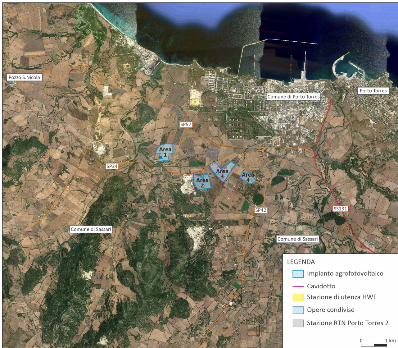
Figura I.1- Area di inserimento dell'impianto in progetto