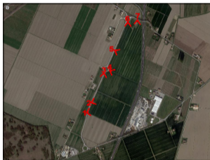
ORTOFOTO DI INQUADRAMENTO