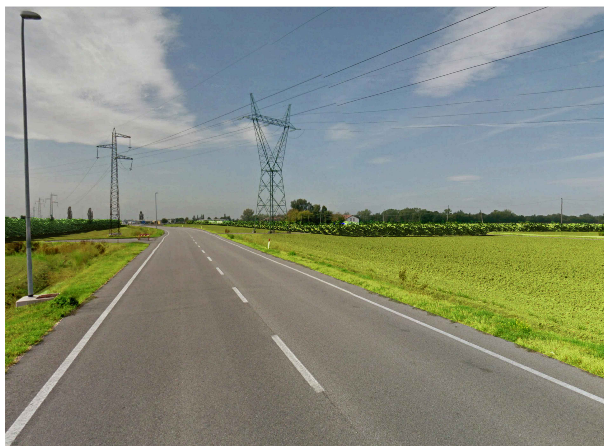
PUNTO DI SCATTO 2_STATO DI PROGETTO