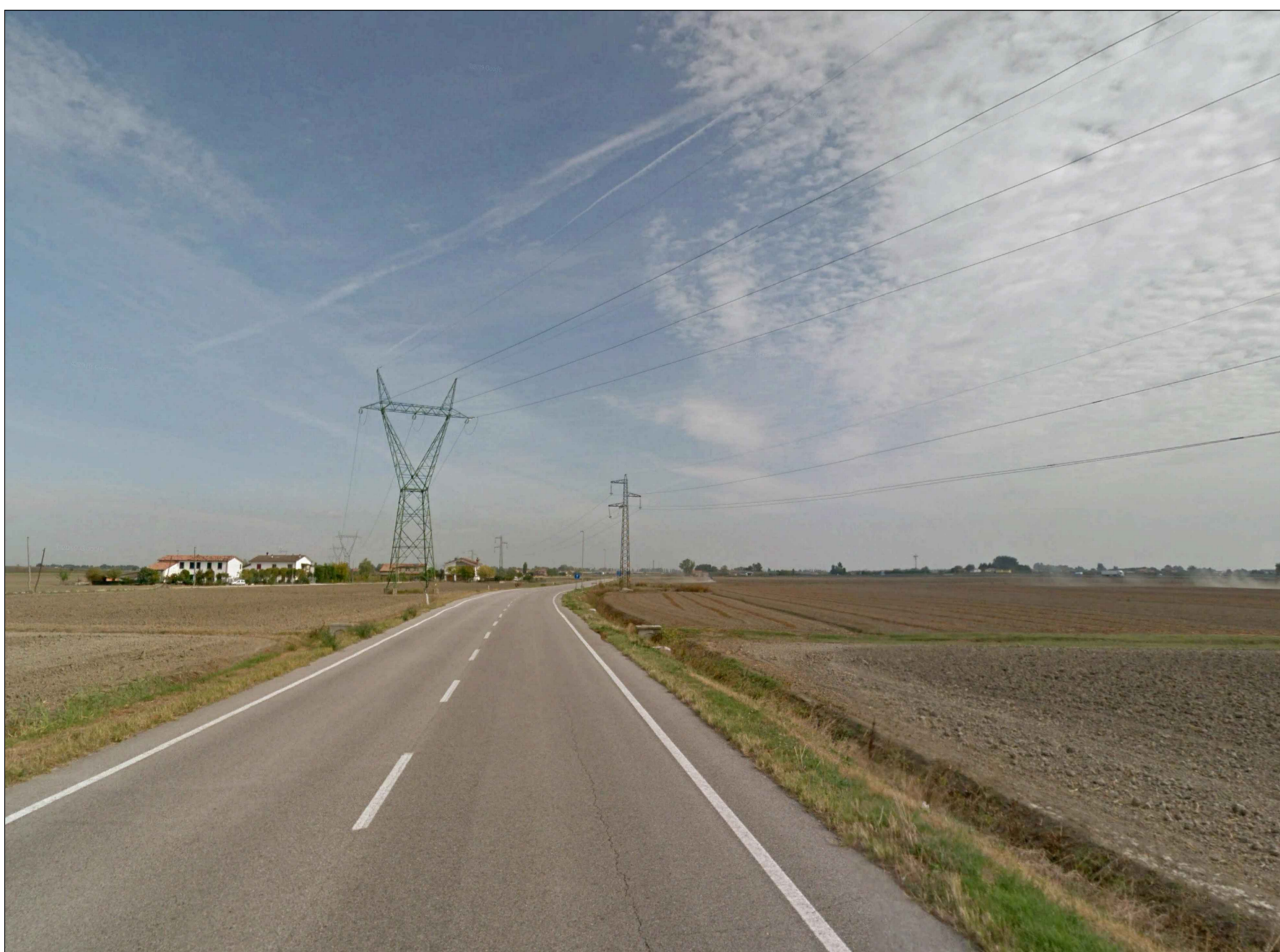
PUNTO DI SCATTO 4_STATO DI FATTO