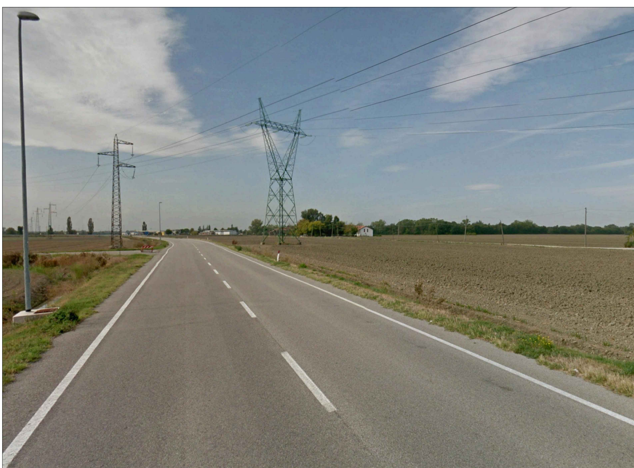
PUNTO DI SCATTO 2_STATO DI FATTO