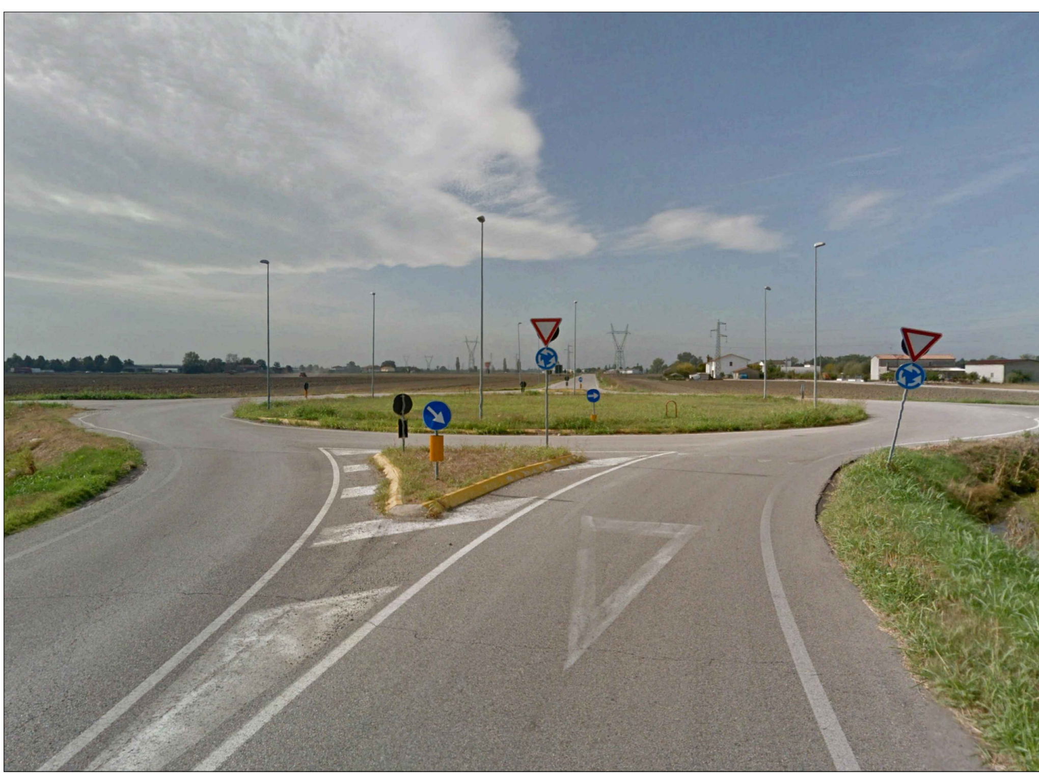
PUNTO DI SCATTO 1_STATO DI FATTO