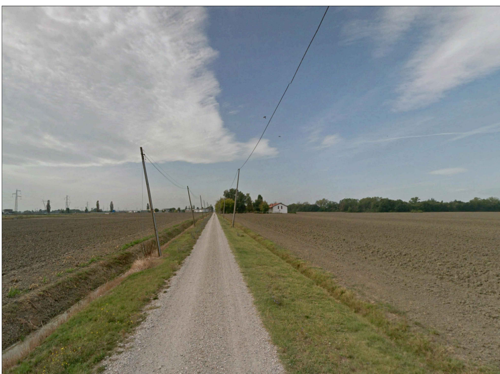
PUNTO DI SCATTO 3_STATO DI FATTO