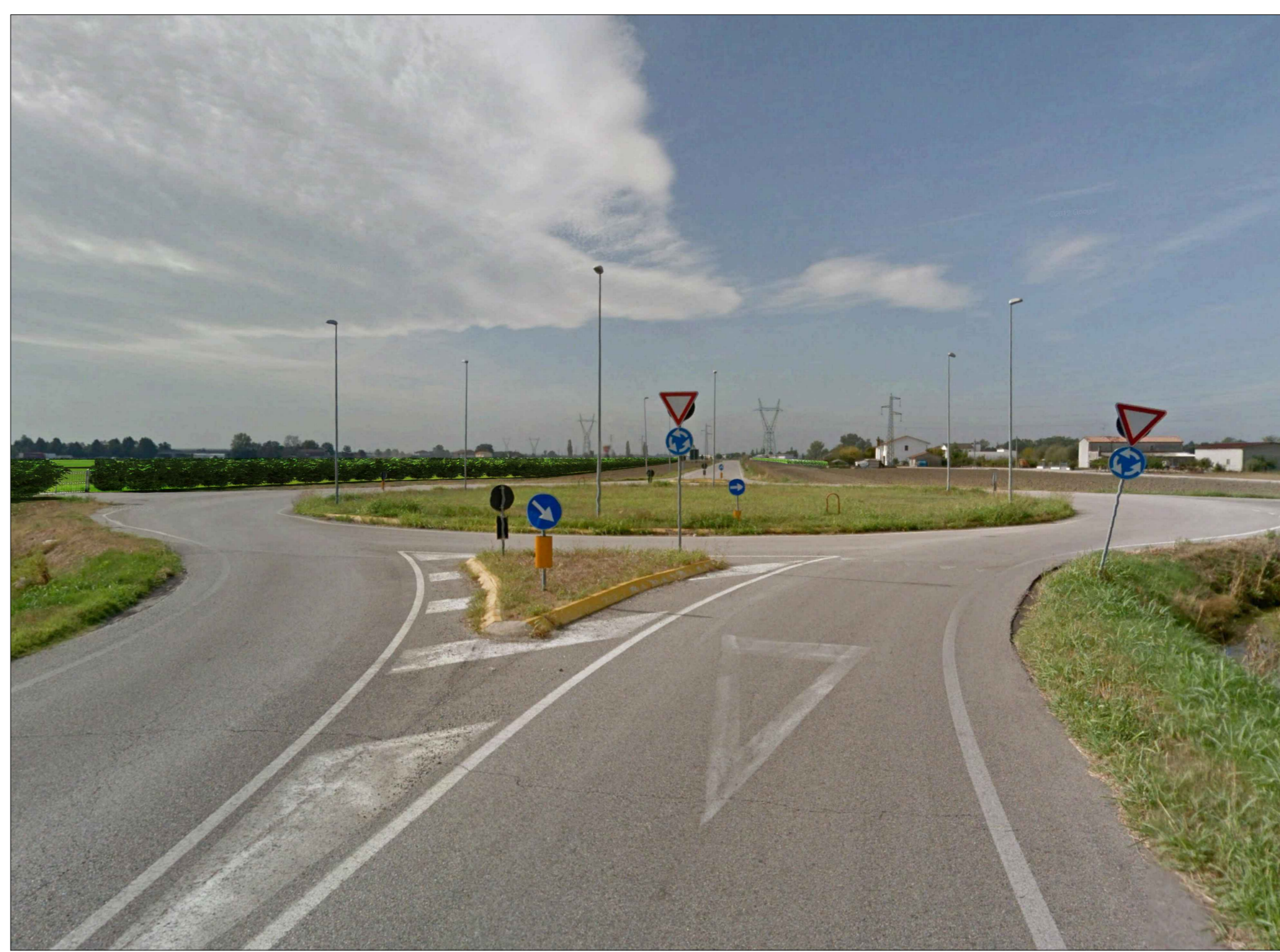
PUNTO DI SCATTO 1_STATO DI PROGETTO