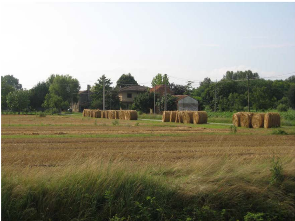
Foto n. 62 - Zona a seminativo adiacente alla variante S.P. 59