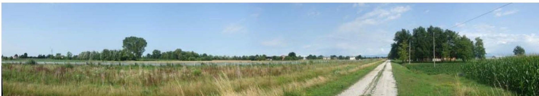
Foto n. 55 - Panoramica zona rotonda di progetto e variante S.P. 59