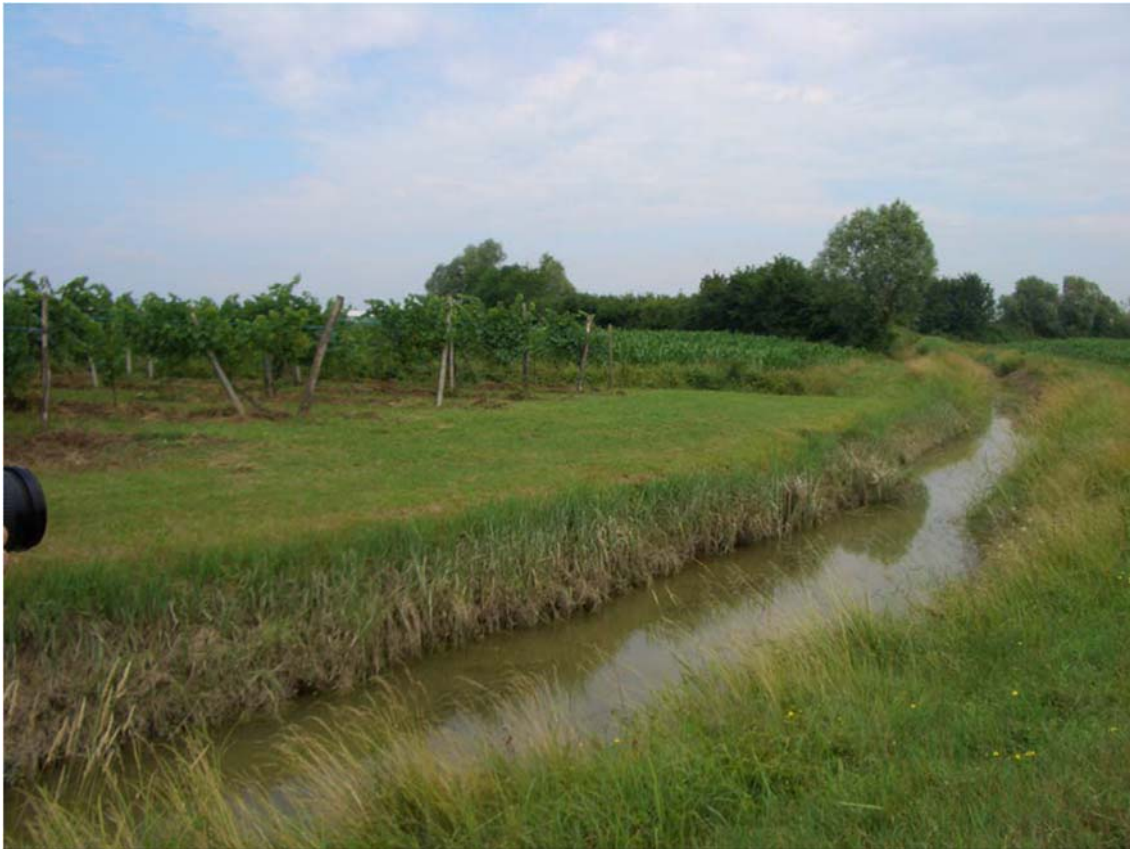
Foto n. 45 - Canale Melonetto presso l'opera di progetto n°2,00 4b