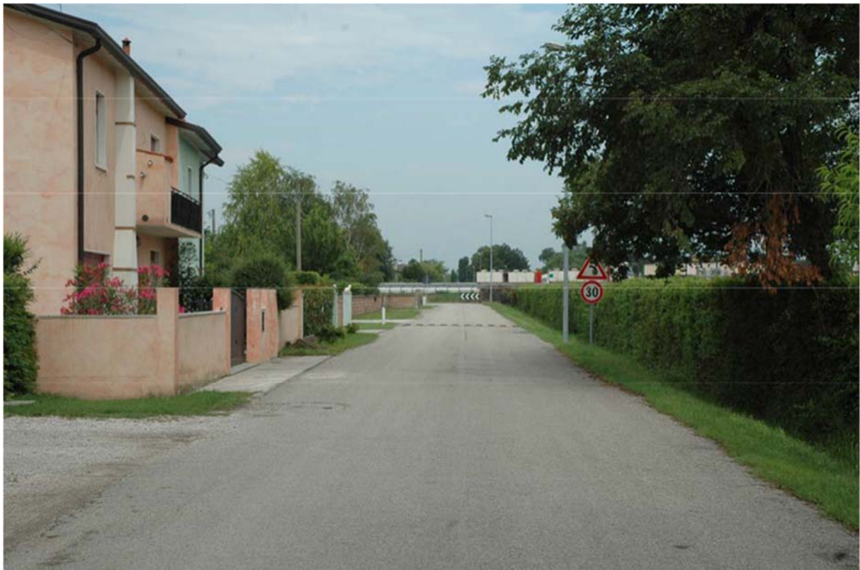
Foto n. 04 - Zona sud nuovo svincolo – lungo Via Fosson, sullo sfondo l'A4