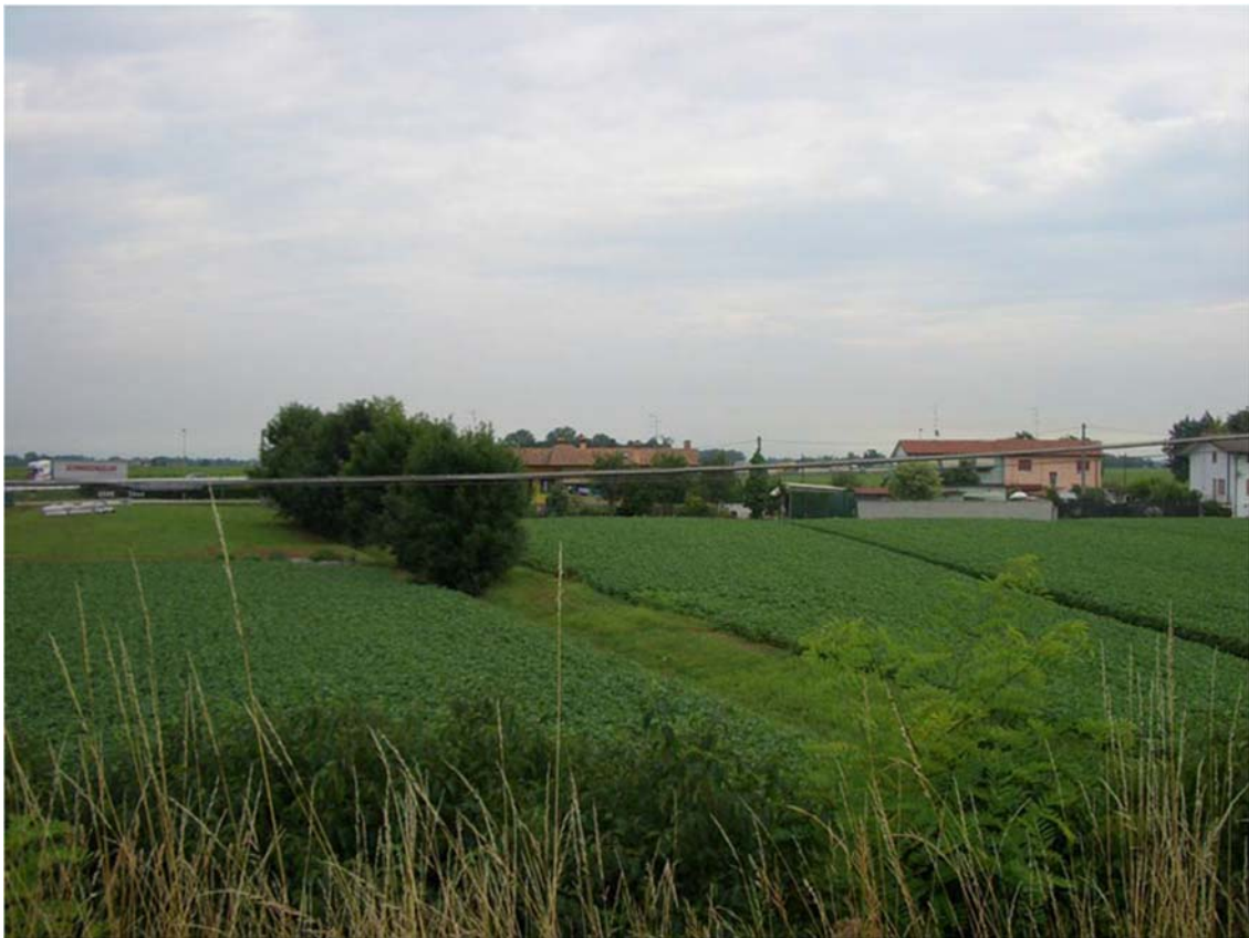
Foto n. 03 - Zona sud nuovo svincolo – seminativi e abitazioni lungo Via Fosson dal cavalcavia di Via Paludi