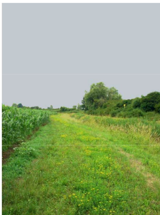
Foto n. 41 - Visuale presso area golenale di progetto