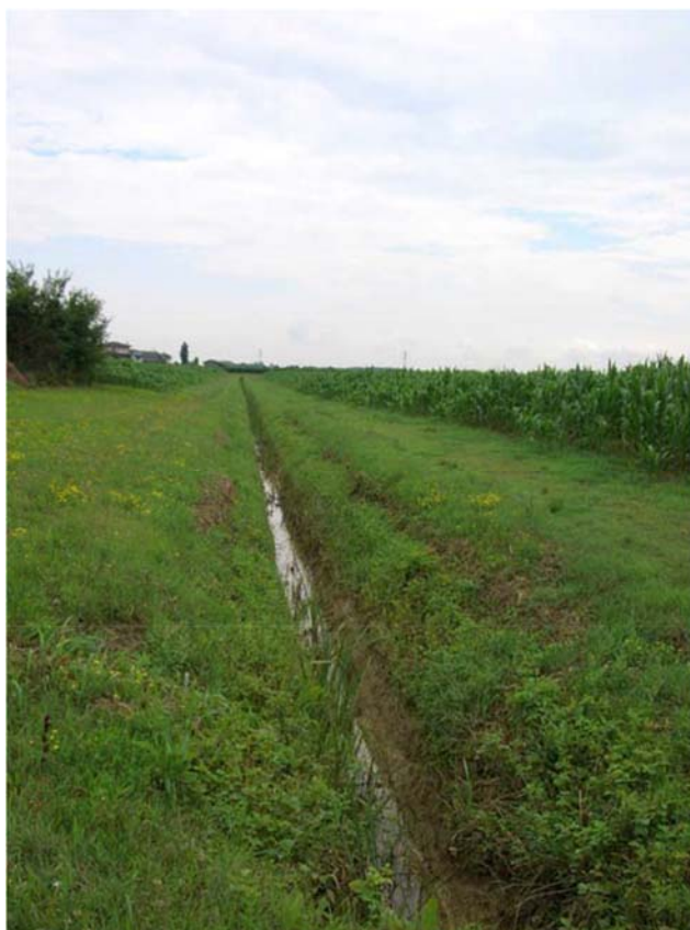
Foto n. 40 - Scolo intercettato presso il nuovo casello