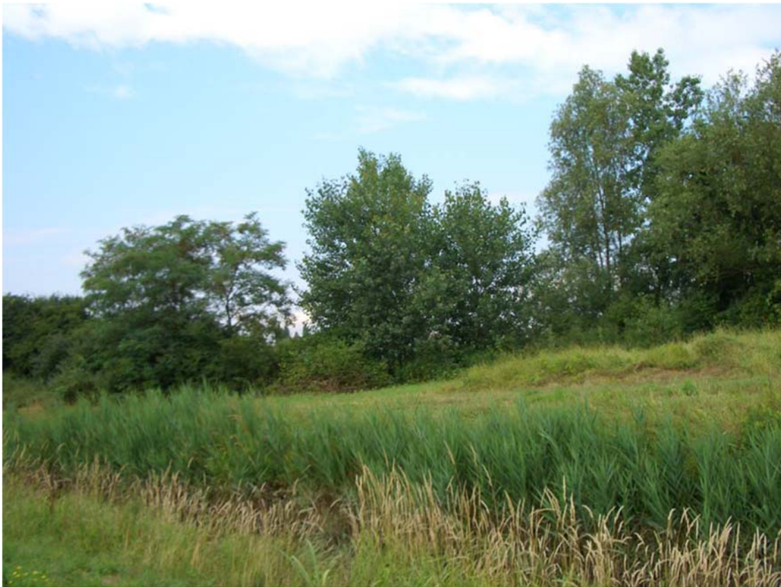
Foto n. 42 - Vegetazione esistente in destra Melonetto