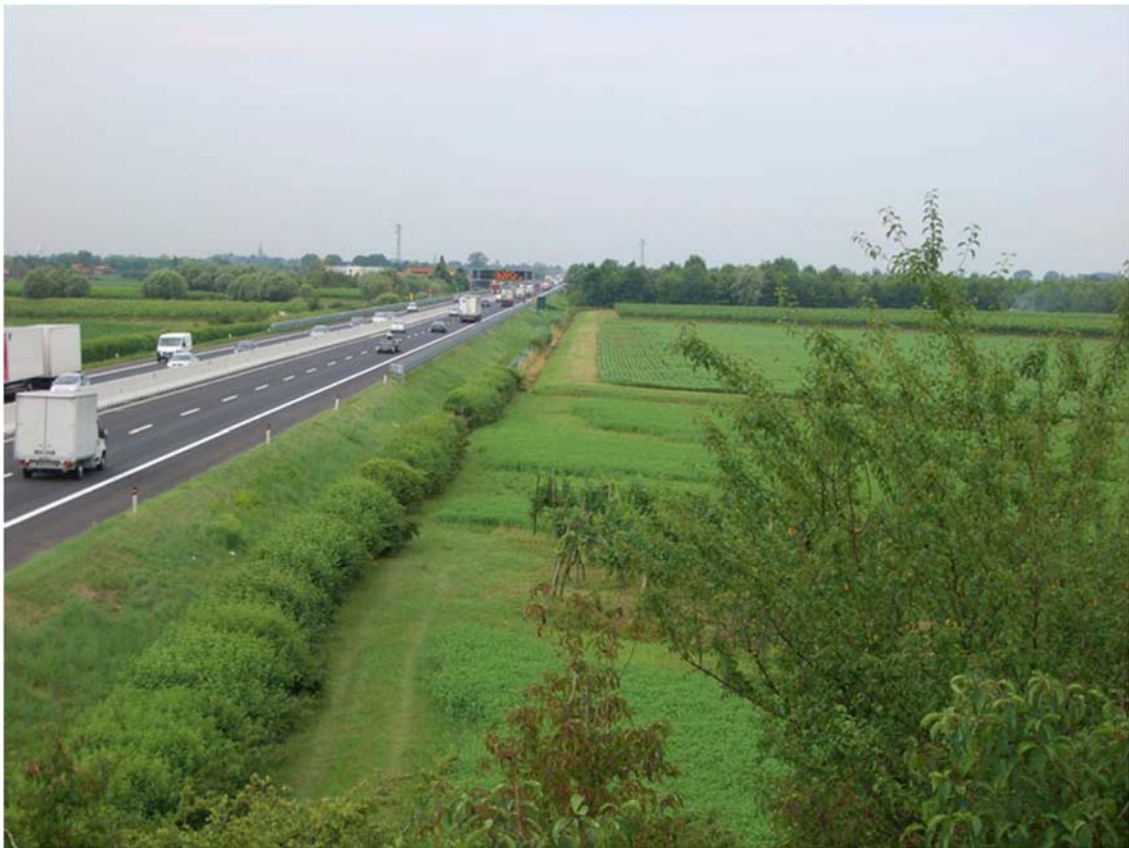
Foto n. 09 - Visuale A4 da cavalcavia Via Paludi e bosco di Bandiziol sullo sfondo