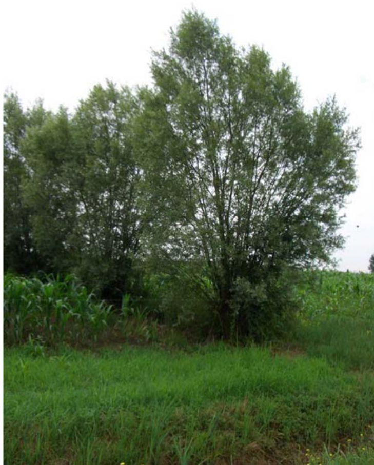
Foto n. 26 - Siepe di salice bianco ( Salix alba ) intercettata dal cavalcavia di progetto