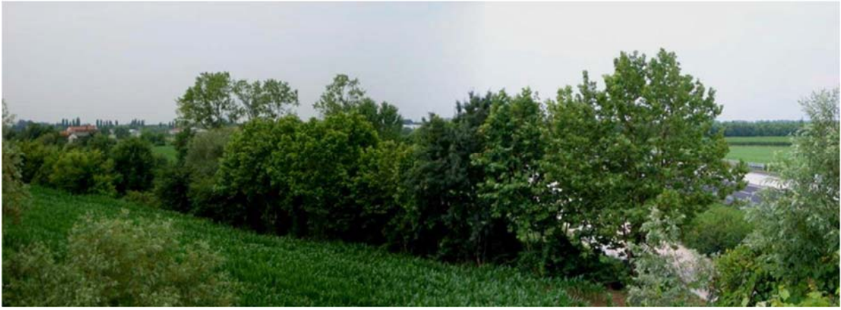
Foto n. 13 - Zona sud nuovo svincolo – panorama e siepi dal cavalcavia su Via Paludi