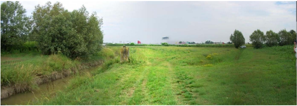
Foto n. 25 - Visuale presso rampa di uscita Asse E