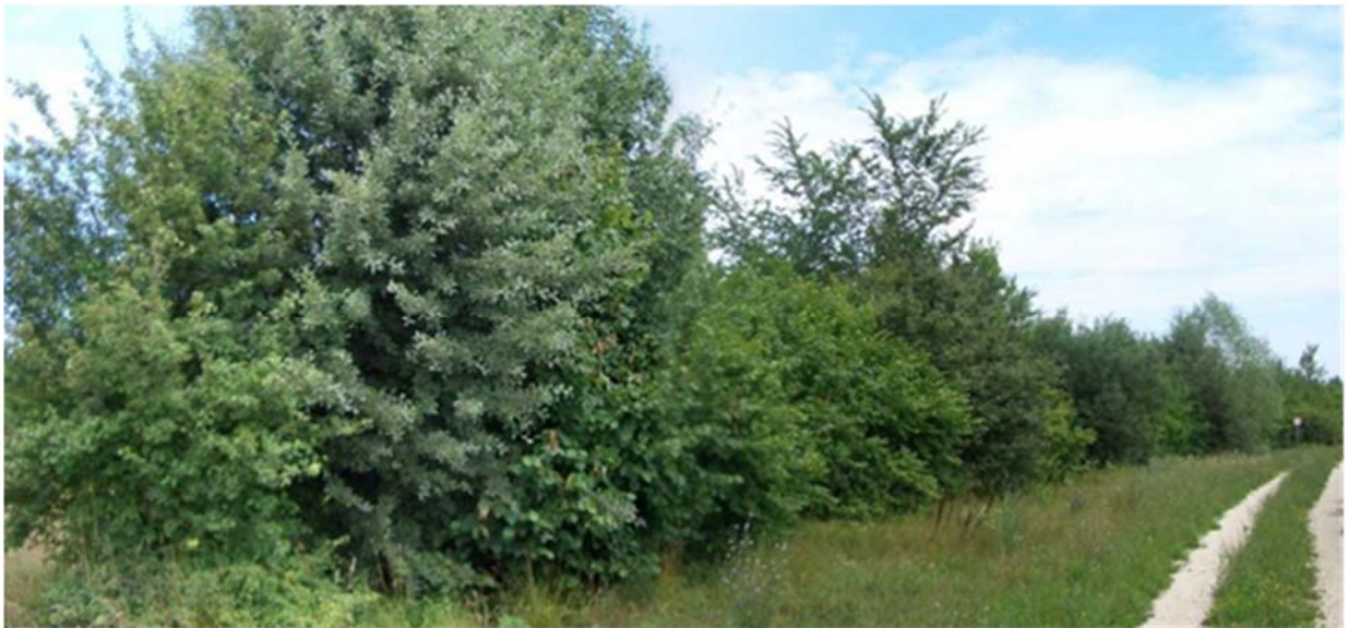
Foto n. 11 - Bosco di Bandiziol