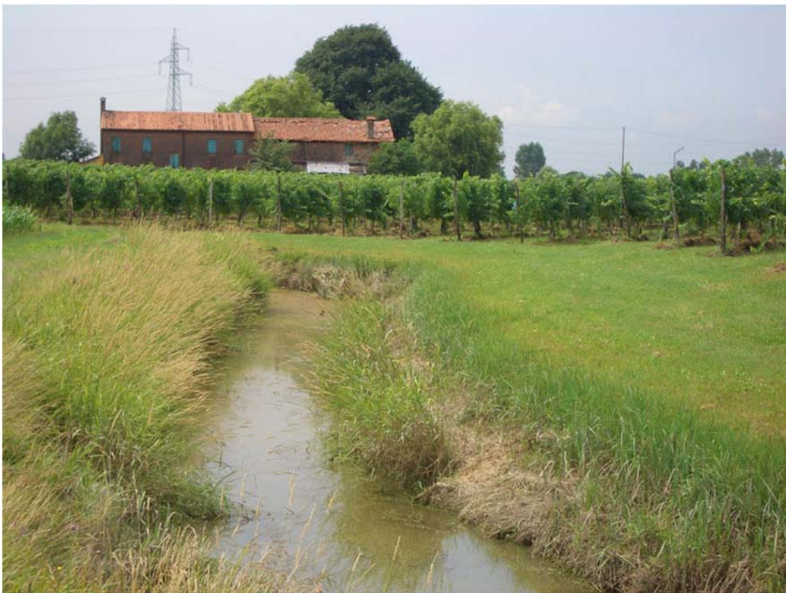
Foto n. 47 - Il Canale Melonetto verso Cà Zulianello