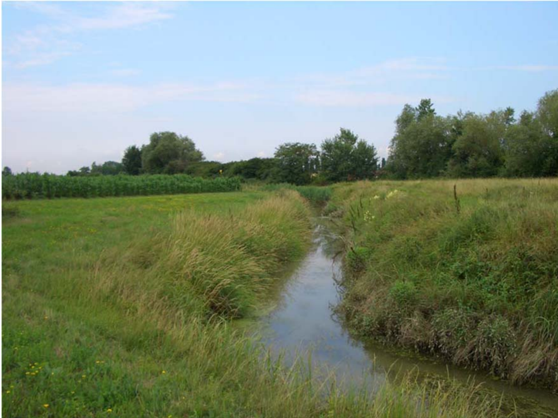
Foto n. 37 - Visuale presso l'area golenale di progetto (in sinistra); in destra: lungo il Melonetto è presente il corridoio ecologico individuato dal PTRC