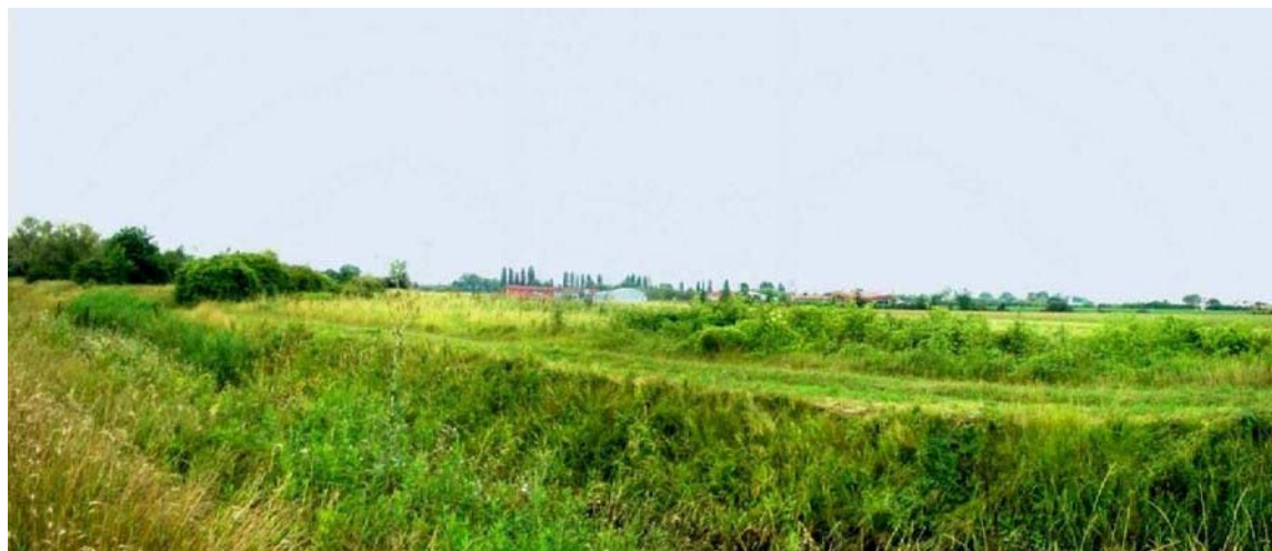
Foto n. 38 - Visuale del Canale Melonetto verso il “Parco Livenza”