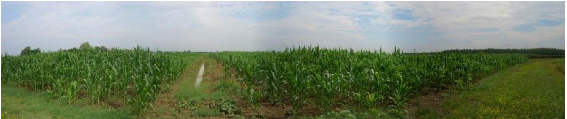
Foto n. 48a - Zone agricole a sud del futuro ingresso del casello