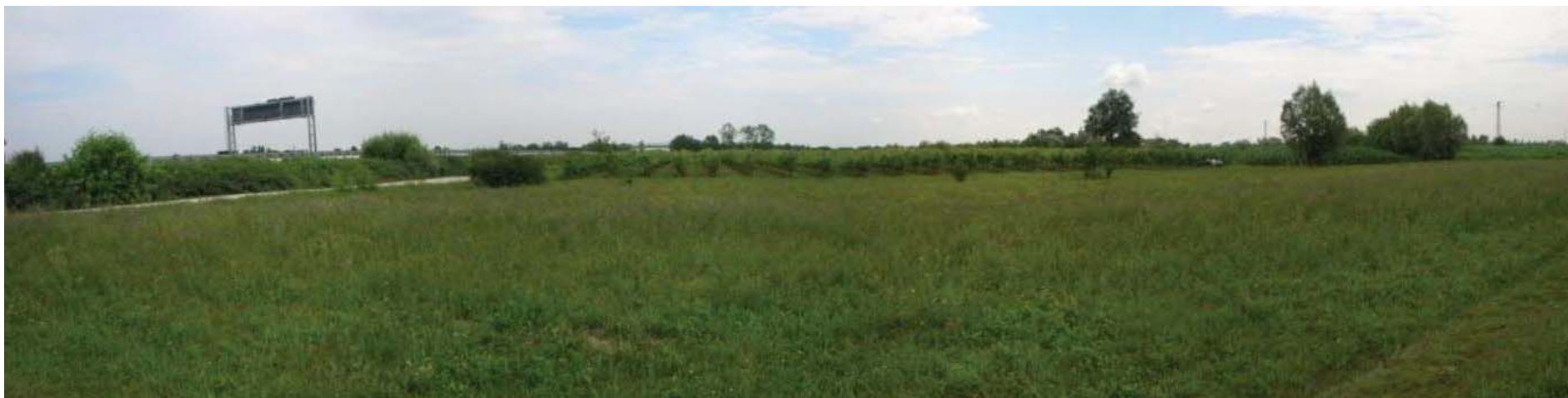
Foto n. 19 - Visuale in prossimità del cavalcavia di progetto