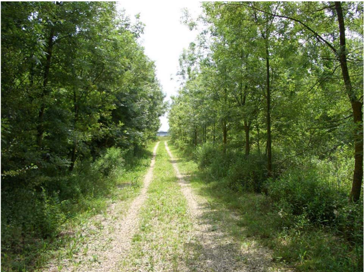
Foto n. 12 - Bosco di Bandiziol