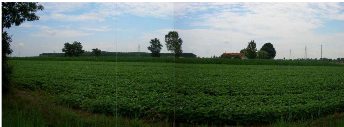
Foto n. 57 - Visuale verso parcheggi e rotonda di progetto