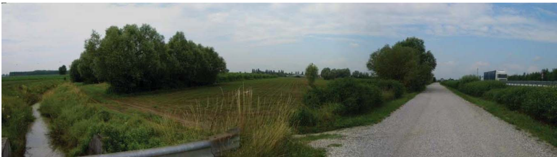
Foto n. 20 - Visuale verso vasca di laminazione 12 a di progetto