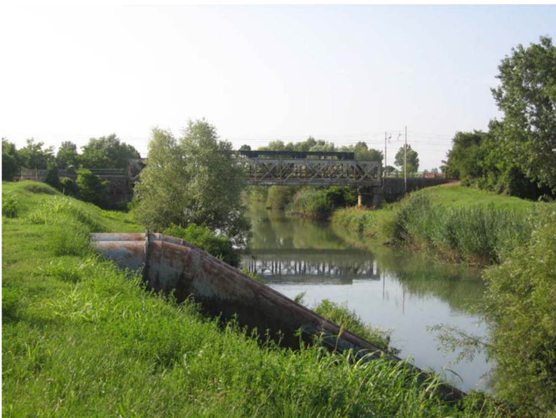
Foto n. 50 - Canale Malgher attraversato dalla linea ferroviaria VE-TS