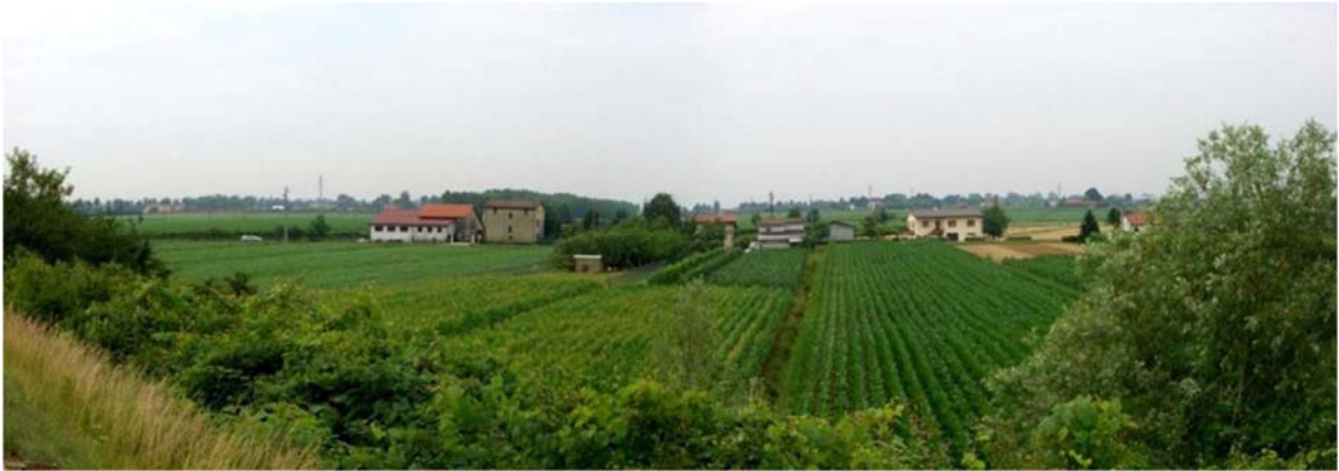
Foto n. 14 - Zona sud nuovo svincolo – le abitazioni lungo Via Punte