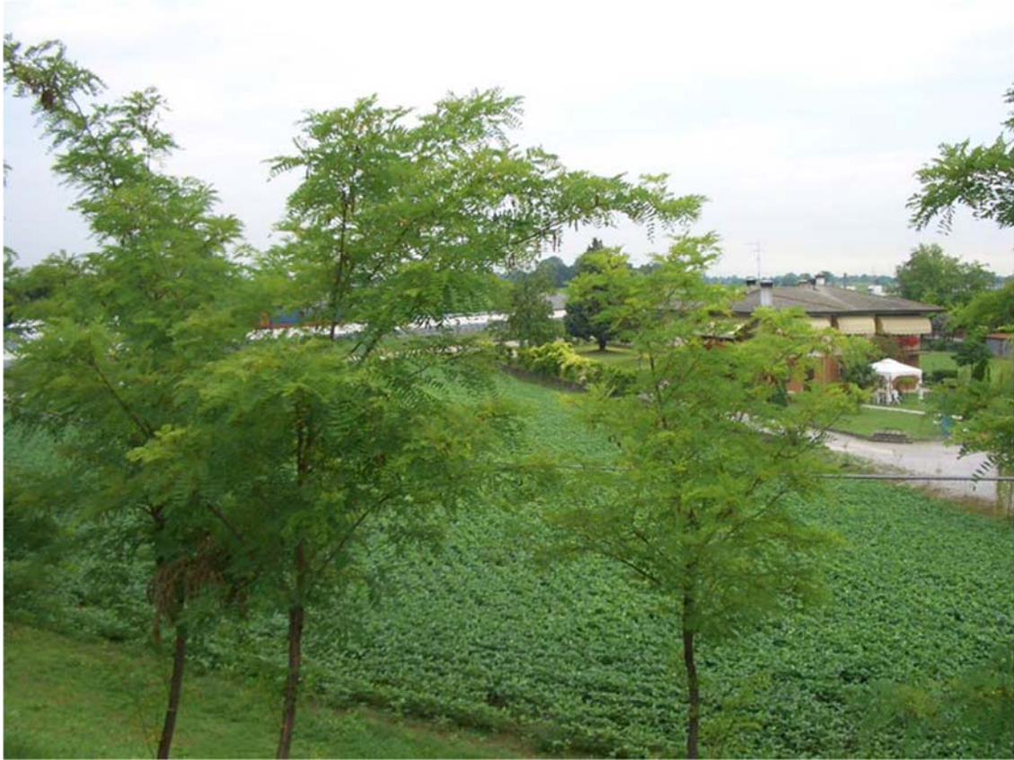
Foto n. 02- Zona sud nuovo svincolo – abitazioni e seminativi dal cavalcavia di Via Paludi