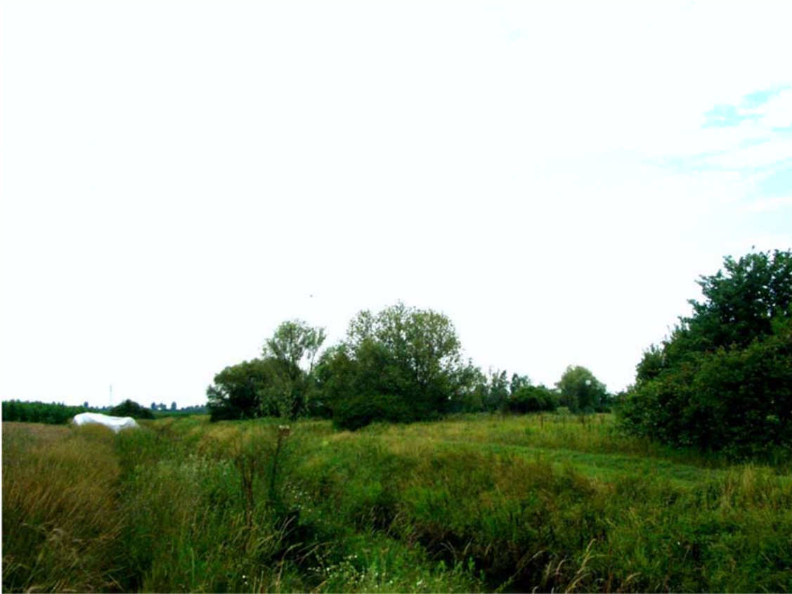
Foto n. 35 - Visuale del corridoio ecologico individuato dal PTRC