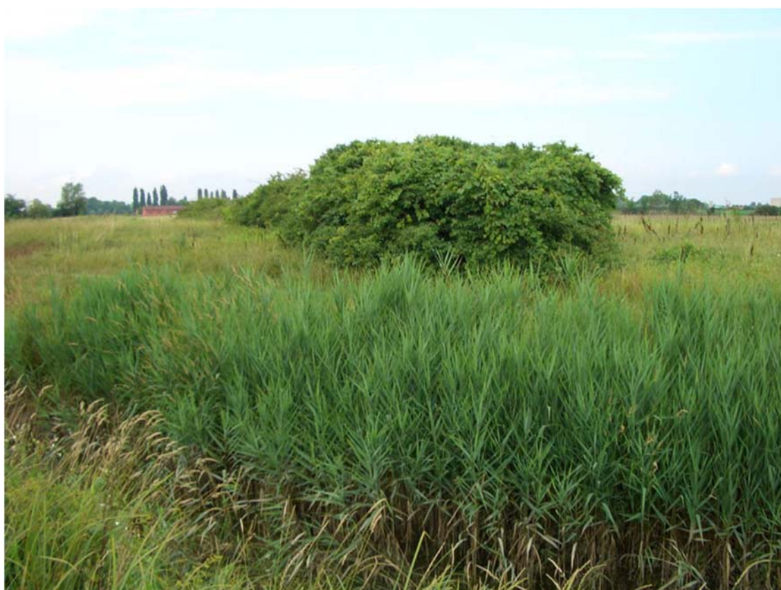
Foto n. 34 - Siepi esistenti in prossimità del corridoio ecologico individuato dal PTRC