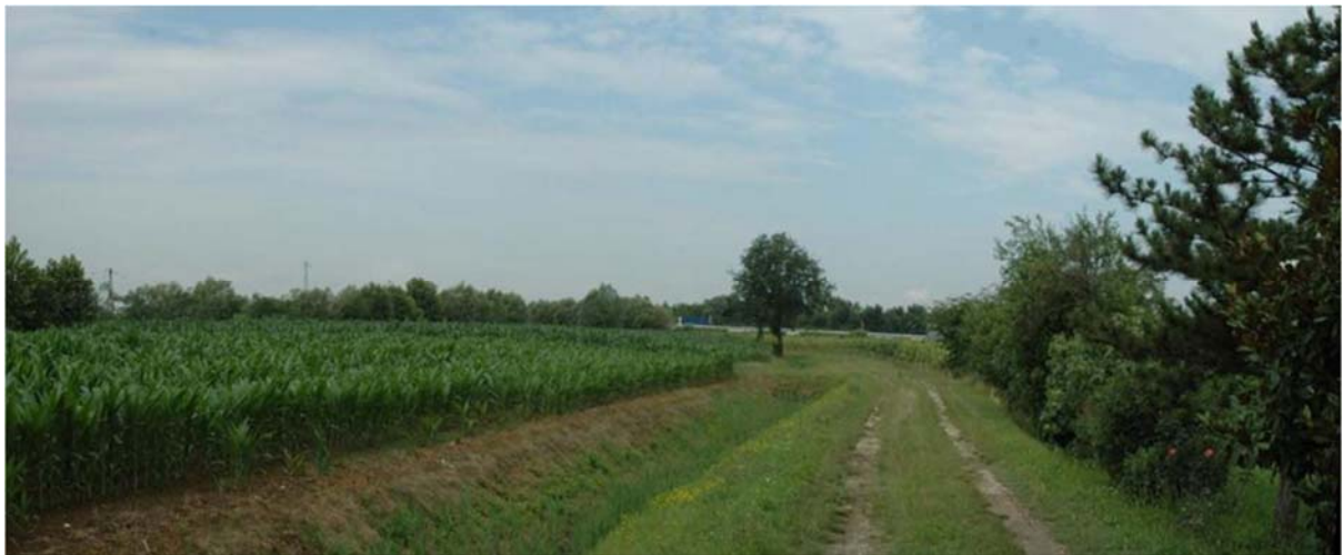
Foto n. 15 - Zona sud nuovo svincolo – tratto terminale di Via Punte