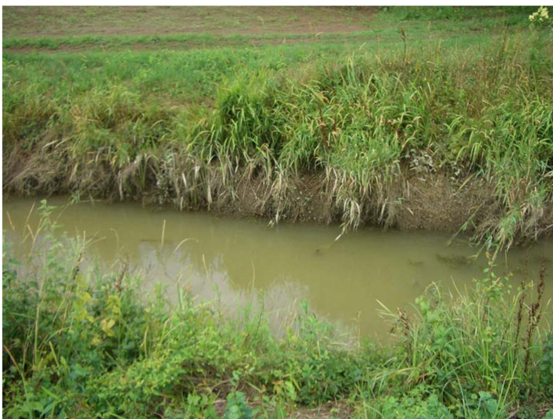
Foto n. 24 - Il Canale Melonetto