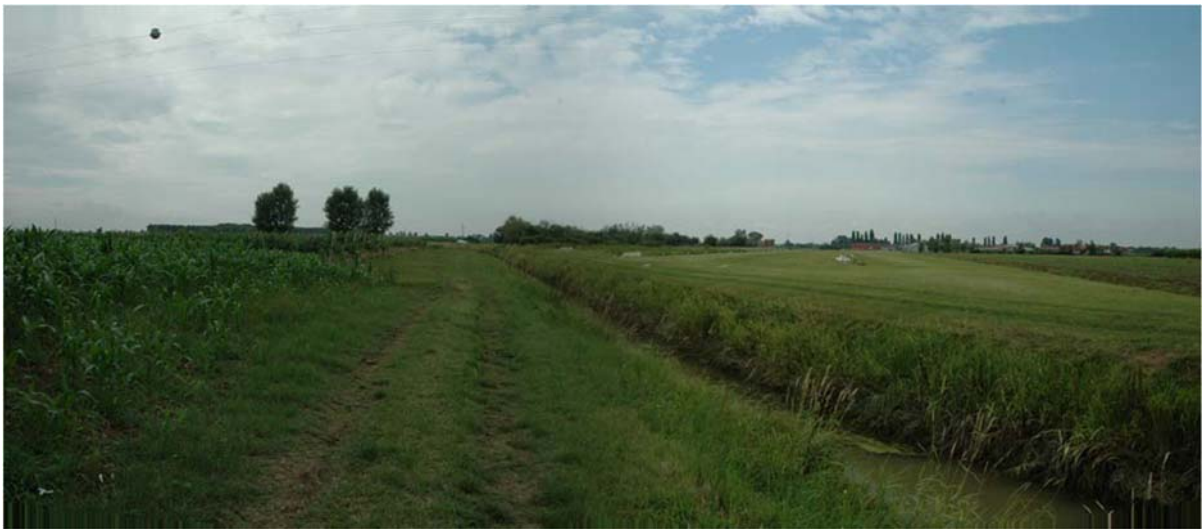
Foto n. 30 - Vista su zona golenale di progetto e Canale Melonetto – a destra l'avio superficie esistente