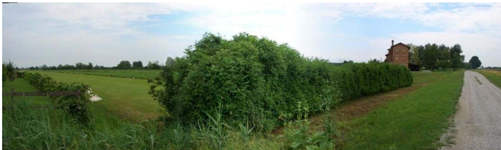
Foto n. 58 - Visuale verso avio superficie