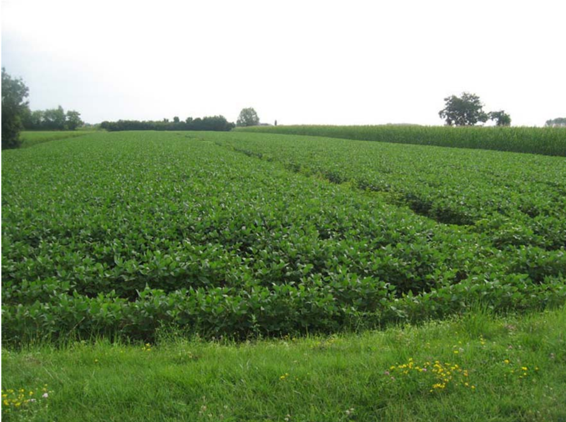
Foto n. 59 - Visuale verso casello e parcheggi di progetto