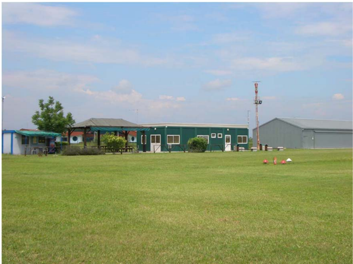
Foto n. 60 - Edifici a servizio dell'avio superficie