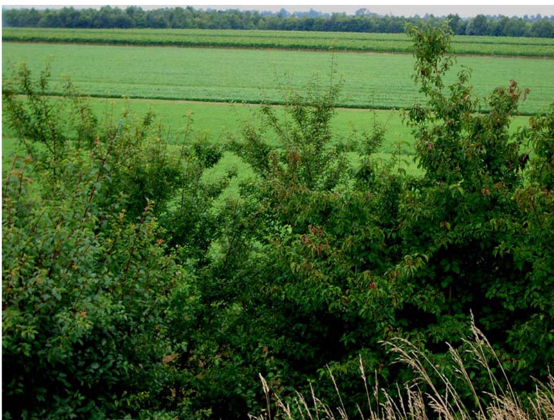
Foto n. 08 – Zona nord nuovo svincolo – siepi lungo il cavalcavia di Via Paludi e panorama est bosco di Bandiziol