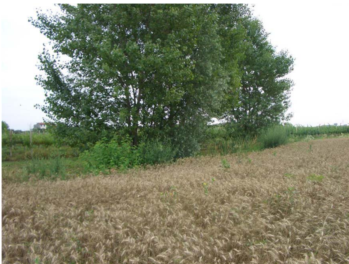
Foto n. 32 - Siepe residuale e scolina intercettata dal nuovo svincolo