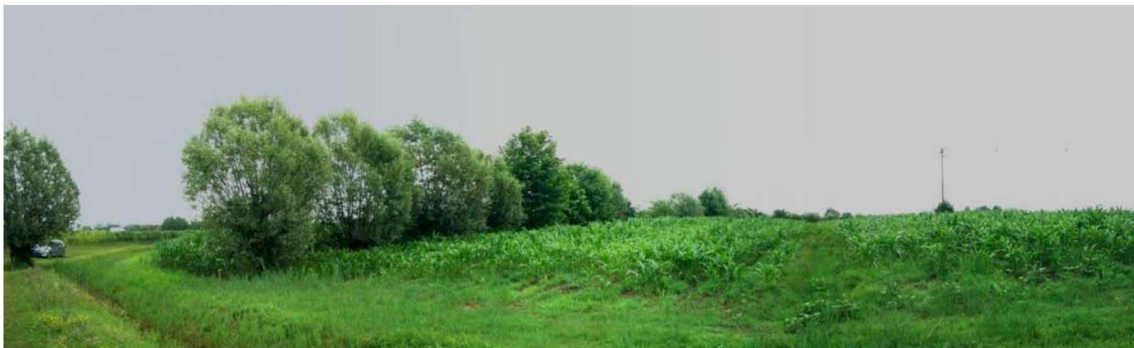
Foto n. 27 Zona sud nuovo svincolo – area presso rampa di ingresso verso TS (Asse B)