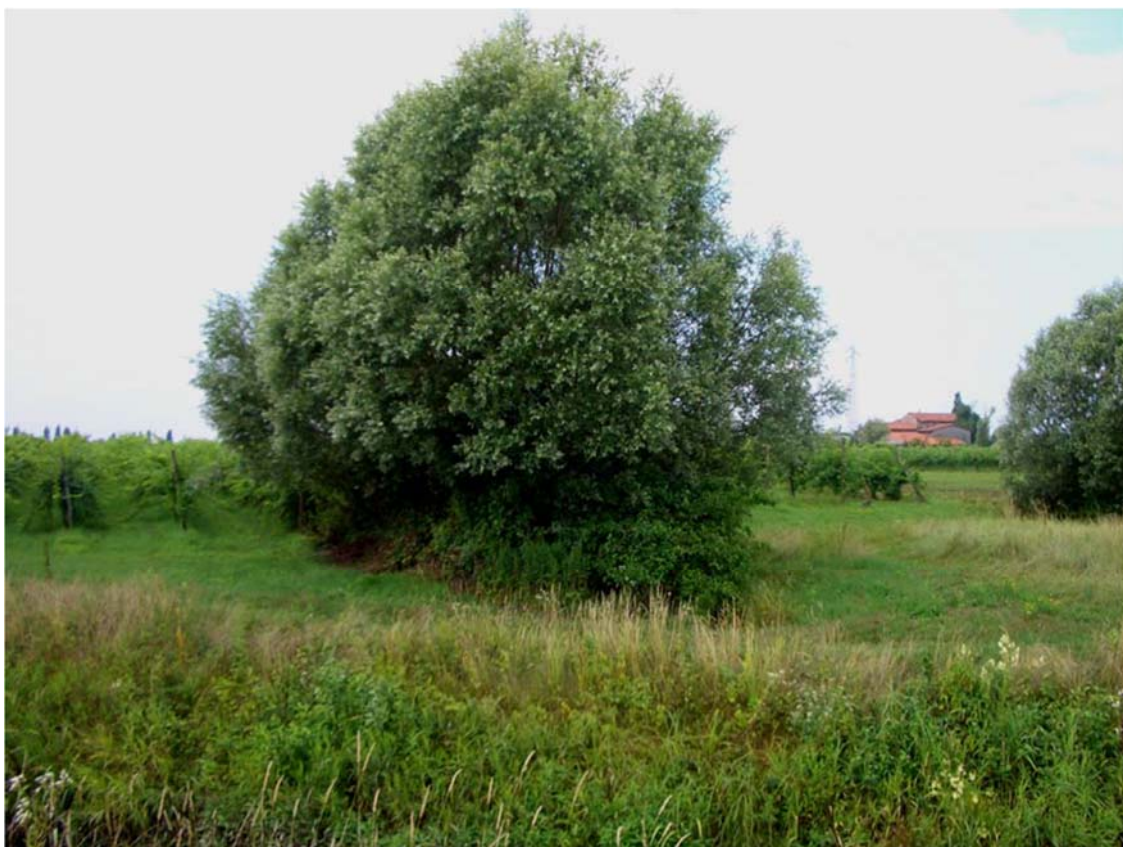
Foto n. 23 - Siepi in destra del Canale Melonetto