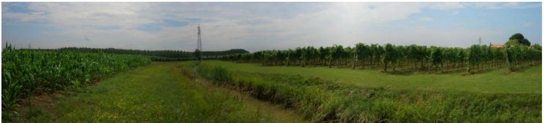
Foto n. 48b - Zone agricole a sud del futuro ingresso del casello