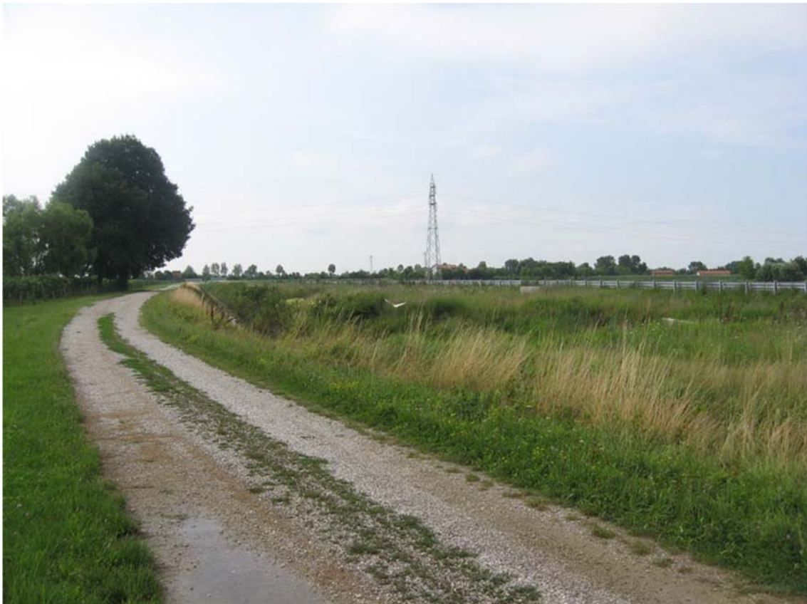
Foto n. 54 - Visuale viabilità esistente presso zona rotonda di progetto – sullo sfondo variante S.P.59 in costruzione