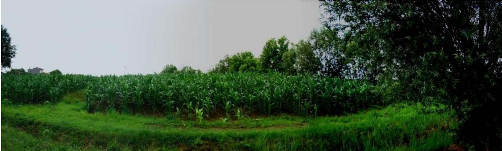
Foto n. 16 - Zona sud nuovo svincolo - seminativo e siepi presso il cavalcavia e la rampa di ingresso in A4 verso TS (Asse B)