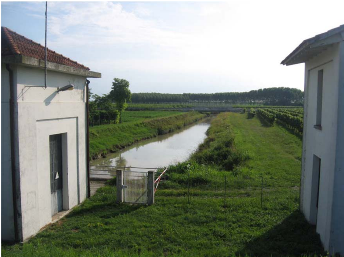
Foto n. 49 - Idrovora S. Osvaldo presso Canale Malgher