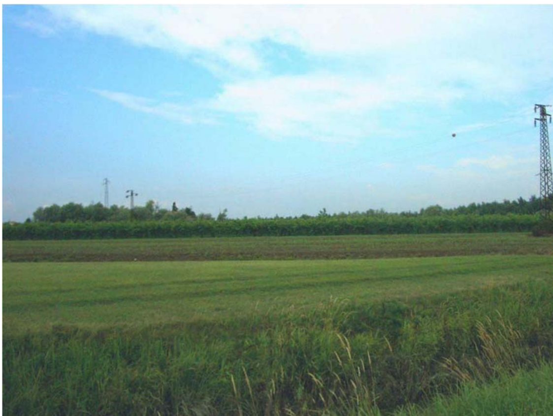
Foto n. 31 - Panorama in prossimità della vasca di laminazione n°12 a