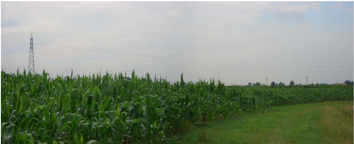
Foto n. 46 - Visuale presso parte finale vasca di laminazione 12 b di progetto