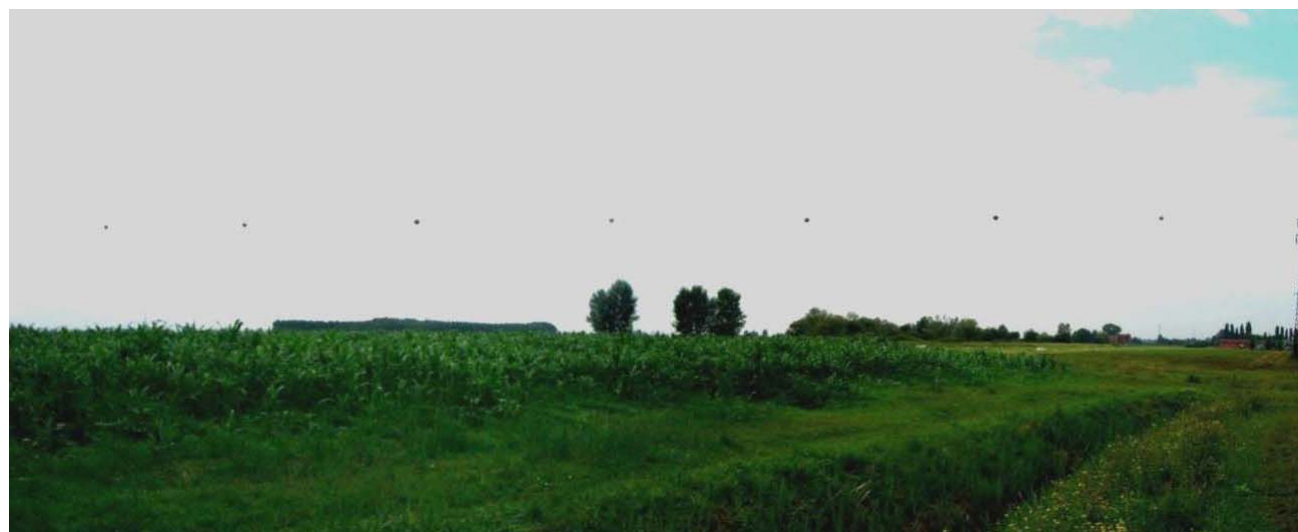
Foto n. 28 - Zona sud nuovo svincolo – uso del suolo a seminativo presso il cavalcavia di progetto