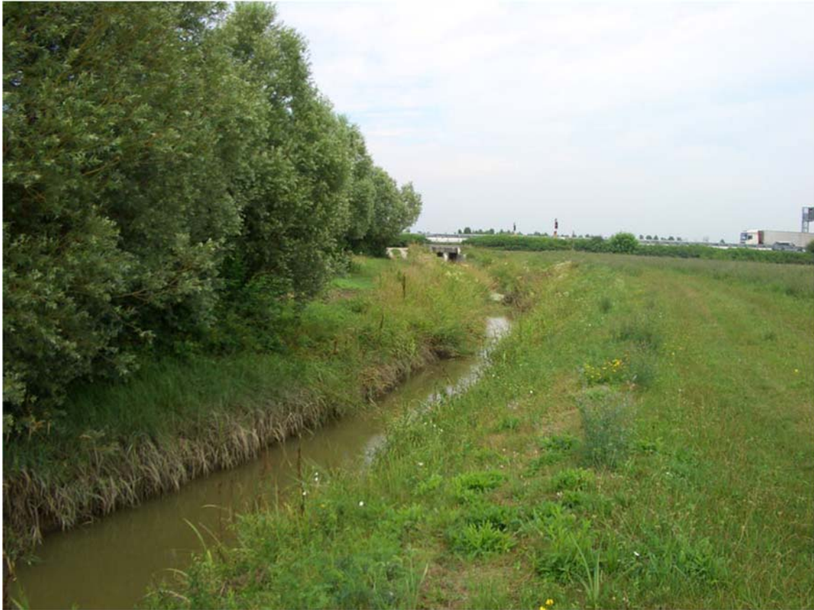
Foto n. 29 - Vista A4 dal Canale Melonetto