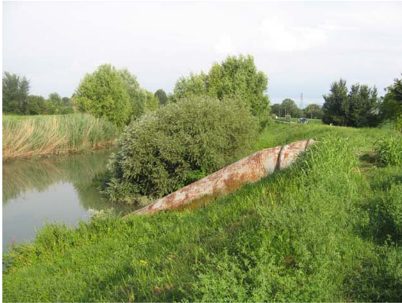
Foto n. 51 - Vegetazione sul Canale Malgher