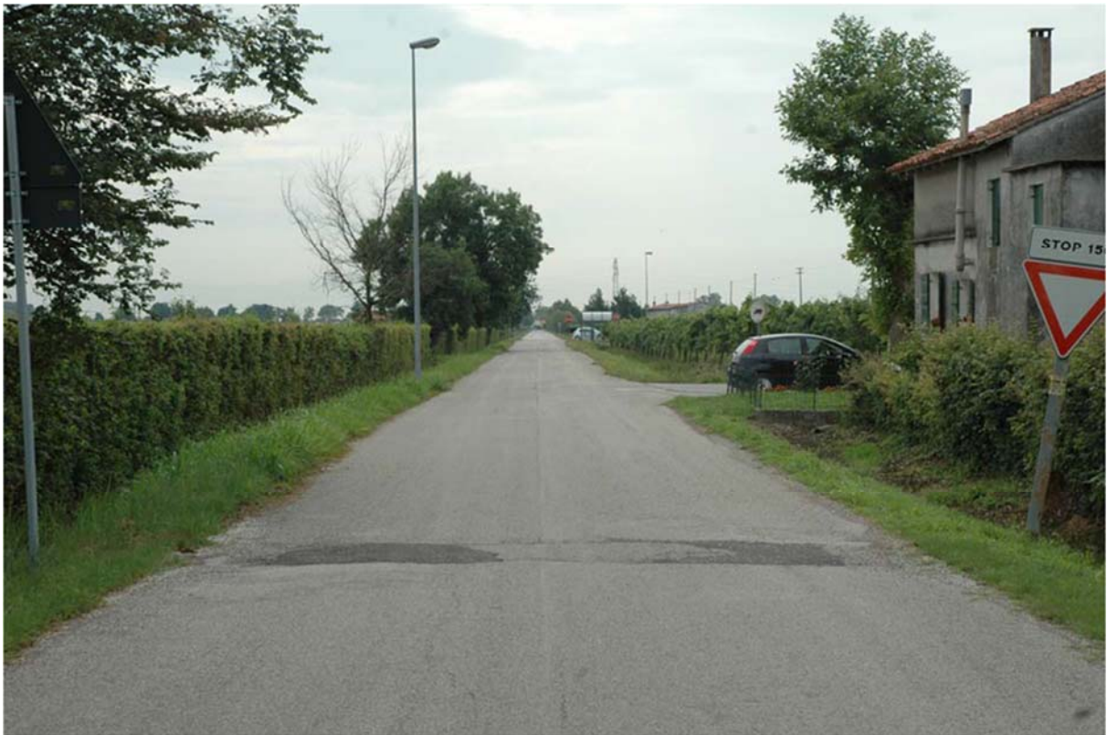
Foto n. 05 - Zona sud nuovo svincolo – lungo Via Fosson, verso l'incrocio con Via Paludi