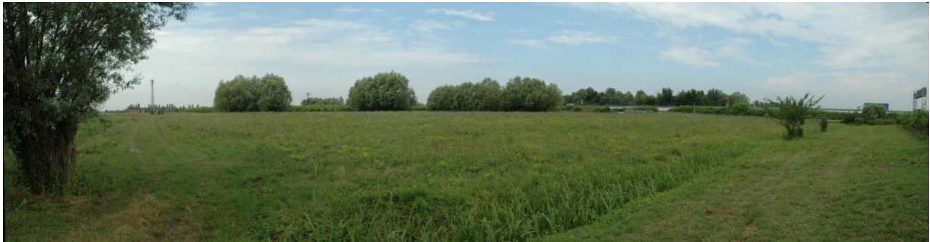
Foto n. 17 - Zona sud nuovo svincolo – area incolta presso il cavalcavia e le rampe di uscita di progetto (Asse E)