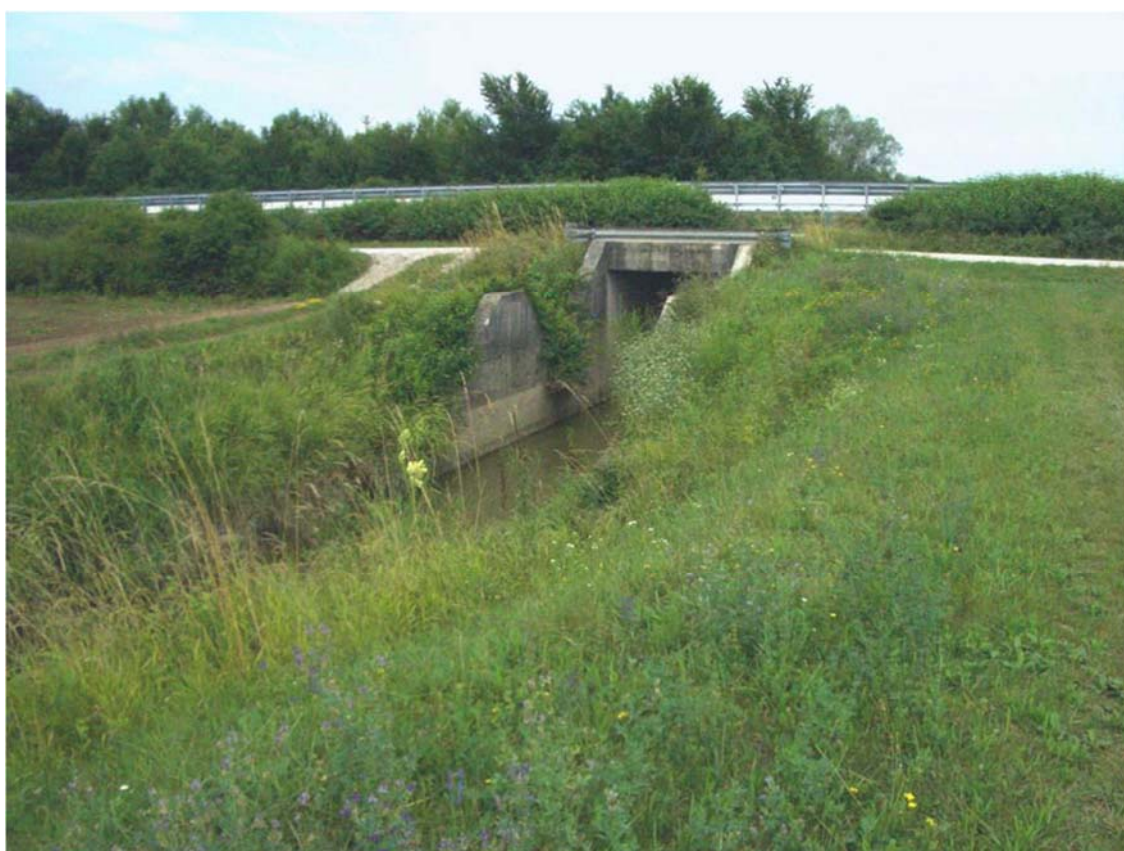
Foto n. 22 - Attuale canna armata sul Canale Melonetto