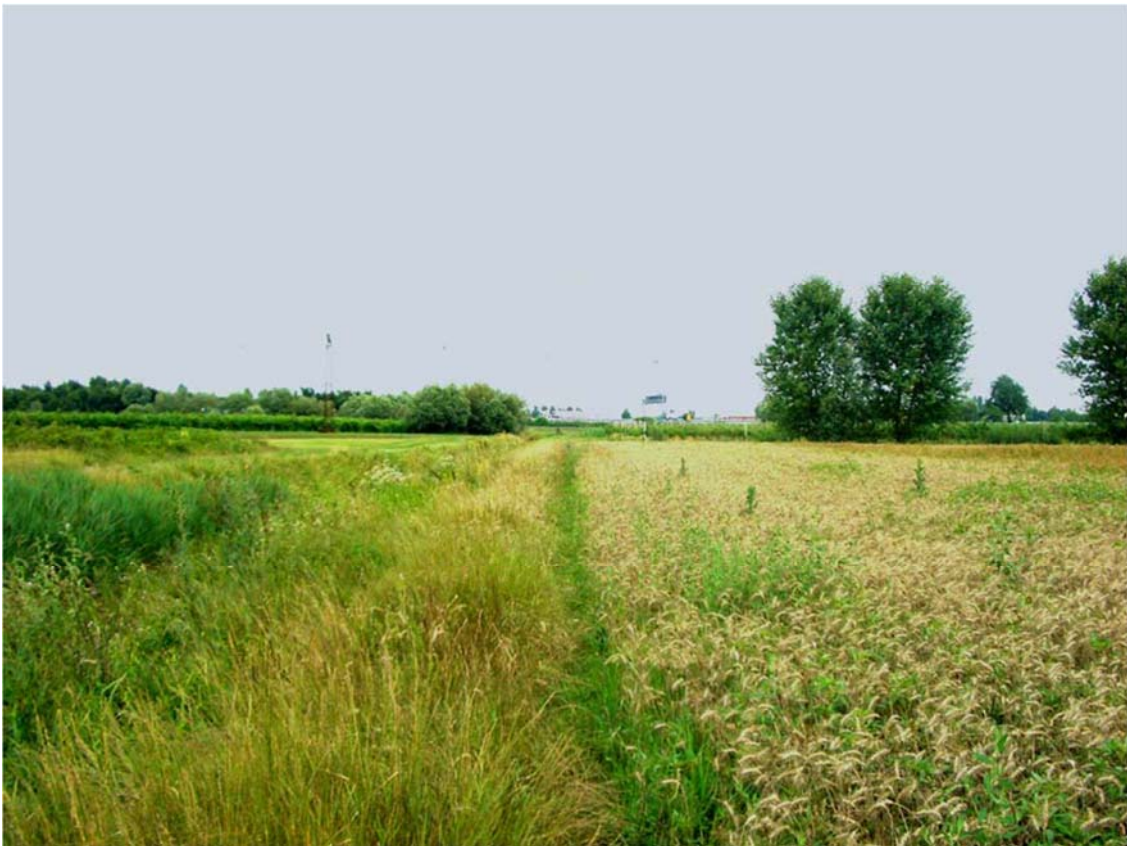
Foto n. 36 - Visuale verso A4 presso area golenale di progetto