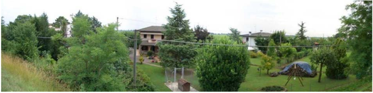
Foto n. 01 - Zona nord nuovo svincolo – abitazioni lungo Via Paludi