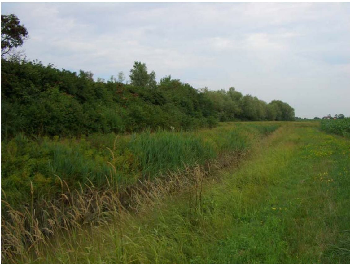
Foto n. 43 - Canale Melonetto in prossimità dell'area golenale di progetto