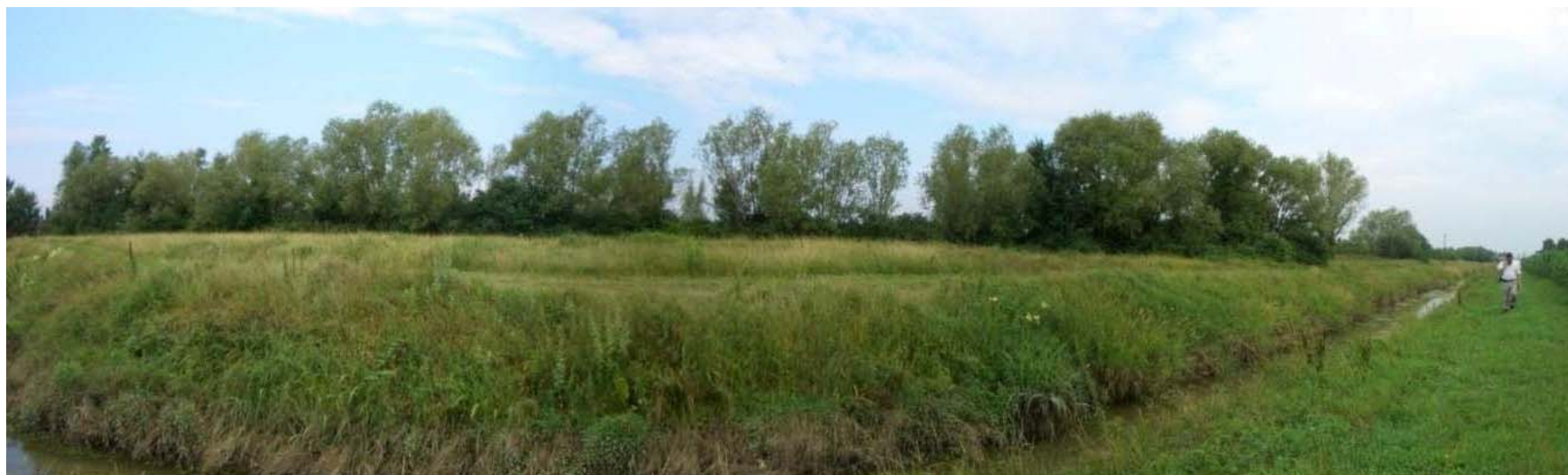
Foto n. 39 - Area adibita a corridoio ecologico secondo il PTRC