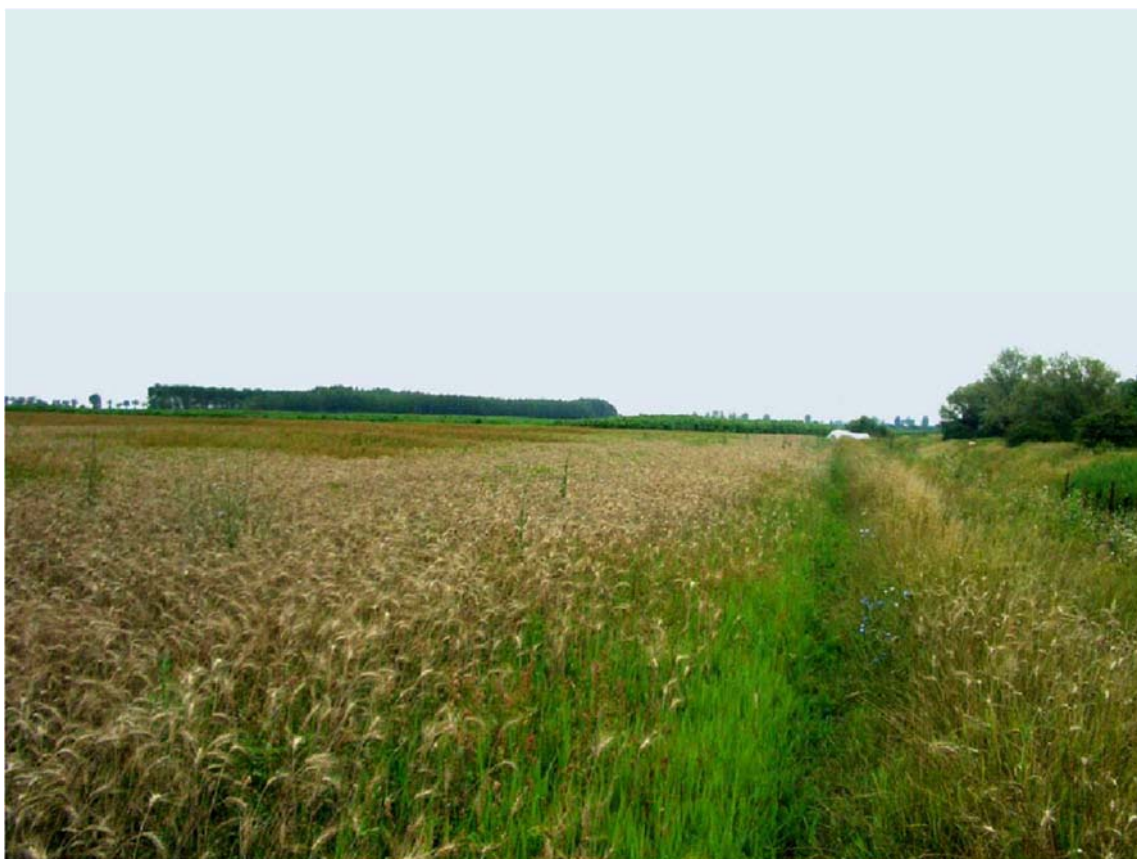
Foto n. 33 - Zone agricole intercettate dal nuovo svincolo