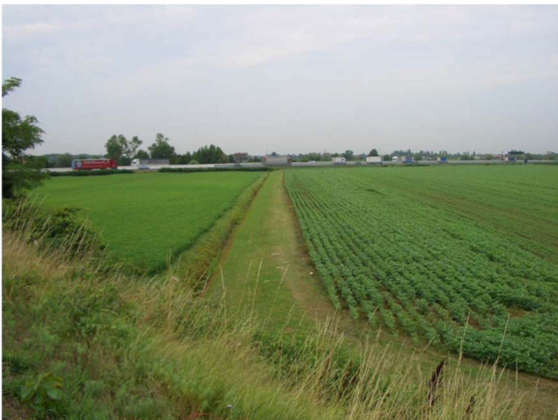
Foto n. 07 – Zona nord nuovo svincolo - uso del suolo a seminativo