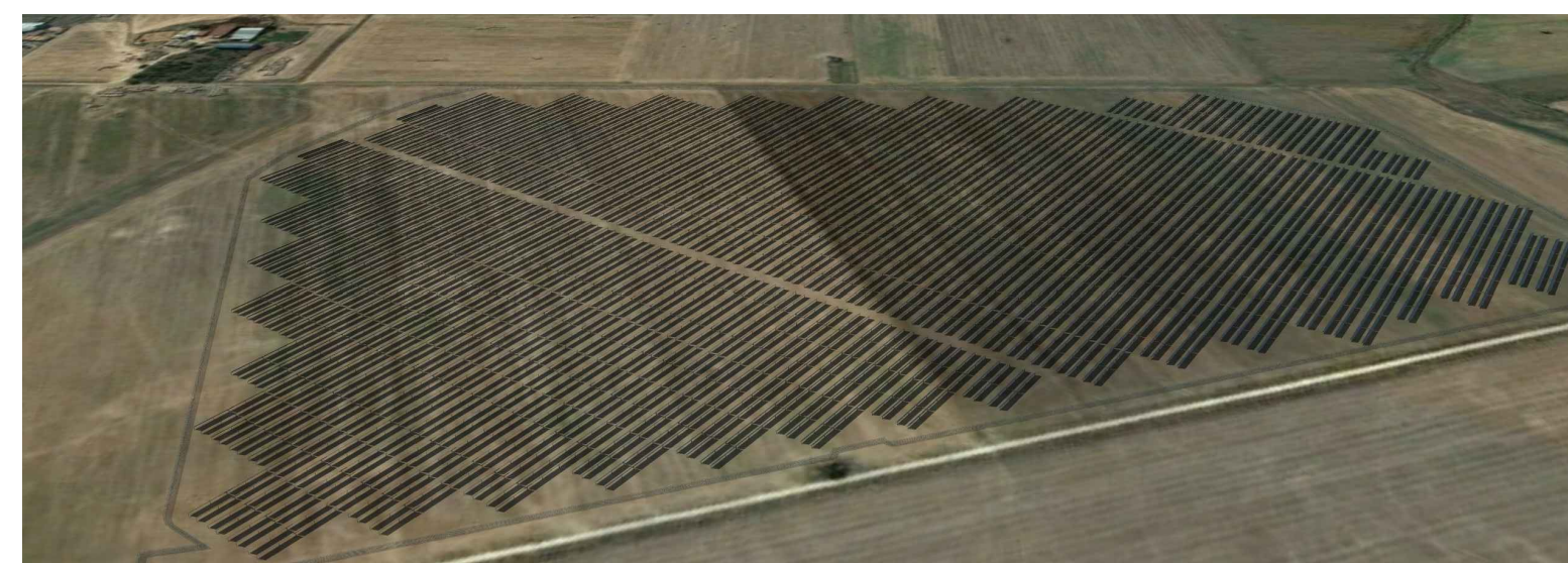
Vista 2 - Volo d'uccello direzione nord/ovest - sud/est