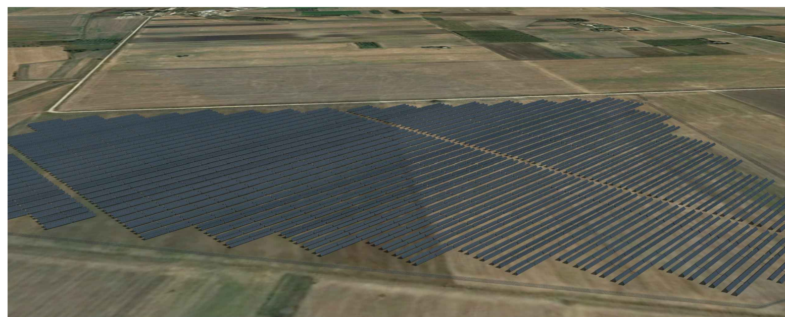
Vista 1 - Volo d'uccello direzione sud/est - nord/ovest