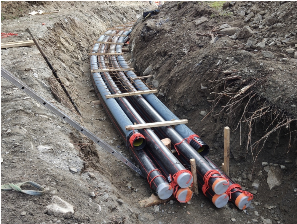
Esempio di posa in trincea

Inoltre, è prevista la posa del cavo all'interno della galleria di accesso alla centrale in caverna. All'interno del tunnel, (opere non facenti parte del presente progetto), sarà ricavato un cunicolo, all'interno del quale verranno posati i cavi AT. Il cunicolo sarà poi coperto da un grigliato carrabile.