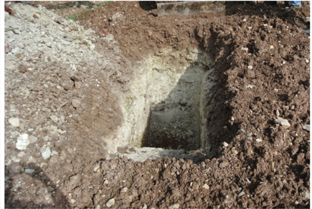
Trincea di campionamento