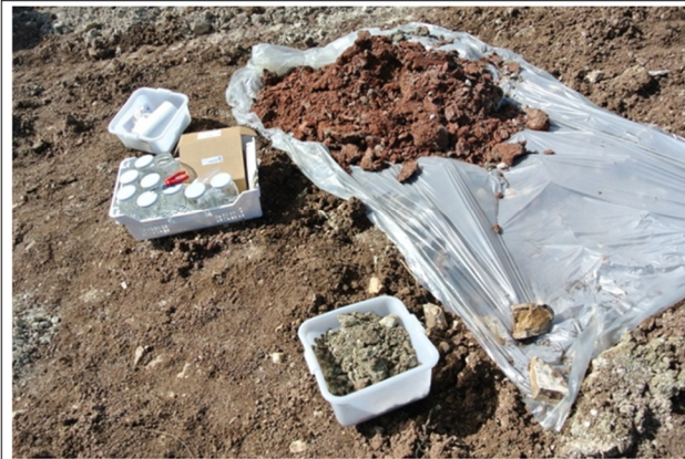
Deposito materiale scavato