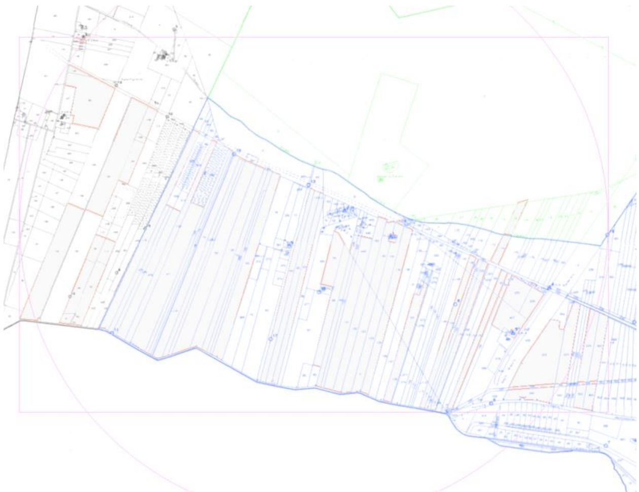
Figura 2.2: Inquadramento catastale