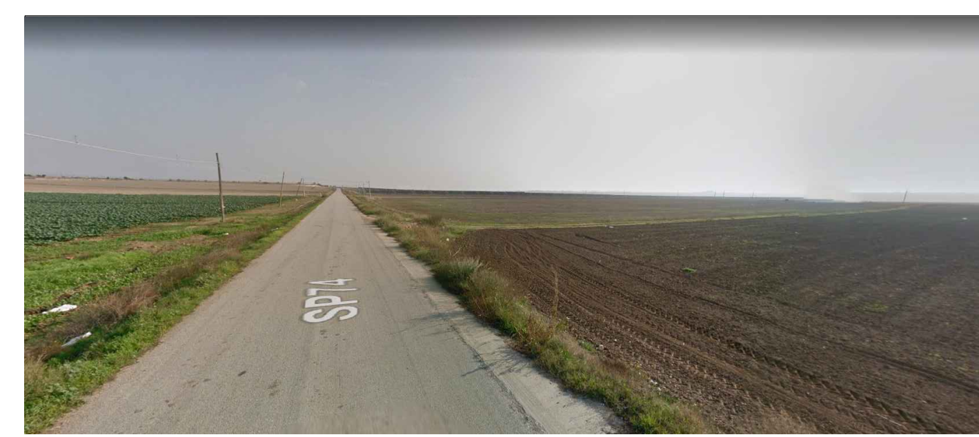
FOTOINSERIMENTO 2 - STATO DI FATTO