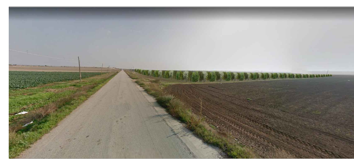
FOTOINSERIMENTO 2 - STATO DI PROGETTO