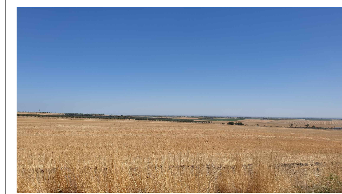
FOTOINSERIMENTO 3 - STATO DI FATTO