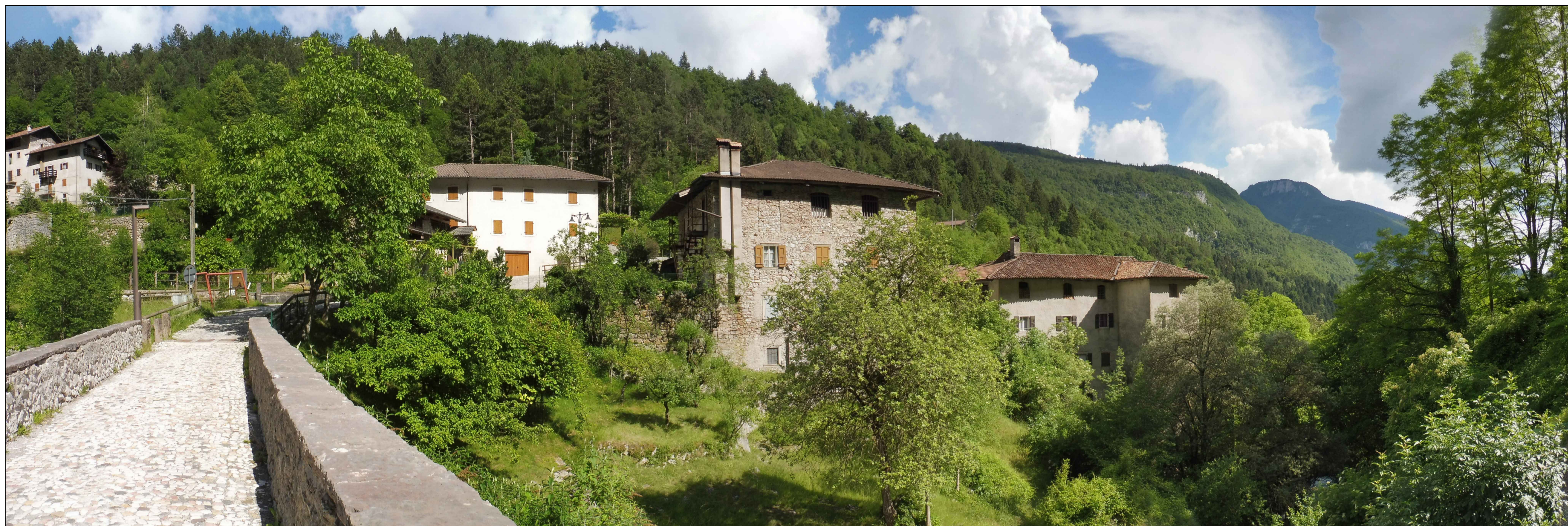
Fotoinserimento 4 - vista dalla località Molino (ponte sul rio Bondai vincolato) - STATO ATTUALE