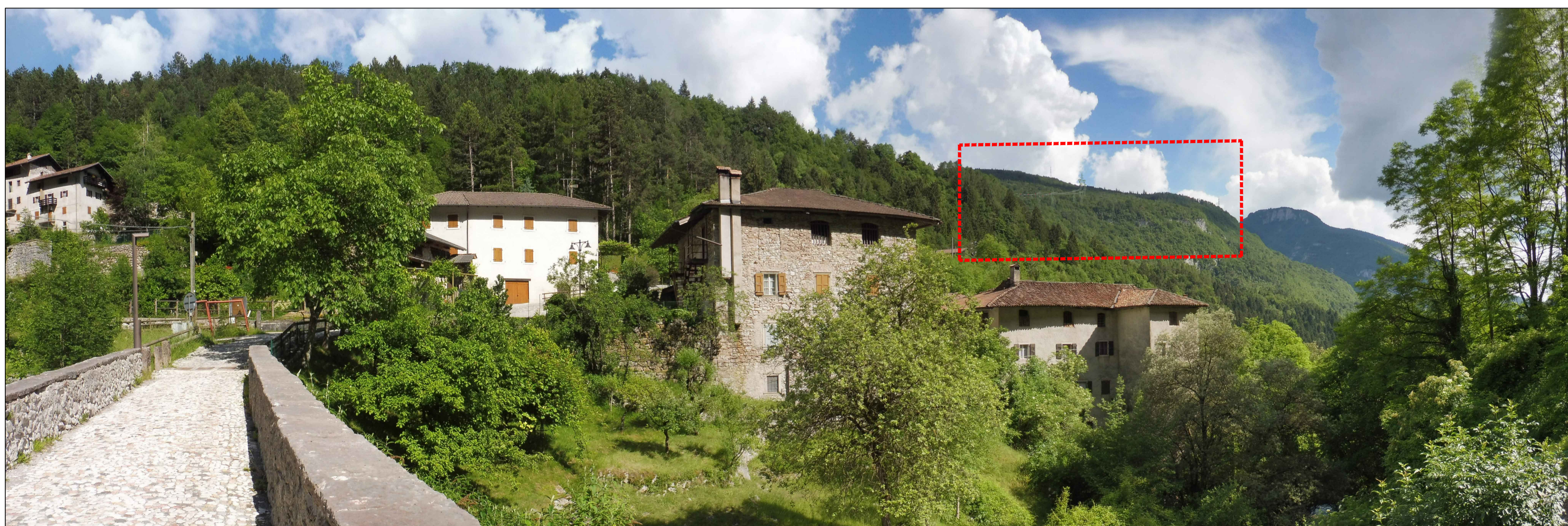
Fotoinserimento 4 - vista dalla località Molino (ponte sul rio Bondai vincolato) - SIMULAZIONE DI INSERIMENTO DEL PROGETTO MITIGATO CON VERNICIATURA DEI SOSTEGNI