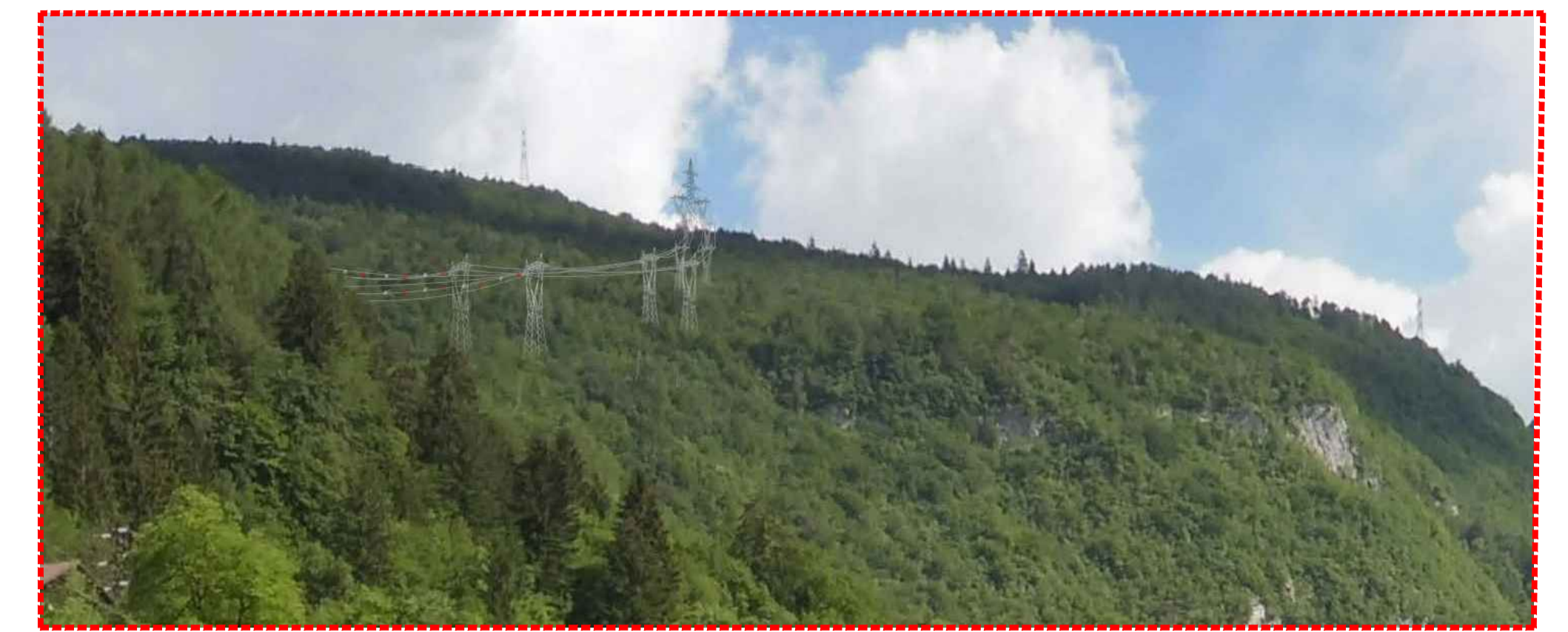
Fotoinserimento 4 - Simulazione di inserimento - zoom di dettaglio