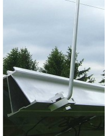
Viste punta di captazione con fissaggio tramite morsetto