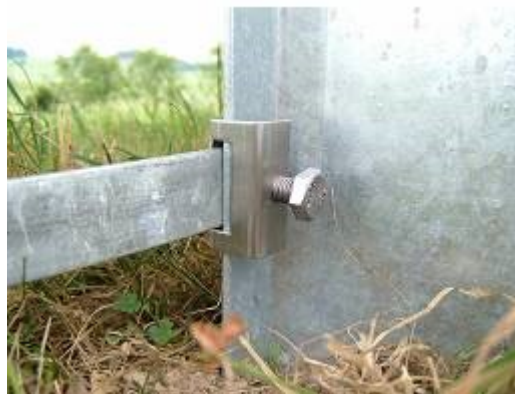
Morsetto da fondazione