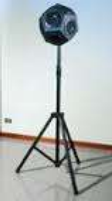
a) Amplificatore di potenza 500 Watt;