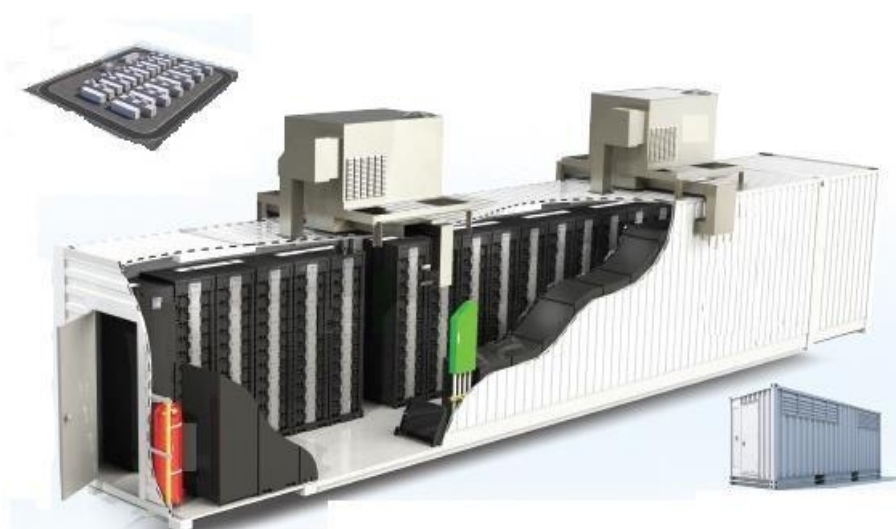
Figura 3 – spaccato container tipo storage

L'impianto di accumulo potrà operare come sistema integrato all'impianto FV al fine di accumulare una parte della produzione del medesimo, non dispacciata in rete e rilasciarla in orari in cui l'impianto FV non è in produzione o ha una produzione limitata. L'impianto di accumulo, inoltre potrà operare in maniera indipendente al fine di fornire servizi ausiliari alla rete operando sui mercati dell'energia elettrica e dei servizi, in particolare come arbitraggio sul MGP (Mercato del Giorno Prima) e sul MI (Mercato Infra-giornaliero) e come Riserva Primaria, Riserva Secondaria, Riserva Terziaria sul MSD (Mercato dei Servizi di Dispacciamento) e partecipare ai progetti speciali che verranno banditi da Terna negli anni a venire per l'approvvigionamento di nuovi servizi di rete. Infine, l'impianto di accumulo con l'impianto di produzione FV, potrà partecipare al mercato della capacità sulla piattaforma dell'operatore di rete.