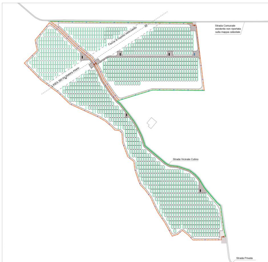
Figura 4 – Tipica disposizione di filari

Si rimanda alle tavole del progetto agronomico allegate al presente progetto definitivo per maggiori dettagli relativi all'impianto olivicolo.