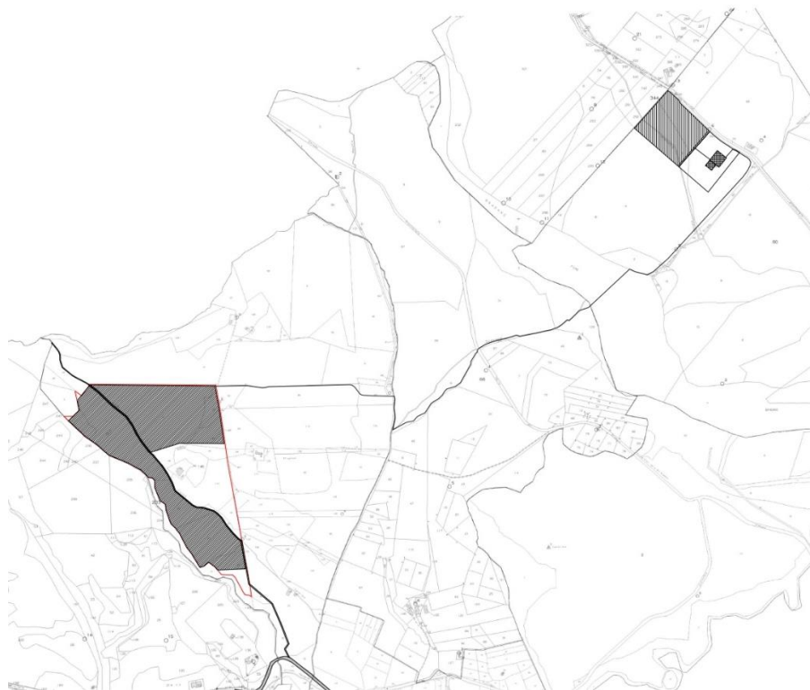
Figura 1 – Inquadramento generale del progetto – estratto carta catastale

Il progetto è ubicato in zona agricola in agro di Grottole (MT), in località San Donato. La figura che segue mostra l'inquadramento del progetto nel contesto cartografico IGM.