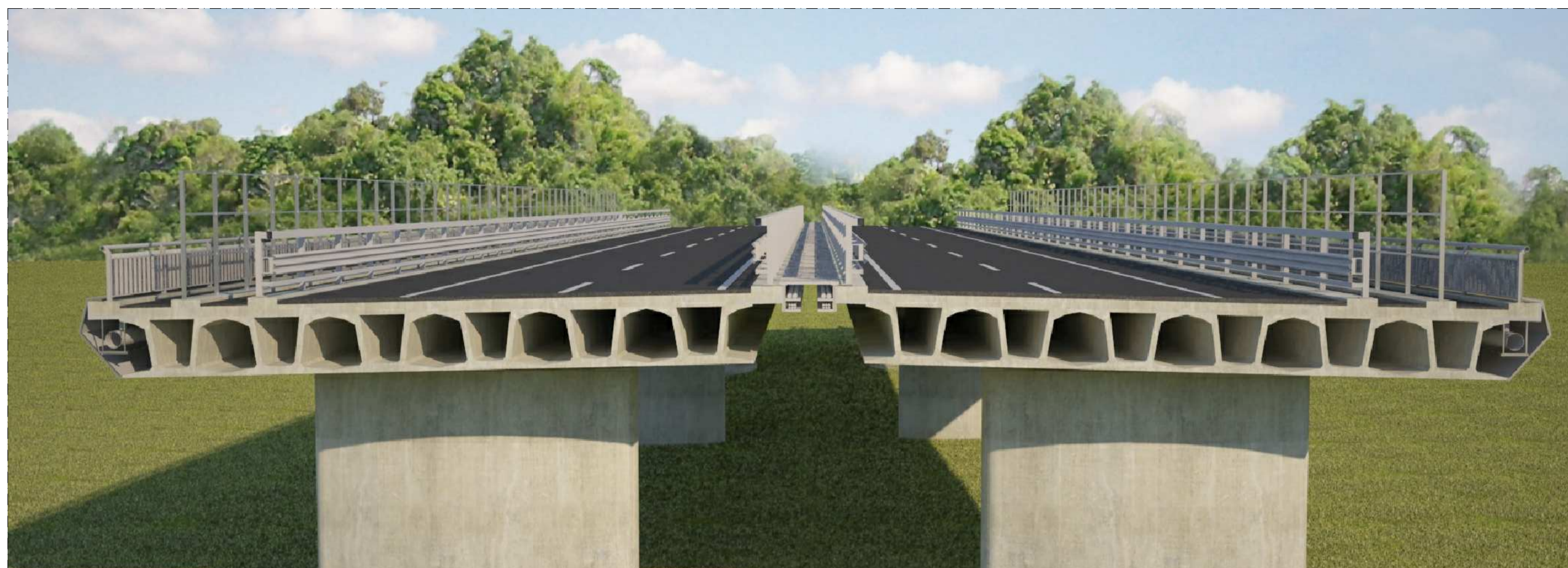
SIMULAZIONE - DETTAGLI IMPALCATO E CARTER METALLICO