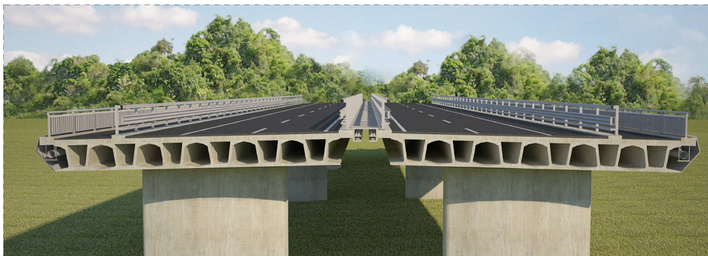
SIMULAZIONE - DETTAGLI IMPALCATO E CARTER METALLICO