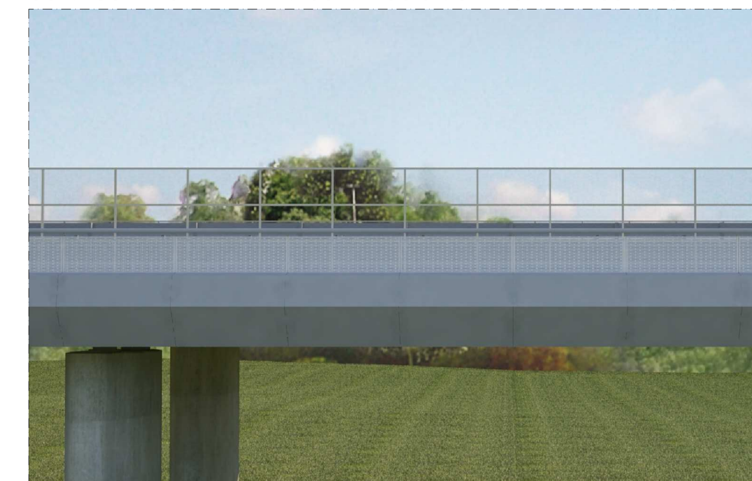
CONFIGURAZIONE PARAPETTO METALLICO - SIMULAZIONE - PROSPETTICO