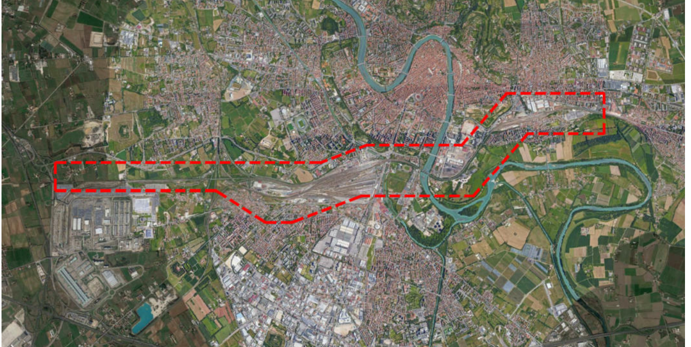
Figura 1 - Individuazione area d'intervento