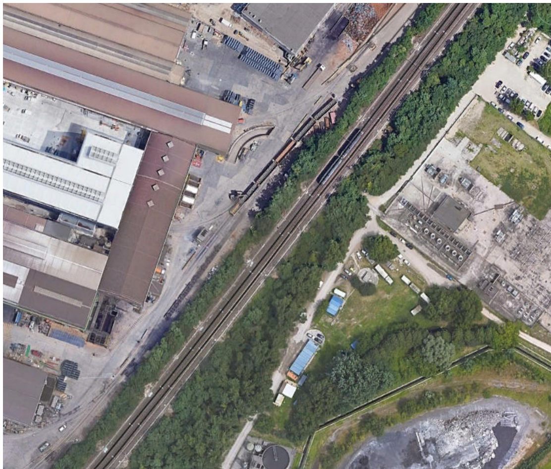
Figura 2 – Stato di fatto

Gli scatolari oggetto dell'intervento sono disposti a Sud delle interferenze attuali con il tracciato della linea ferroviaria.