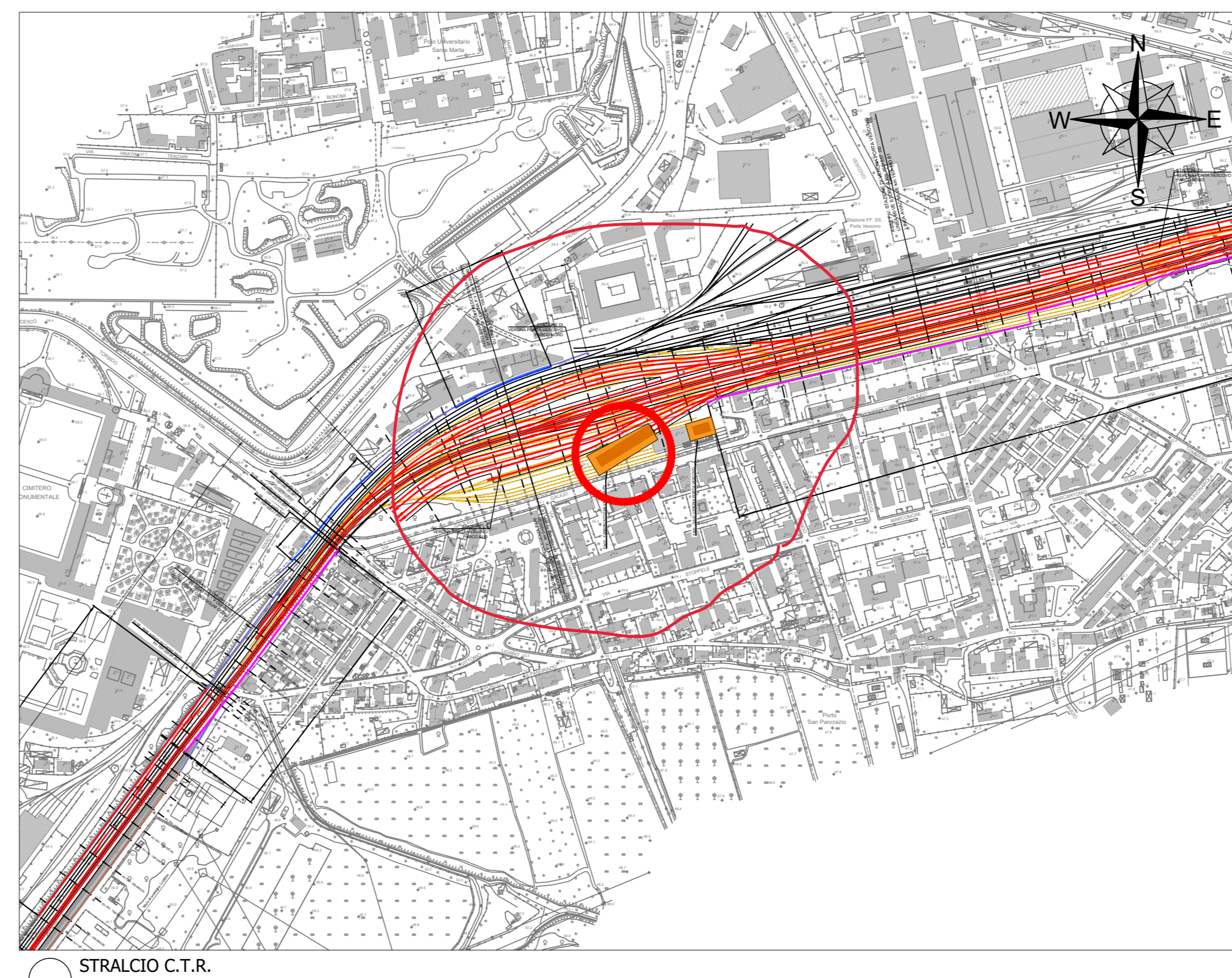
STRALCIO C.T.R. scala:1:5.000