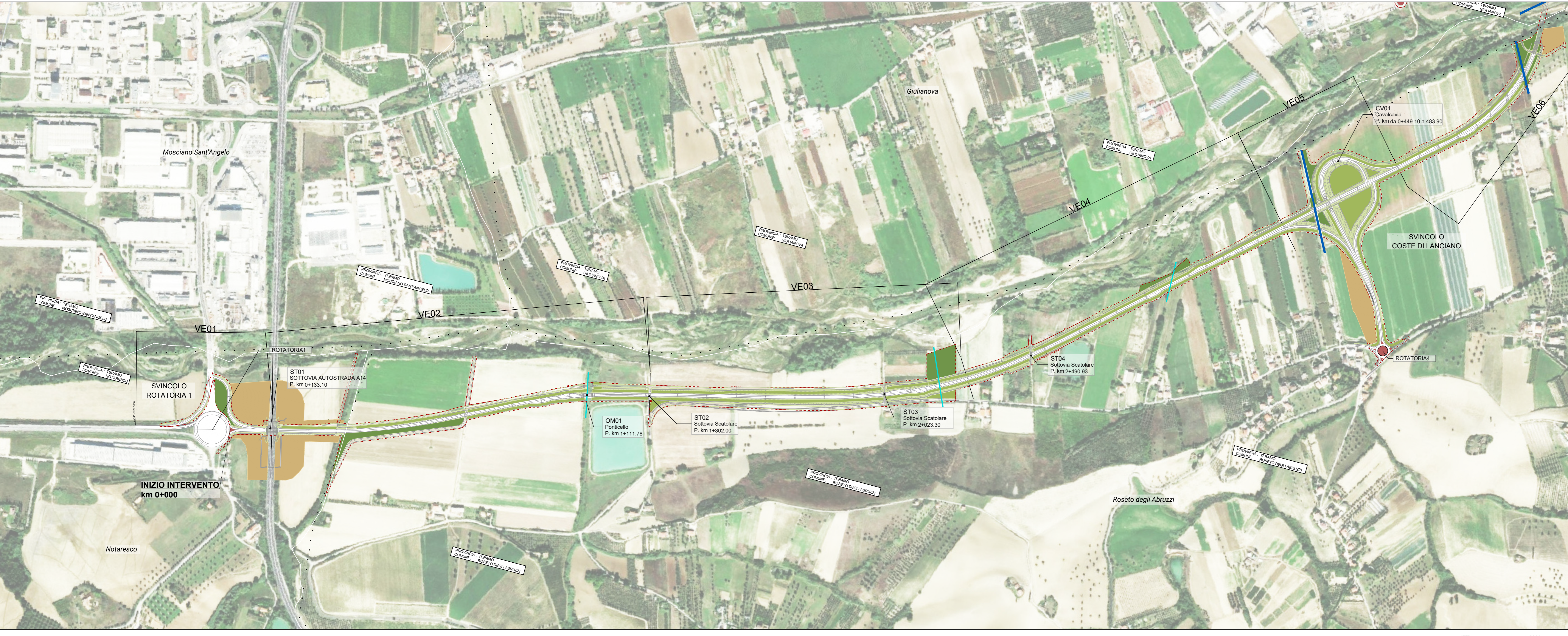
01 PLANIMETRIA GENERALE INTERVENTI DI INSERIMENTO PAESAGGISTICO E AMBIENTALE T.5000