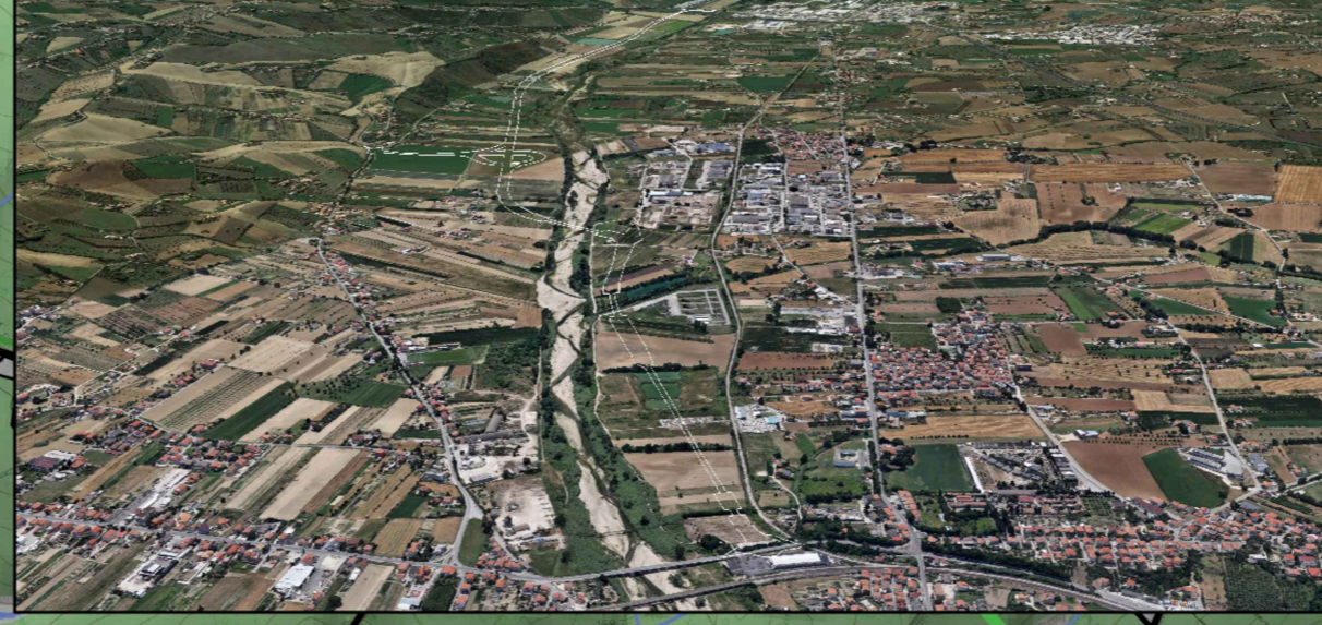
3 - Vista aerea del tracciato stradale