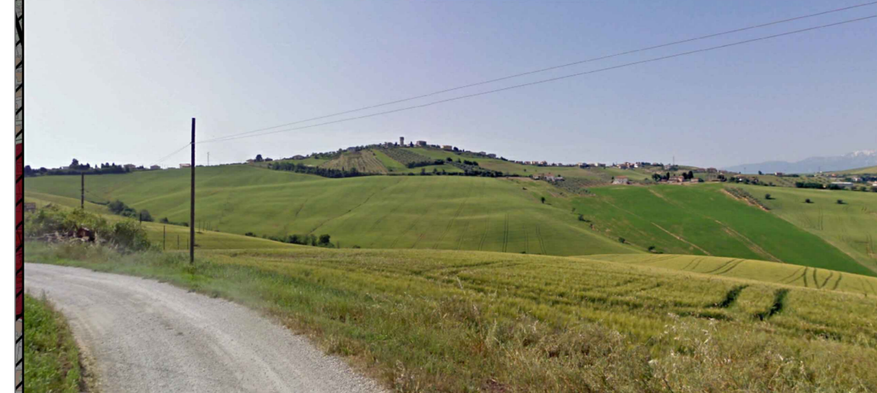
1 - Paesaggio delle Colline Teramane