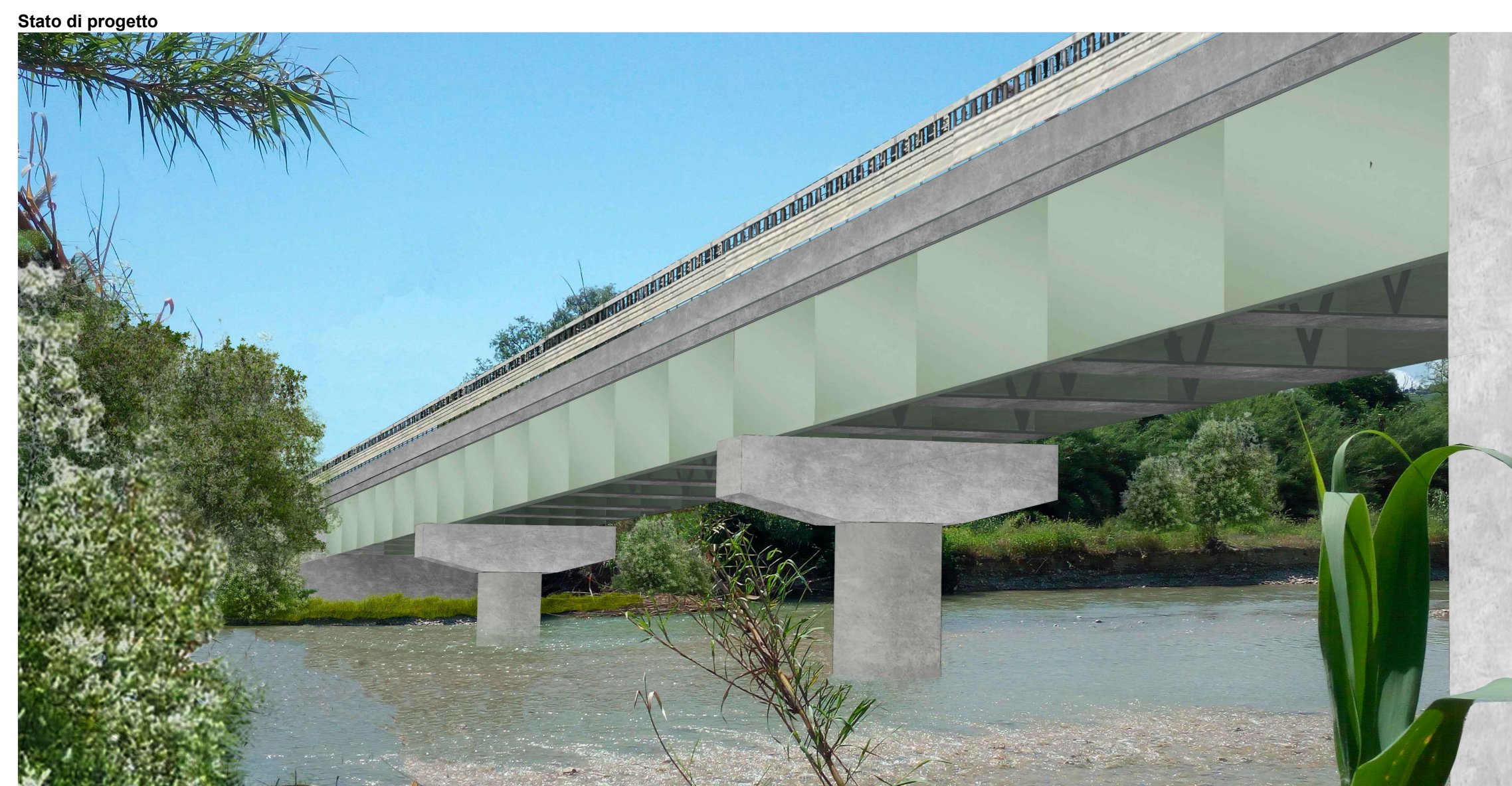
04 Fotoinserimento viadotto su fiume Tordino