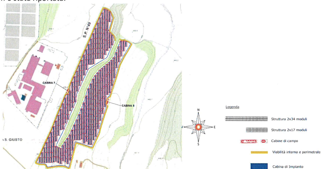
Fig.2 dettaglio dell'organizzazione di uno dei sottocampi (FV3) in rapporto con il contesto tutelato