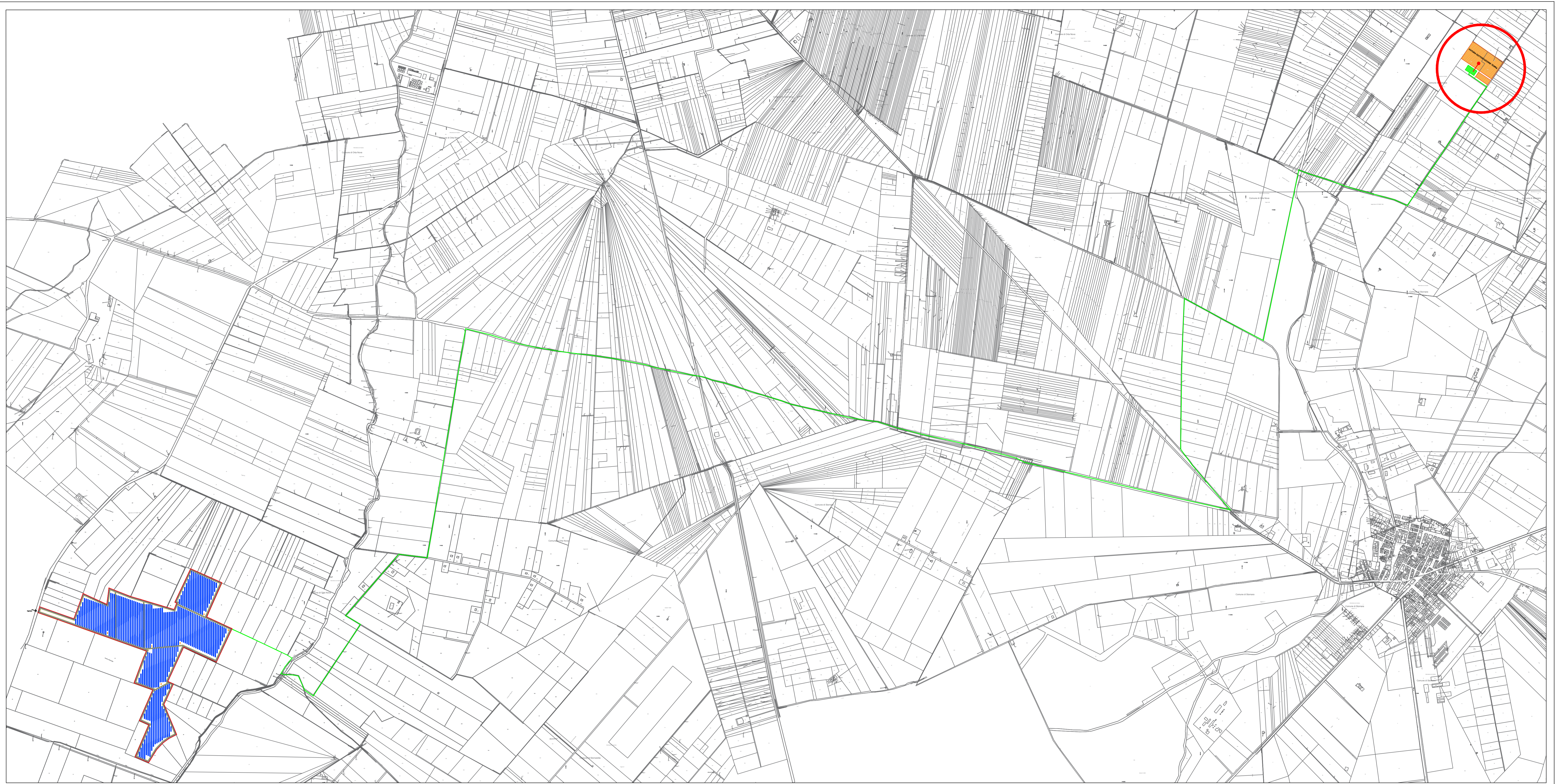
LOCALIZZAZIONE CAMPO E SOTTOSTAZIONE Scala 1 : 10.000