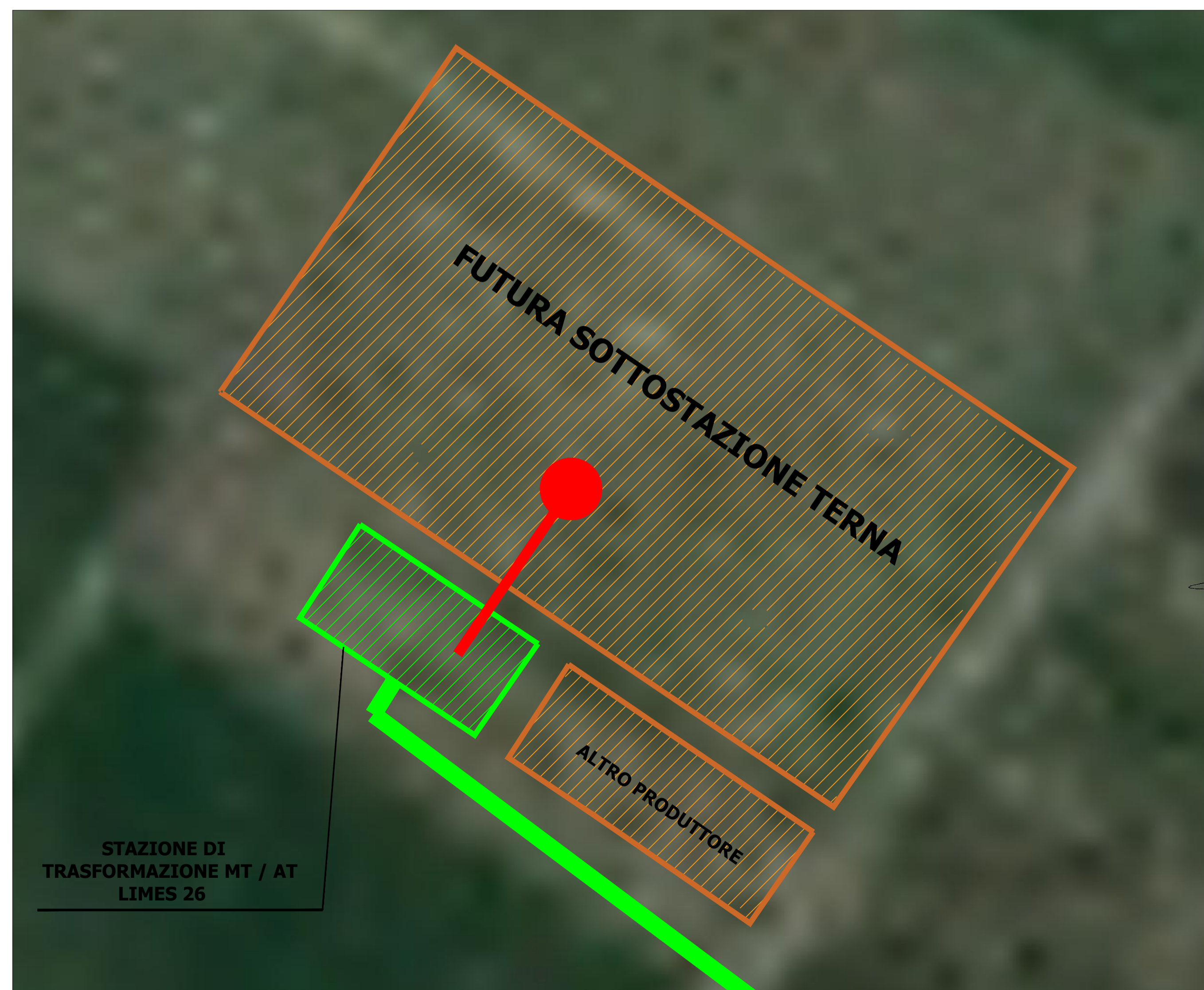
CAVIDOTTO IN AT SU ORTOFOTO Scala 1 : 1.000