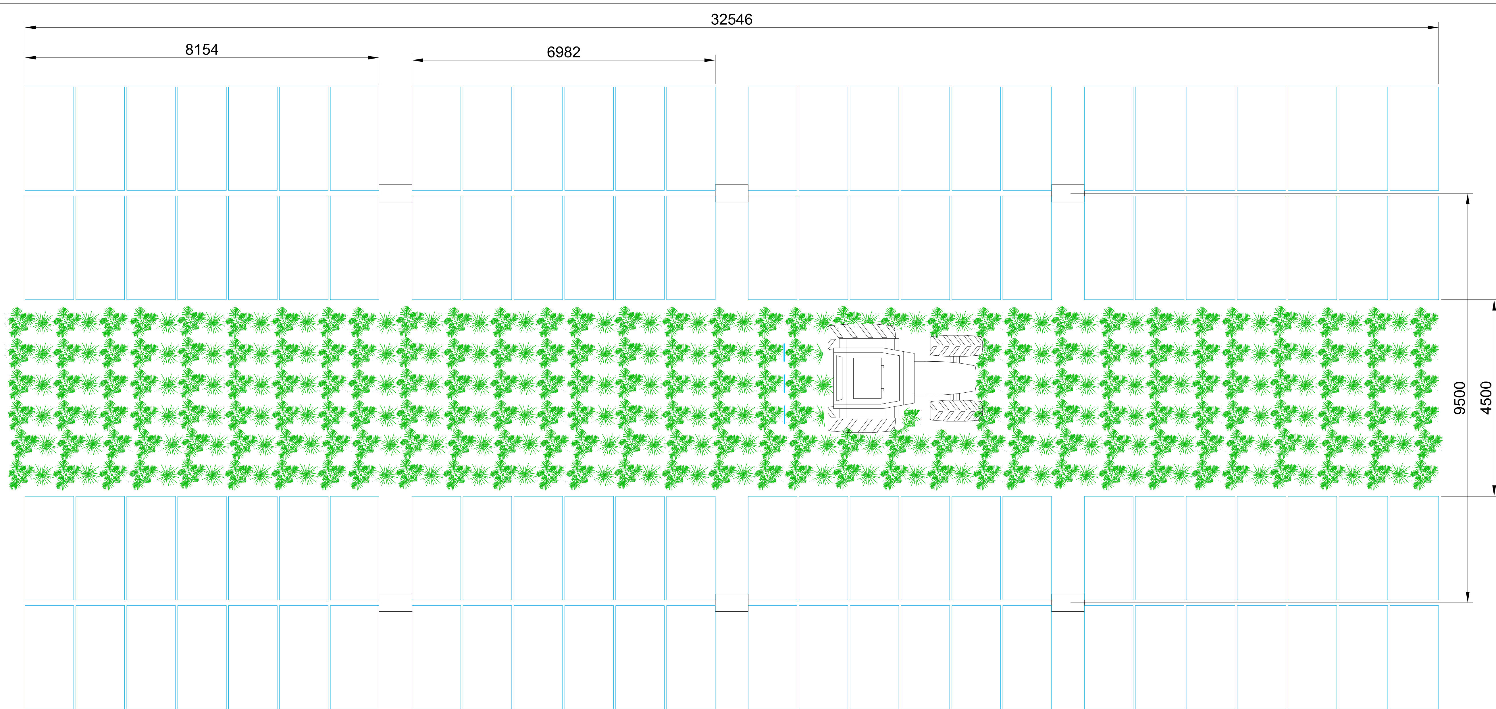
VISTA FRONTALE INSEGUITORI - SCALA 1:50