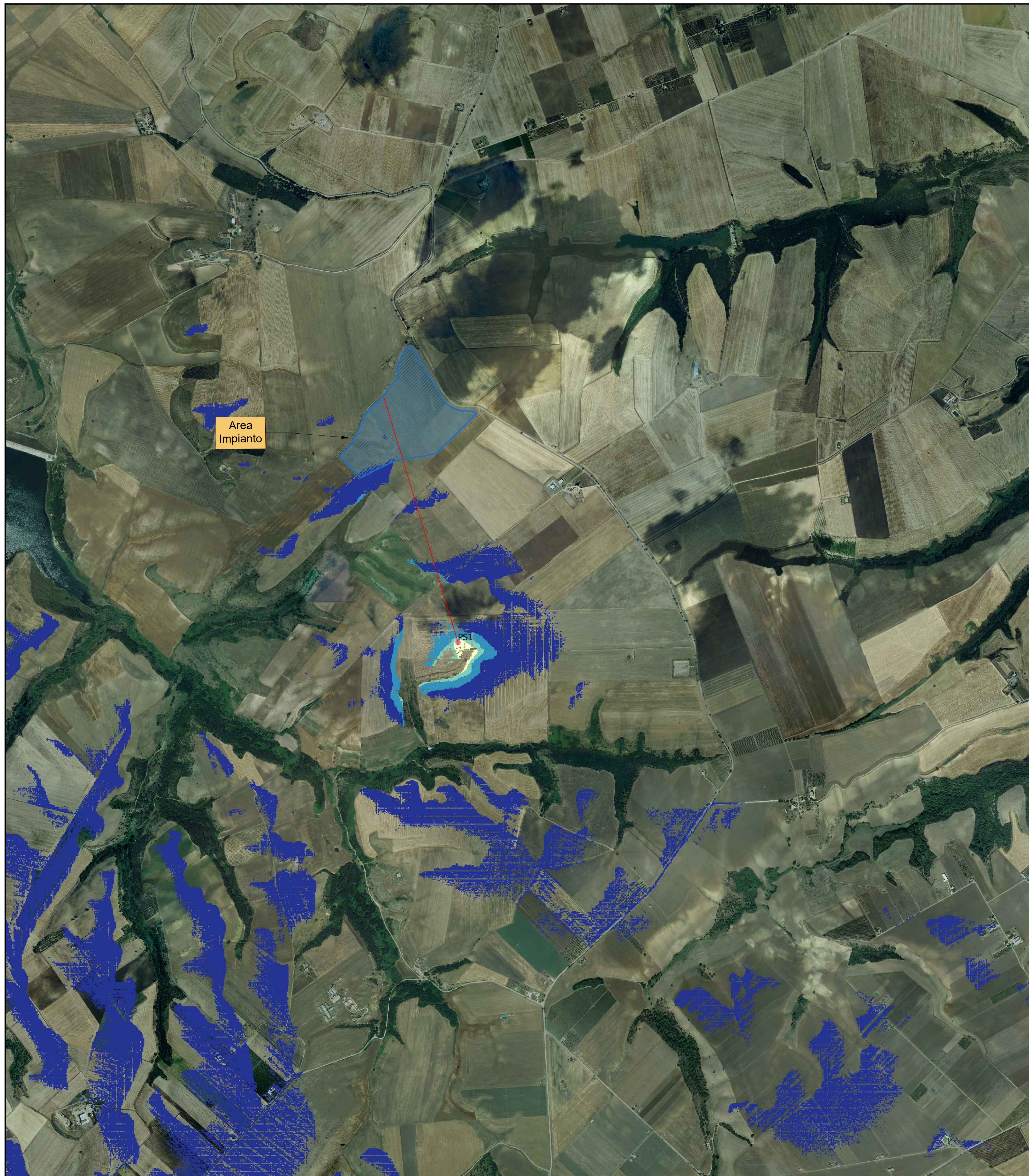
Profilo Punto Sensibile PS1 - Masseria Casone