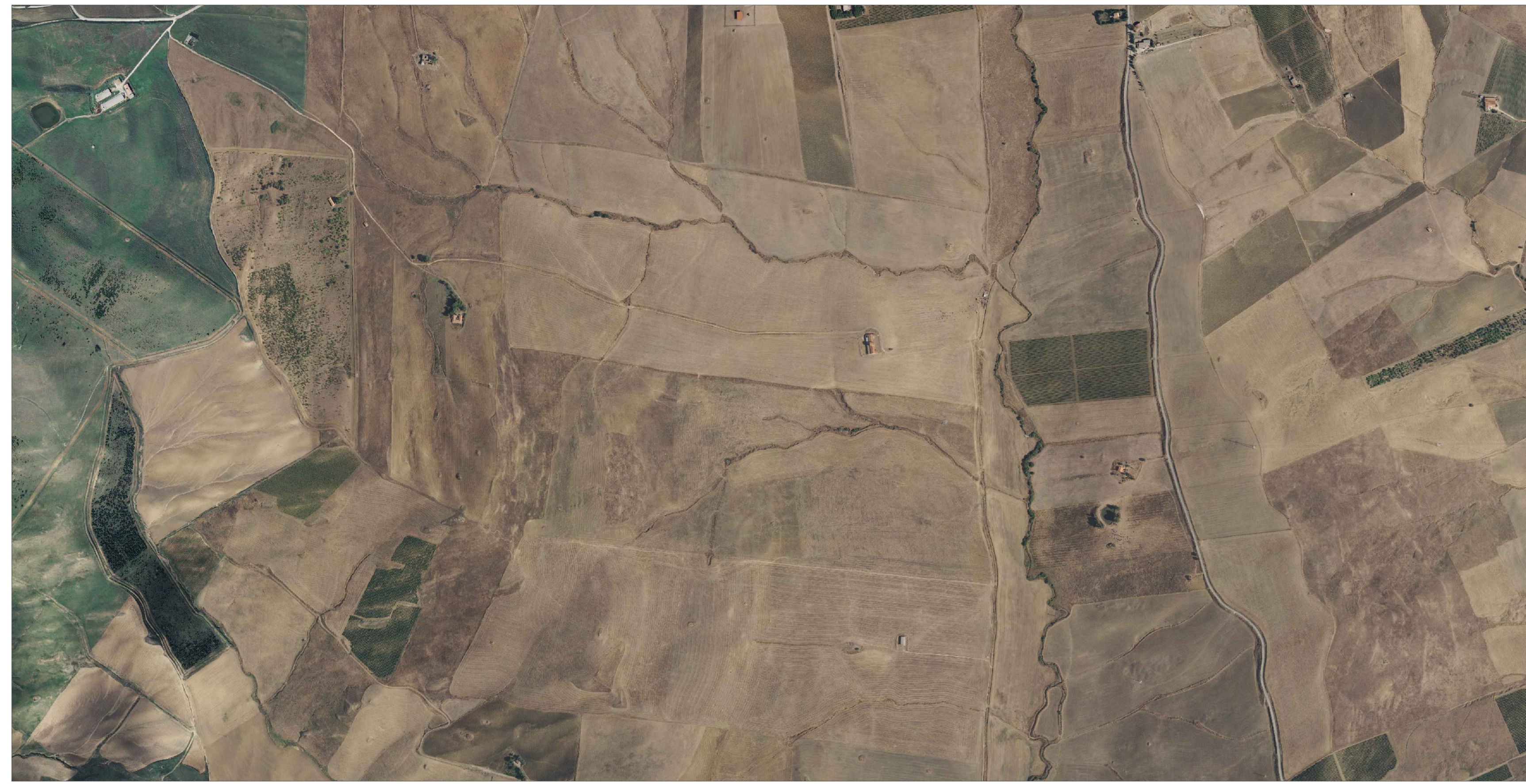
ORTOFOTO SICILIA AREA DOVE VERRA' REALIZZATO L'IMPIANTO - F.20/23 - COM. PIANA DEGLI ALBANESI