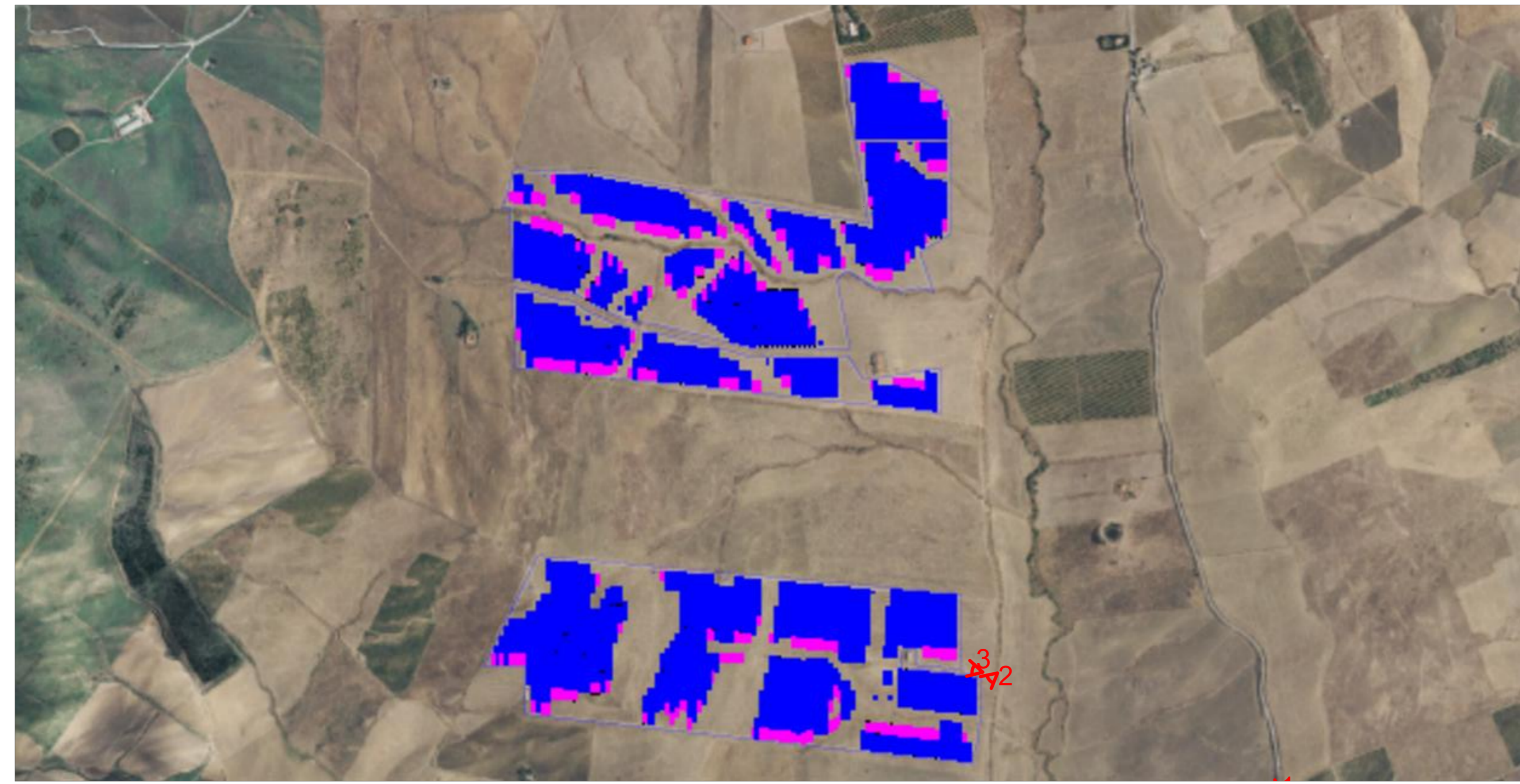
ORTOFOTO SICILIA AREA IMPIANTO E PUNTI DI VISTA - F.20/23 - COM. PIANA DEGLI ALBANESI