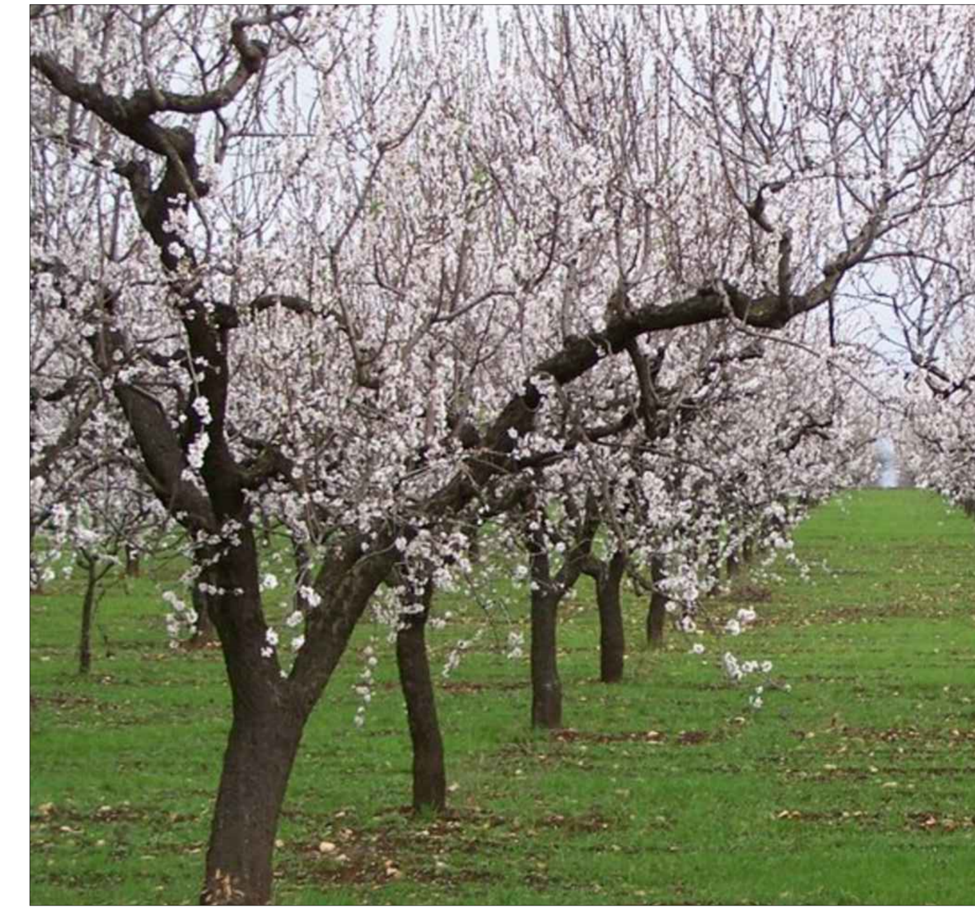
TIPOLOGIA PIANTE COLTIVABILI - MANDORLO