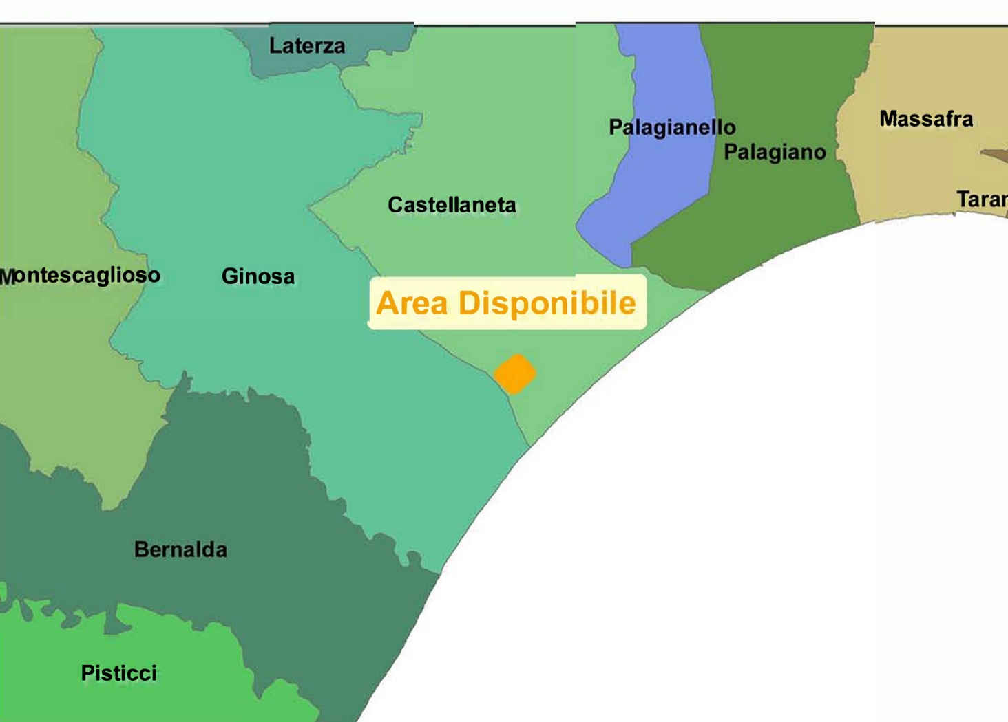
INQUADRAMENTO TERRITORIALE - COROGRAFIA SU CTR - SCALA 1:15.000