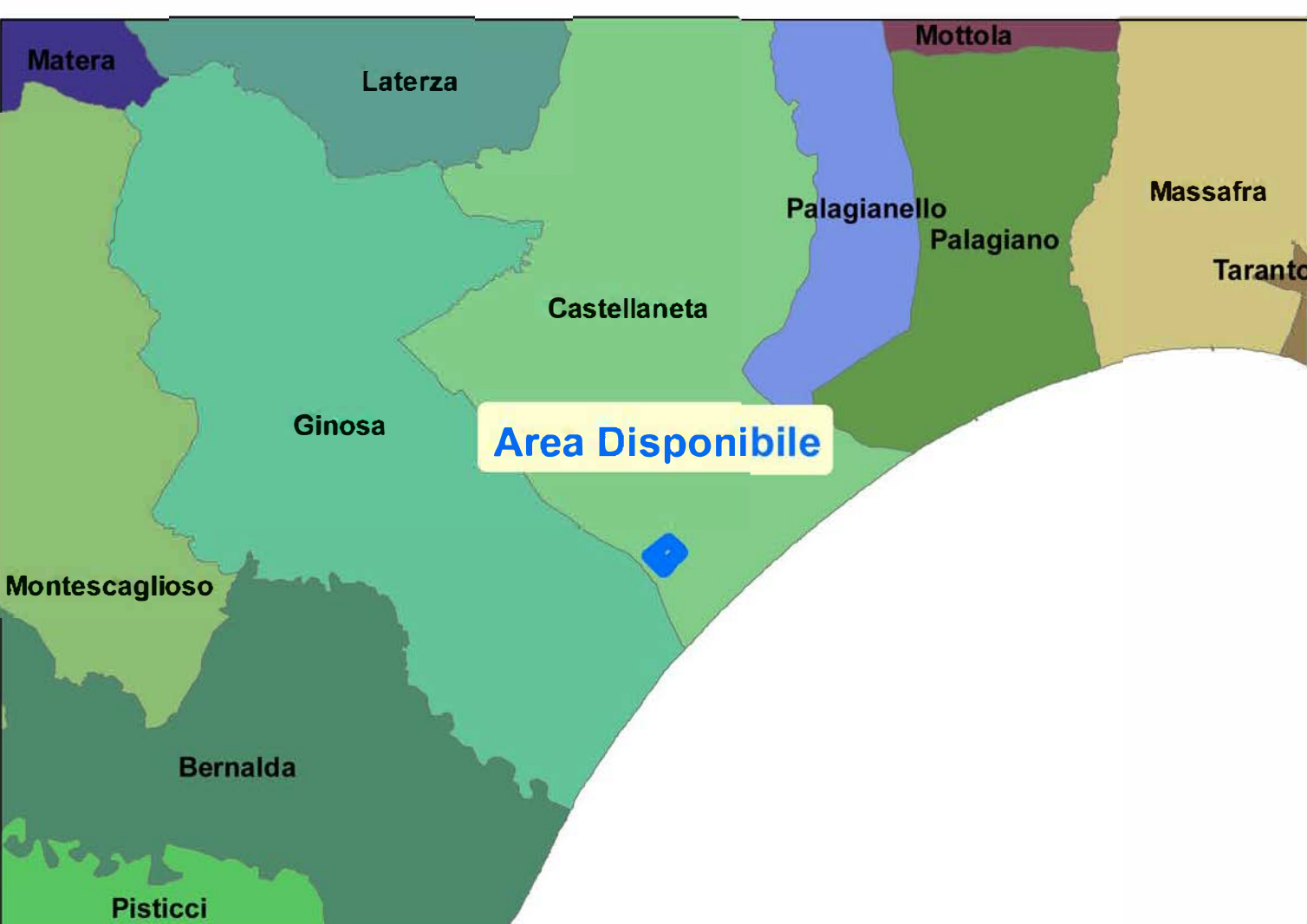
INQUADRAMENTO TERRITORIALE - SCALA 1:200.000