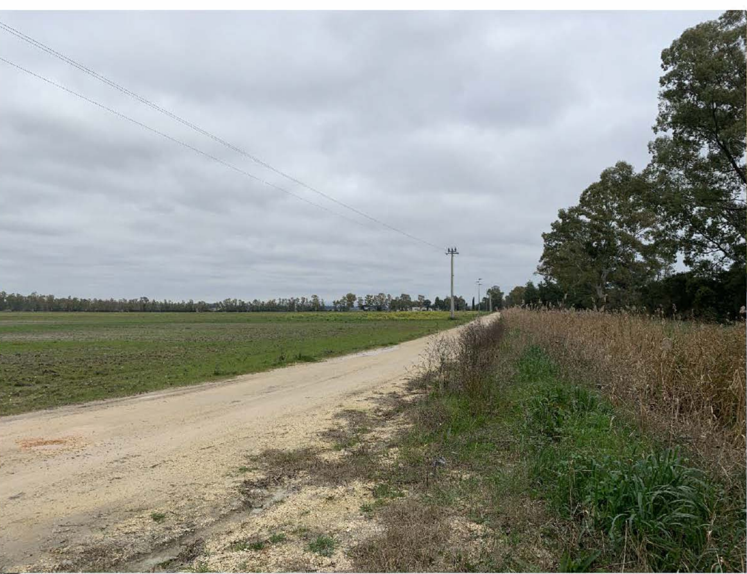
VISTA DEL SITO DA VIA TRATTURELLO PINETO