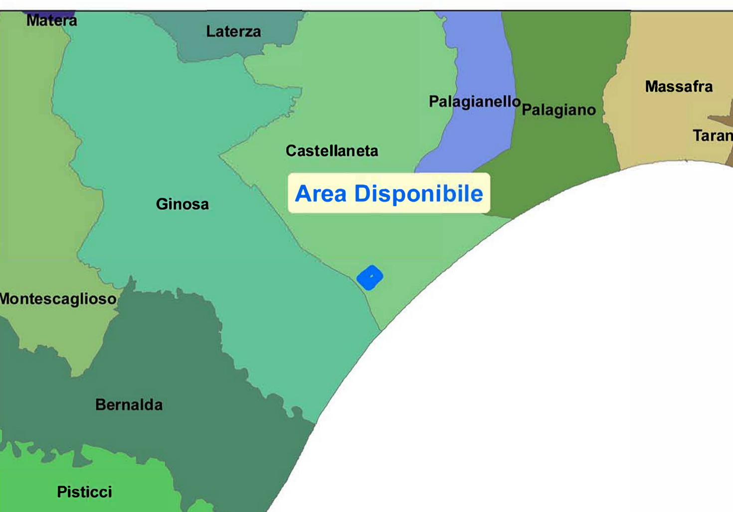
INQUADRAMENTO TERRITORIALE - SCALA 1:200.000