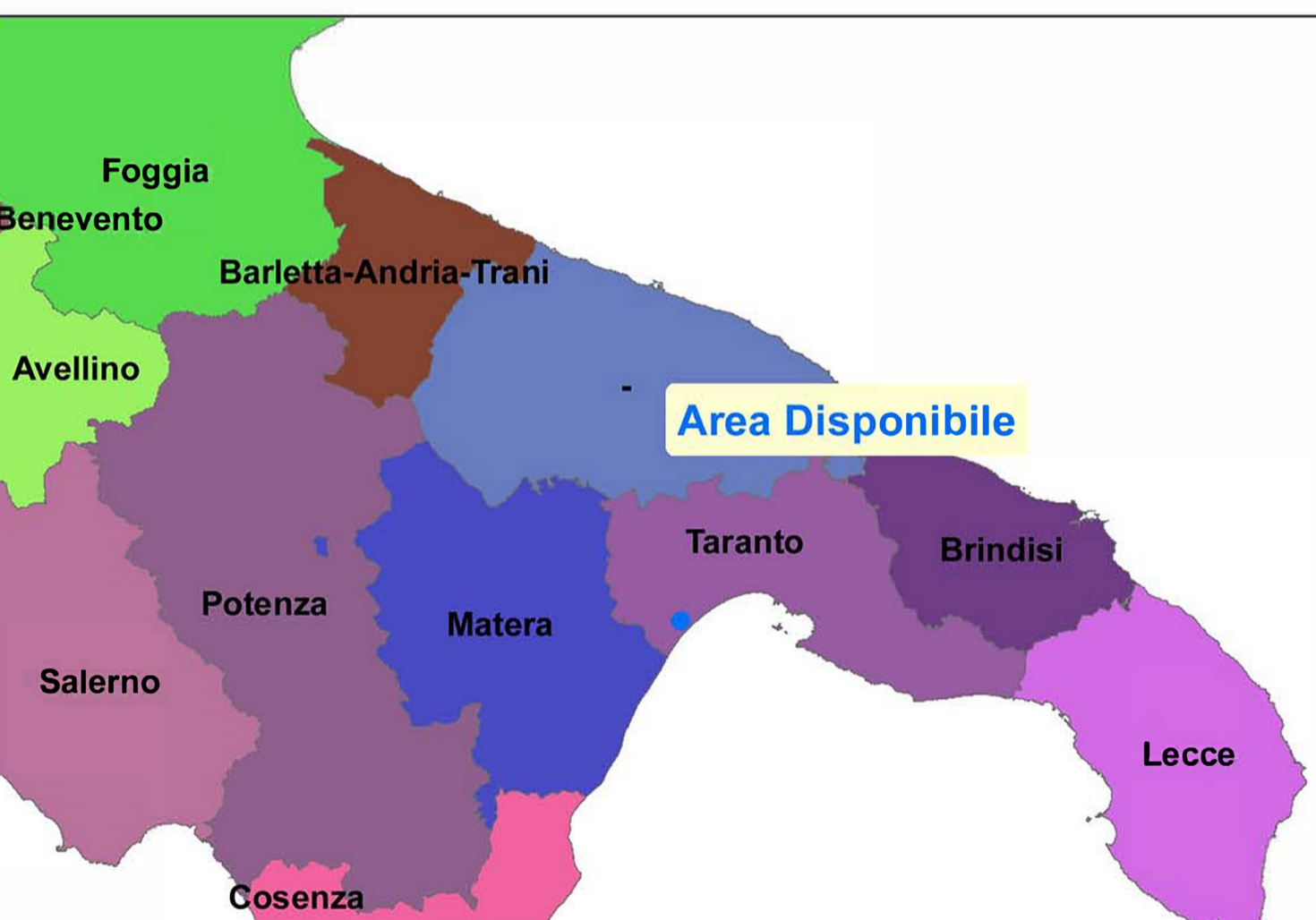
INQUADRAMENTO TERRITORIALE - SCALA 1:1500.000